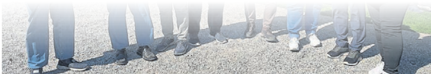
Auch einige Griesheimer sind zur Eröffnungsveranstaltung der Hessischen Spargelsaison nach Weiterstadt gekommen. Der Weg war kurz, das Wetter hervorragend, die Stimmung gut und das gemeinsame Spargelessen sehr lecker.

www.plegge-medien.de/service/abonnentenservice