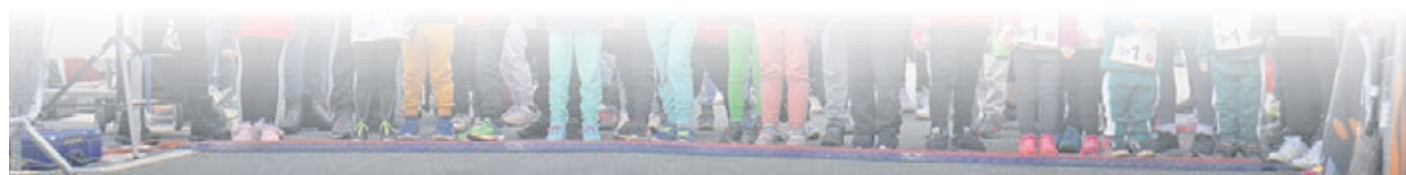
Beim Lauf der Bambinis – unter Sechsjährige – tragen alle Kinder die Startnummer 1. Auch in diesem Jahr wollen die jüngsten Läufer wieder zeigen, wie schnell sie sind. Der Startschuss erfolgt um 11.40 Uhr.

www.plegge-medien.de/service/abonnentenservice