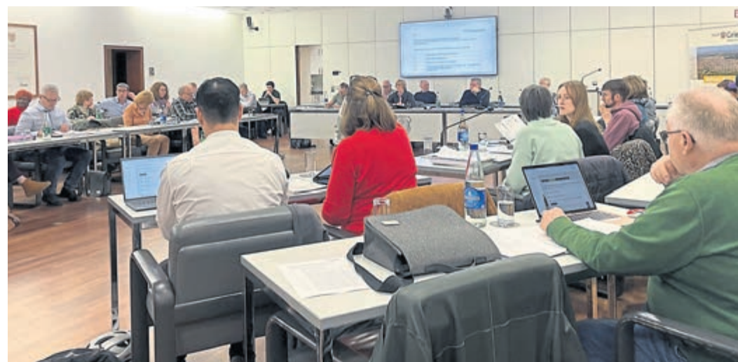
In ihrer dreistündigen Versammlung beschloss die Stadtverordnetenversammlung am vergangenen Donnerstag den viel diskutierten Haushalt mit 17 zu 13 Stimmen.

Schnell erkannte das Schülerquartett seine Fähigkeit, die Zeit anhalten zu können. Für den Außenseiter Samuel das Beste, was ihm passieren konnte. Um sich selbst Vorteile zu verschaffen, verteilte er Aufgaben an seine Mitschüler, bevor er sich bereit erklärte, mit der gemeinsam aufgesagten „Zauberzahl“ in die Gegenwart zurückzukehren. „Jedes Mal, wenn wir die Zahl 5050 sagen, können wir die Zeit anhalten oder weiterlaufen lassen“, überwältigt von dieser ungewöhnlichen Entdeckung, überlegten die vier Schüler, was sie mittels dieser Fähigkeit alles machen könnten. Dabei offenbarten sich unter-