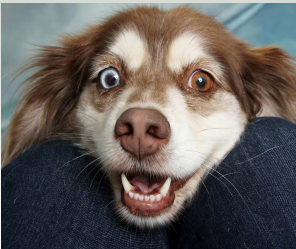
Der Deutsche Tierschutzbund ruft Unternehmen dazu auf, ihren Mitarbeitenden zu erlauben, Hunde in den Betrieb mitzunehmen (Symbolbild).

Am 5. Juni erobern die Vierbeiner den Arbeitsplatz