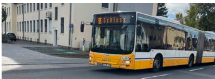
Die Haltestellen werden an den Fahrbahnrand verlegt.

Die Heag-Mobilo führt im Bereich der Kantstraße und der Herweghstraße in Griesheim sowie am Waldfriedhof Gleisarbeiten durch. An der Haltestelle „St. Stephan“