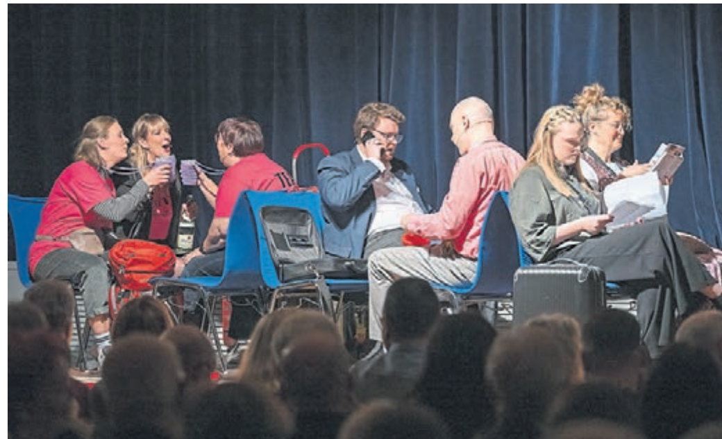
Pfungstadt (sh). Am vergangenen Samstagabend feierte das neue Stück der „Sandbachmimen“ in der Sport- und Kulturhalle Premiere. „Es fährt kein Zug nach Irgendwo“ erzählt eine Geschichte von Zugreisenden, wie sie sicherlich des Öfteren auf dem riesigen Schienennetz der Deutschen Bahn vorkommt. Das Bahn-Abenteuer begleitet die Reisenden des ICE6948, der einen außerplanmäßigen Halt einlegen und die Fahrgäste an einem trostlosen Provinzbahnhof zurücklassen muss. Ohne Handypfänger, Taxis und ohne Aussicht auf Weiterfahrt. Zudem erfahren die Fahrgäste, dass sich unter ihnen ein Psychopath befinden muss – und wie nicht anders zu erwarten, nimmt ein witziges Nervenchaos seinen Lauf. Letzmal ist das Stück am heutigen Samstag, 22. März, um 19 Uhr in der Sport- und Kulturhalle zu sehen. Weitere Infos: sandbachmimen.de

„Sandbachmimen“ widmeten sich dem Bahnchaos