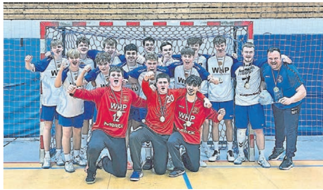
Mit dem Gewinn der Meisterschaft hat sich die Handball-A-Jugend vom TSV Pfungstadt die Teilnahme an der Regionalligaqualifikation für die Saison 2025/26 gesichert.