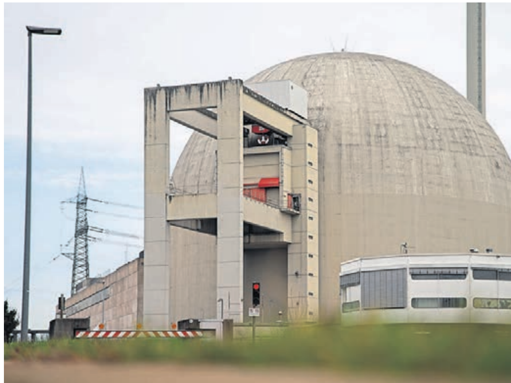
Auf dem Gelände des ehemaligen AKW Biblis soll nach dem Willen der hessischen Landesregierung ein Standort zur Entwicklung der Kernfusion errichtet werden.

Auch der Kreis Bergstraße wird dabei eine Rolle spielen, denn es ist unter anderem geplant, auf dem Gelände des ehemaligen AKW in Biblis einen Reaktor zu bauen. Wie der Kreis Bergstraße mitteilt, soll der Bau