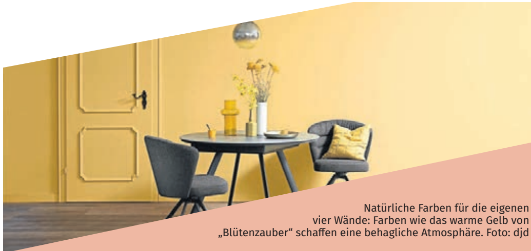
Natürliche Farben für die eigenen vier Wände: Farben wie das warme Gelb von „Blütenzauber“ schaffen eine behagliche Atmosphäre.

(red). Eine attraktive, trendbewusste Gestaltung der eigenen vier Wände und das Thema Nachhaltigkeit müssen sich nicht ausschließen – ganz im Gegenteil. Wenn es um ökologisch sinnvolle Konzepte geht, gewinnen Naturmaterialien von Massivholz bis Stein stark an Bedeutung. Für den Anstrich von Wänden und Möbelstücken wiederum erleben Kreidefarben ein regelrechtes Comeback. Sie sind nicht nur schön anzusehen, sondern auch nachhaltig und umweltfreundlich. So enthalten diese Farben keine bedenklichen Chemikalien, sondern können durch ihre natürlichen Eigenschaften ein gesundes Raumklima fördern.