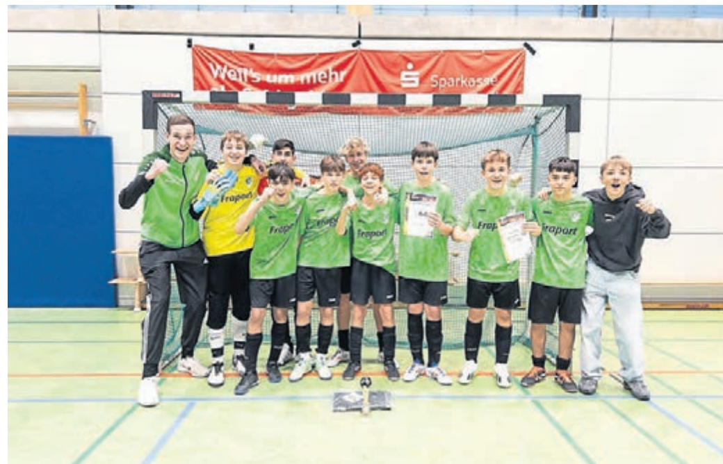
Von vielen unerwartet, dragen die C-Junioren des SV Hahn bei den Hallenkreismeisterschaften im Fußball bis ins Finale vor und holten so Rang Zwei.

eine kämpferische Mannschaftsleistung als Gruppen erster gegen die SG Arheilgen, DJK SSG Darmstadt und SG Eiche Darmstadt durch. Im Halbfinale traf man dann auf den Gruppenligisten Germania Eberstadt. In diesem Spiel setzten die Jungs noch einmal eins drauf und zogen mit einem 1:0 ins Finale der Hallenkreismeisterschaften ein. Dort wartete die SG Arheilgen, welche in der Gruppenphase bereits geschlagen werden konnte. Trotz eines großen Kampfs und hohem Siegeswillen musste man sich mit 0:2 im Finale geschlagen geben. „Natürlich war die Enttäuschung zu spüren, aber die Jungs dürfen sich nach überragendem Kampf, starken Leistungen und großen Emotionen Hallenvizemeister nennen“, so Jugendleiterin Nicole Ihrig.