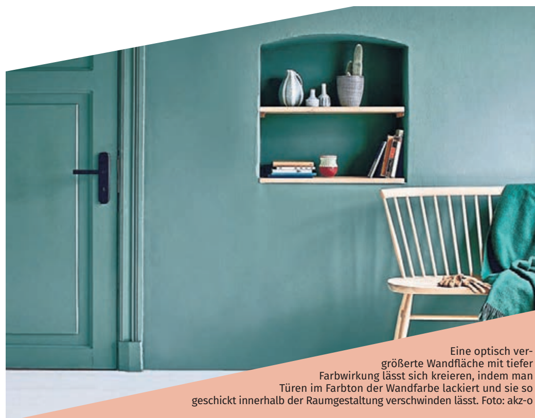
Eine optisch vergrößerte Wandfläche mit tiefer Farbwirkung lässt sich kreieren, indem man Türen im Farbton der Wandfarbe lackiert und sie so geschickt innerhalb der Raumgestaltung verschwinden lässt.

Tolle Tipps zur Farbgestaltung von Innenräumen