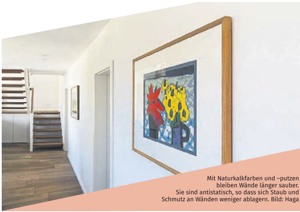
Mit Naturkalkfarben und -putzen bleiben Wände länger sauber. Sie sind antistatisch, so dass sich Staub und Schmutz an Wänden weniger ablagern.

Mit seinem pH-Wert im alkalischen Bereich verhindert Kalk das Wachstum von Algen und Schimmel. Auch anhaftende