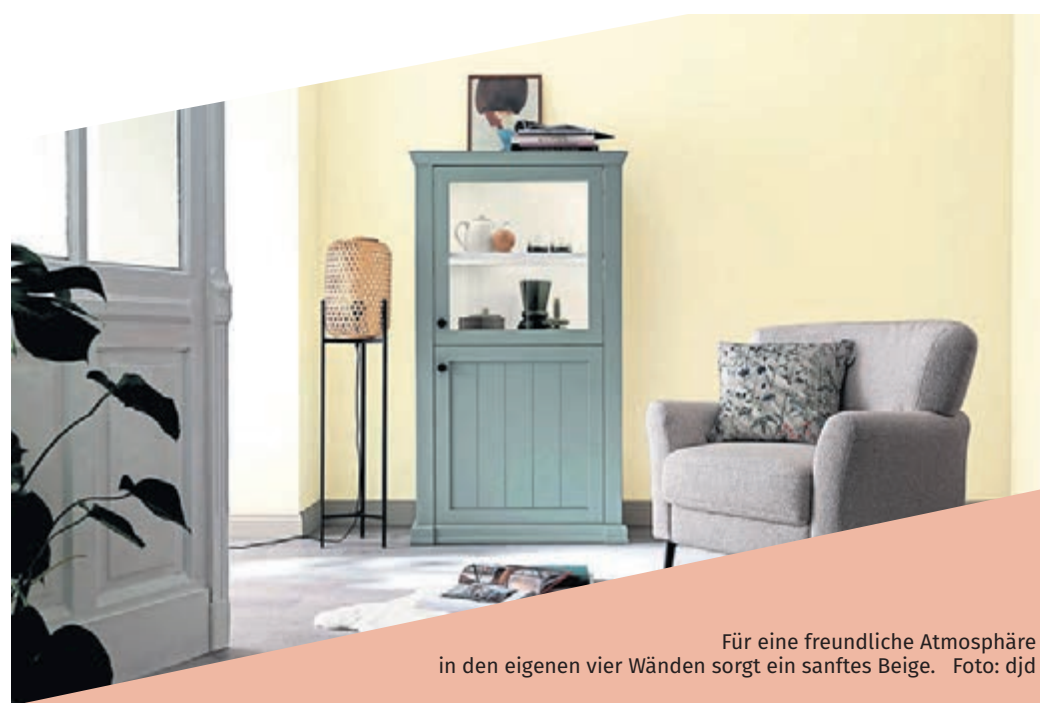
Für eine freundliche Atmosphäre in den eigenen vier Wänden sorgt ein sanftes Beige.

Dem Zuhause eine entspannte und beruhigende Atmosphäre verleihen