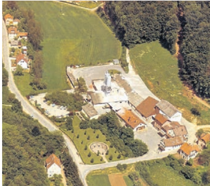
Das einstige Marmoritwerk in Auerbach und Hochstädten ist Teil der Ausstellung der Stadtteildokumentation Auerbach.

Im 19. Jahrhundert begann in Hochstädten der industrielle Abbau des Marmors. Ein Augenmerk der Ausstellung liegt dabei auf der späteren Umnutzung der unterirdischen Stollen während des Zweiten Weltkriegs zur Produktion hochpräziser Kreiselinstrumente für die