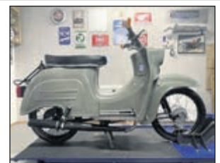
Schwalbe KR51/2 , 4-Gang, 12V-Vape, Bing, 60km/h, KBA-Papiere, Neu-aufb., TOP, €3485. ☎ 0179-8254492

Kaufe Motorräder alle Marken, alle Modelle, Quad, UTV, Chopper, Enduro, Beiwagen, E-Roller oder E-Bikes, Auch mit Mängeln oder Unfall, Bitte alles anbieten, zahle bar ☎ 06158/6086991 o. 0173/3087449