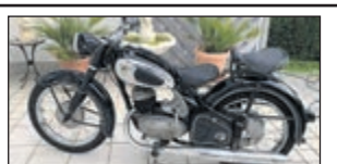
DKW Motorrad RT 175 (1954) Motor überholt von Sauer & Sohn, 3.900 € (☎ 06071 43168)

Kaufe alle Autos, auch defekt oder Schrott. Bitte alles anbieten. 06258 / 5 08 99 21 0151 / 71 87 23 06