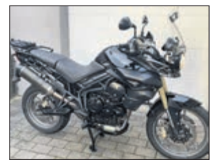
Triumph Tiger800 EZ07/11, HU10/25 , 26Tkm, Öl+Filter neu, Komfortsitze, TOP, €5485. ☎ 0179 8254492

Suche Baumaschinen, Traktoren, Bagger und Anhänger aller Art, bitte alles anbieten, zahle bar und Höchstpreise ☎ 0174/6004673