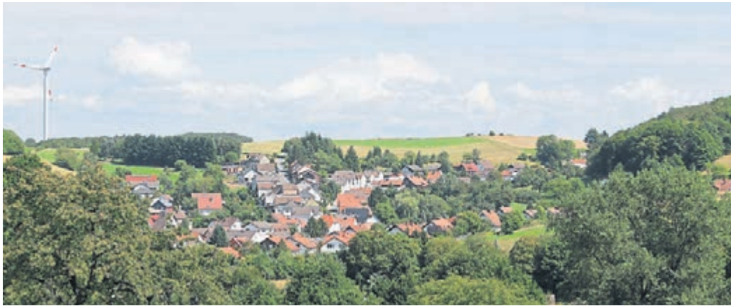
Der Seeheim-Jugenheimer Ortsteil Ober-Beerbach soll in naher Zukunft zum Hauptort der neuen Gemeinde „Groß-Beerbach“ werden.

Behörde plant die Gründung von „Groß-Beerbach“