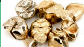
Zahngold (auch mit Zähnen)