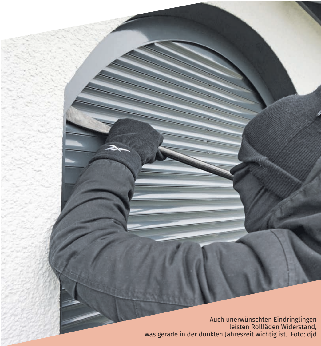
Auch unerwünschten Eindringlingen leisten Rollläden Widerstand, was gerade in der dunklen Jahreszeit wichtig ist.

Sonnenschutzsysteme nützen auch in der kalten Jahreszeit