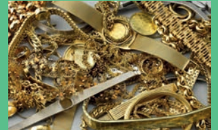
Altgold & defektes Gold