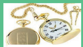
Taschenuhr aller Art

Gerne überprüfen wir Ihren Schmuck auf Echtheit! Hausbesuche bis zu 60 km kostenlos!