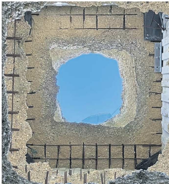
Im Bensheimer Museum werden Werke ukrainischer Künstler gezeigt.

Bensheim (red). Im Museum Bensheim präsentieren die beiden ukrainischen Künstler Victoria Pidust und Volo Bevza ab Samstag, 15. März, in ihrer Ausstellung „After you“ Arbeiten, die, so die Stadt Bensheim in einer Meldung, die Grenzen zwischen Abstraktion und Figuration erforschen.