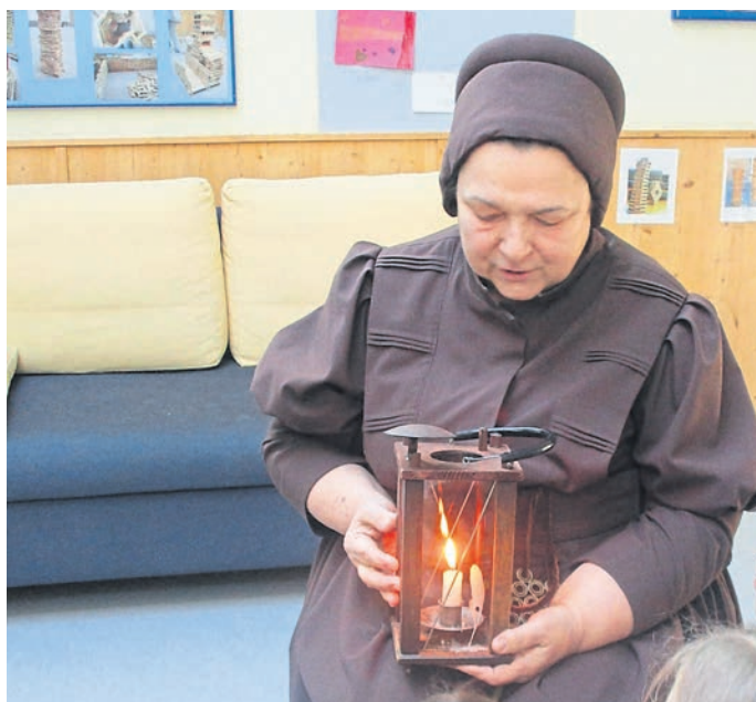
Die Fraa vun Bensem war im Kinderhaus Effax zu Gast und erzählte spannende Geschichten.