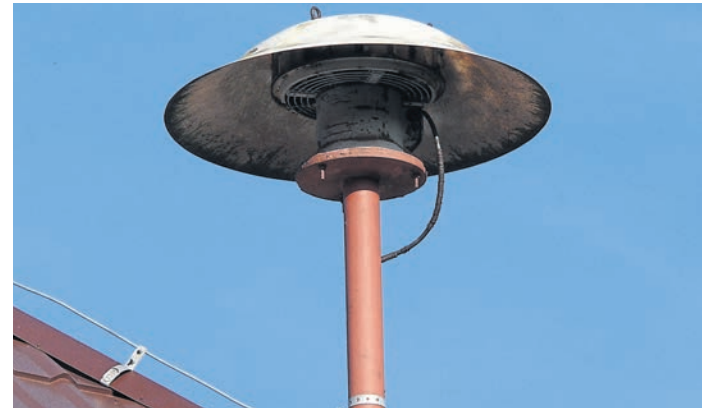
Am 13. März heulen in Hessen die Sirenen zum landesweiten Warntag (Symbolbild).

„Der Warntag soll erneut dazu beitragen, die Akzeptanz und das Wissen um die Warnung der Bevölkerung in Notlagen zu erhöhen“, so Innenminister Roman Poseck. „Durch die Probewarnung