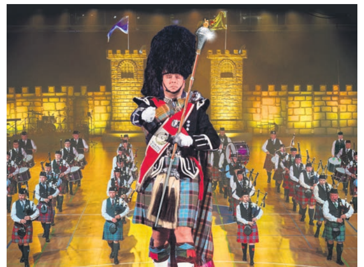
Die volle Portion Schottlandatmosphäre verspricht die Show in der Bensheimer Weststadthalle.

Die Show kombiniert traditionelle Klänge mit modernen Elementen: Neben klassischen Bagpipes und Drums sorgen Balladen und Rock-Interpretationen von Simon & Garfunkel, Phil Collins und Coldplay für besondere Gänsehautmomente, versprechen die Veranstalter. Höhepunkte sind das kraftvolle Drumfeuerwerk der Trommler und die Tänze