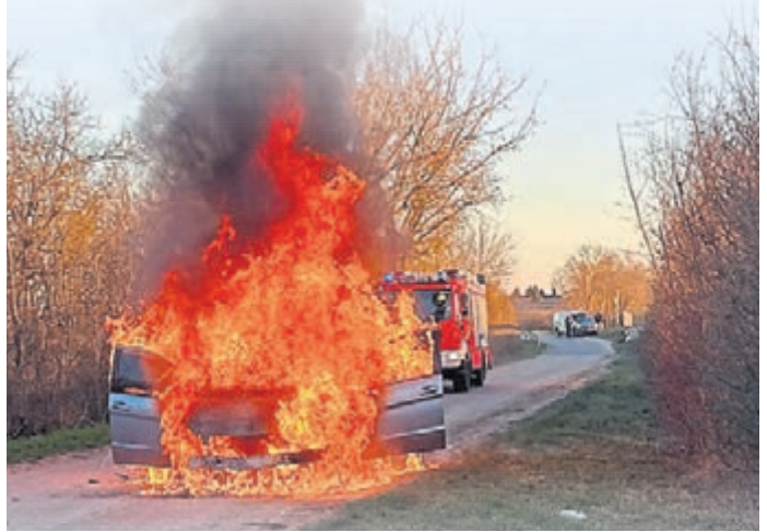
Am Mittwochmorgen, um kurz vor sieben Uhr, geriet ein Auto aus bisher unbekanntem Gründen während der Fahrt in Brand.

Nach Angaben von Polizeibeamten überschlug sich und bei