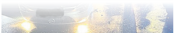
In der vergangenen Woche, am Donnerstag, dem 13. März, überschlug sich ein Auto in der Oberndorfer Straße.

konnte weder durch seine eigenen Mitspieler, noch durch die Dorteilweiler, aufgehalten werden. „Hier kommt es zur einzigen Handlung aus Sicht