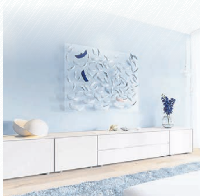
Endloses Seidenblau erinnert an einen Urlaub am Meer und lässt sich vielseitig mit den unterschiedlichsten Einrichtungsstilen kombinieren.

Vor allem Vielfalt und Individualität sind Trumpf. Auf diesen kurzen Nenner lässt sich die Bandbreite der angesagten Farben für 2025 bringen. Denn von zarten und hellen Varianten bis zu einer kraftvollen oder dunklen Wandgestaltung dürften alle ihren persönlichen Favoriten finden. Wer sich nach Frühlingsstimmung sehnt, wird etwa mit hellen Gelb-Grün-Tönen glücklich werden. Die Farbe, die an Lindenblüten erinnert, lässt sich zudem vielfältig kombinieren, ob mit Weiß, Rosé, Bronze oder dunklen Farben. Feines Kieselweiß kommt mit