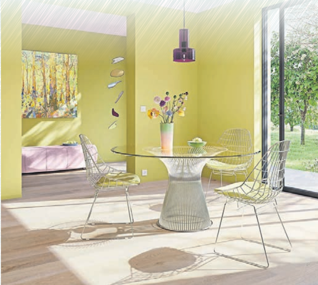
So hält der Frühling Einzug ins Zuhause: Duftendes Lindgrün steht für Frische, Aufbruch und eine fröhliche Atmosphäre.

Die passende Farbe für die eigenen Räume finden