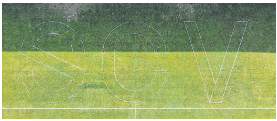
Für die Viktoria-Junioren stehen die nächsten Rundenspiele auf dem Plan.

führt. Im neuen Jahr soll die Leistung konstanter werden. Mit der SKG Gräfenhausen II haben sich die E4-Junioren zum Start ins neue Jahr auseinanderzusetzen. Aus den sechs bislang ausgetragenen Spielen gingen die jungen Kicker fünf Mal als Sieger vom Platz. Der sechste Sieg ist gegen die SKG ist im Bereich des Möglichen. Die Gäste haben erst einmal gewonnen und erscheinen den Viktorianern unterlegen. Wenn man in der langen Winterpause nicht „eingeroestet“ ist, sollte ein Dreier vorprogrammiert sein. rgr