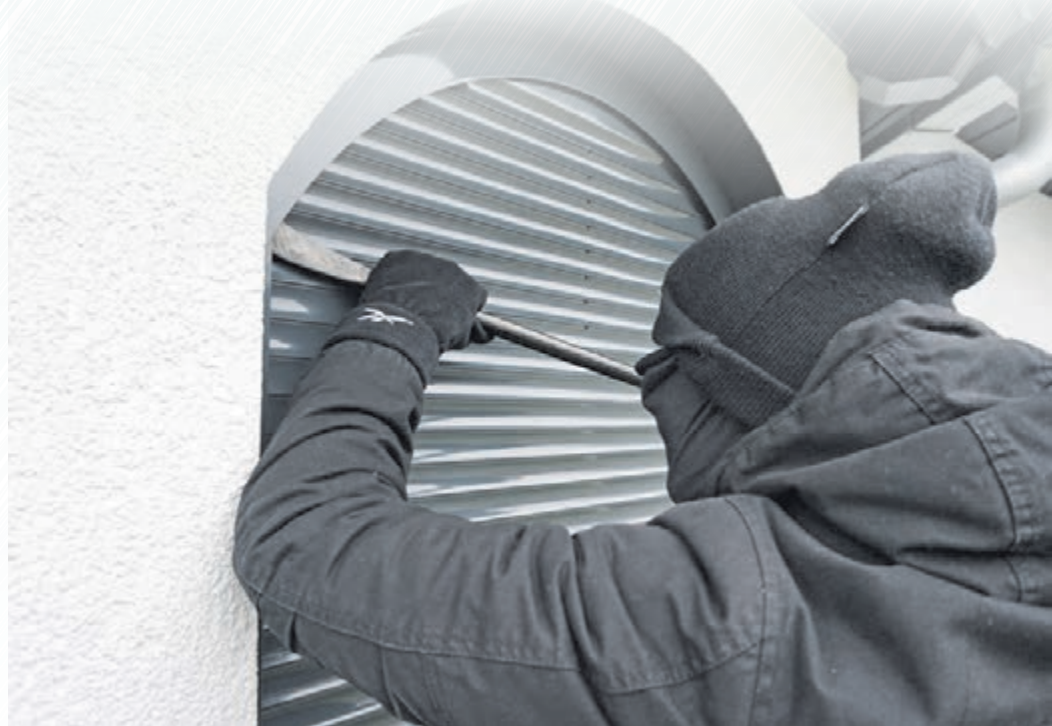
Auch unerwünschten Eindringlingen leisten Rollläden Widerstand, was gerade in der dunklen Jahreszeit wichtig ist.

Allein bei der Heizenergie ist eine deutliche Kostenminimierung möglich, wie eine Studie der Industrievereinigung Rollläden-Sonnenschutz-Automation (IVRSA) ergab. Danach können Hausbesitzerinnen und Besitzer mithilfe Außen- und Innensonnenschutz bis zu 30 Prozent der Heizwärme im Winter und Strom für die Klimatisierung im Sommer sparen. Ist die Beschattungslösung tagsüber geöffnet, kann die natürliche Wärmeeinstrahlung durch die Fensterflächen die Innenräume kostenlos und klimaneutral aufwärmen. „Setzt die Dämmung ein und die Temperaturen sinken, sollten die Rollläden jedoch wieder geschlossen werden. So entsteht zwischen Fensterscheibe und Rollladenpanzer eine isolierende Luftschicht, welche die wertvolle Wärme in den Wohn- und Arbeitsräumen hält“, weiß Steffen Schanz vom gleichnamigen Hersteller