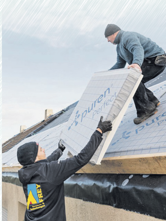
Hochleistungs-Dämmstoffe aus Polyurethan können schlanker aufgebaut werden als andere Dämmungen. Das spart Rohstoffe und Material.

Wie sich die Einsparpotenziale verschiedener Dämmstoffe im Vergleich zur grauen Energie und den grauen Emissionen verhalten, hat eine Studie des Forschungsinstituts für Wärmeschutz München untersucht. Das Ergebnis für Dämmungen aus Polyurethan (PU) war eindeutig: Je nach energetischer Qualität eines Gebäudes vor der Dämmung und nach Art der Heizenergie überschreiten die Einsparungen des Energieverbrauchs und der Treibhausgasemissionen bereits nach kurzer Zeit den Herstellungsaufwand. Bei Öl oder Gas kann die Umwelt-