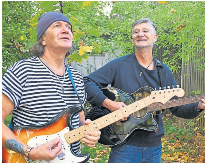
Das Darmstädter Rockpop-Duo „White Nights“ spielt am 11. April auf der Kellerbühne des Theaters im Pädagog in Darmstadt.

Darmstadt (red). Das Rockpop-Duo „White Nights“ tritt nun am Freitag, dem 11. April wieder im historischen Gewölbekeller des Theaters im Pädagog (TIP) in Darmstadt auf.