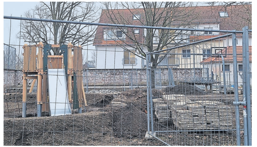
Auch im Hof wird noch fleißig gearbeitet, damit der Spielplatz rechtzeitig fertig wird.