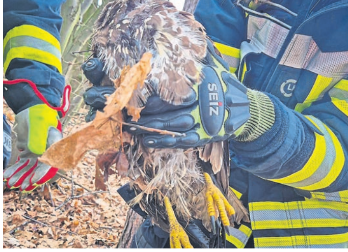
Auch die Rettung von Haus- und Wildtieren übernehmen die Einsatzkräfte der Freiwilligen Feuerwehr der Stadt Weiterstadt. In diesem Fall ging es um einen verletzten Mäusebussard, den sie geborgen und zu einer Tierarztpraxis gebracht haben.