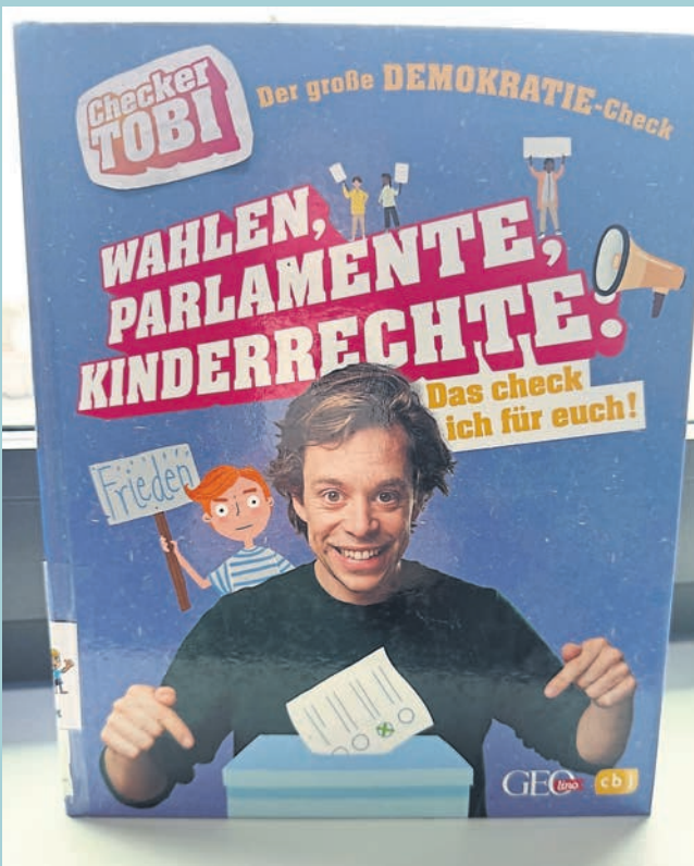
Das Team der Stadtbücherei im Medienship findet jede Woche einen neuen, spannenden Büchertipp für die Leserschaft des „Wochen-Kurier“.

Heute: „Wahlen, Parlamente, Kinderrechte“ von Tobias Krell (Kindersachbuch)