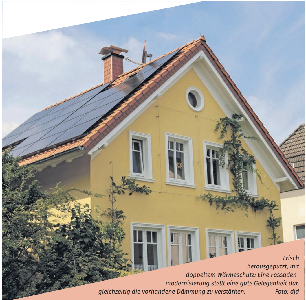
Frisch herausgeputzt, mit doppeltem Wärmeschutz: Eine Fassadenmodernisierung stellt eine gute Gelegenheit dar, gleichzeitig die vorhandene Dämmung zu verstärken.

(WDVS) nachträglich aufdoppeln – das spart Material sowie Kosten, ohne unnötig Müll zu verursachen. Jede Wärmedämmung ist besser als gar keine. Allerdings erfüllt ein Wärmeschutz zum Beispiel aus den 1970er- oder 1980er-Jahren nicht mehr die Anforderungen von heute. Eine Aufdopplung der WDVS-Fassade lohnt sich für Hauseigentümerinnen und Eigentümer gleich mehrfach: Es geht (noch) weniger Heizwärme über die Außenwände verloren, was den Energieverbrauch und somit die eigenen Emissionen senkt.