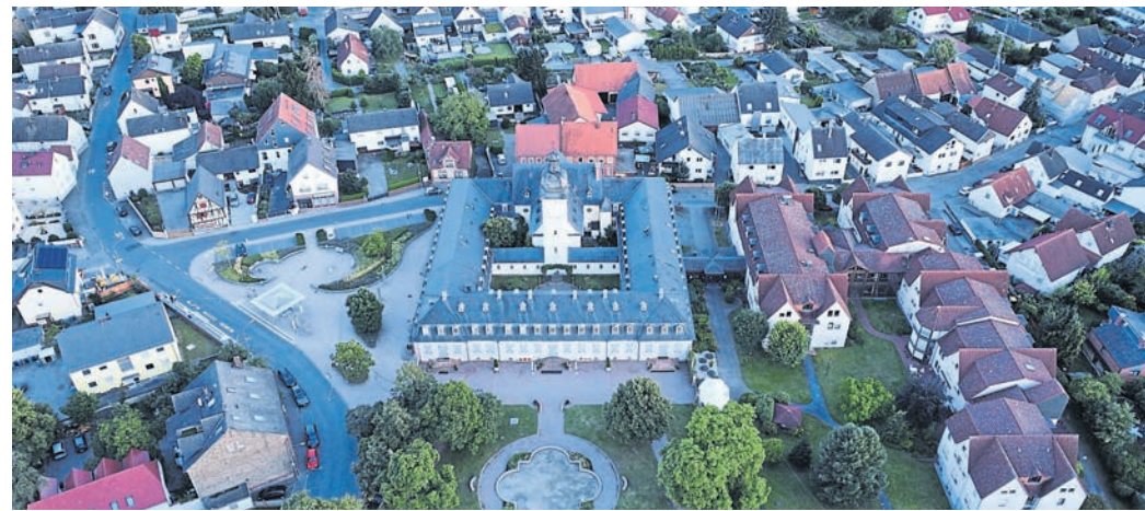
Haus- und Wohnungseigentümer in allen Stadtteilen erhalten in diesem Jahr neue Grundsteuerbescheide. Wie diese im Einzelnen ausfallen, hängt von vielen Faktoren ab.

Die neu erarbeiteten Grundsteuermessbeträge sollen laut Finanzamt Hessen die bisherigen, „nach den Einheitswerten zum 1. Januar 1964 berechneten Messbeträge“, ersetzen. „Auf dieser Basis hat die Hessische Steuerver-