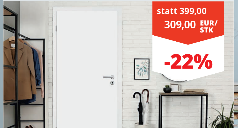
Wohnungseingangstür CPL Weiß RAL 9003 Rundkante, 41 mm stark, BxH: 86 x 198,5 cm