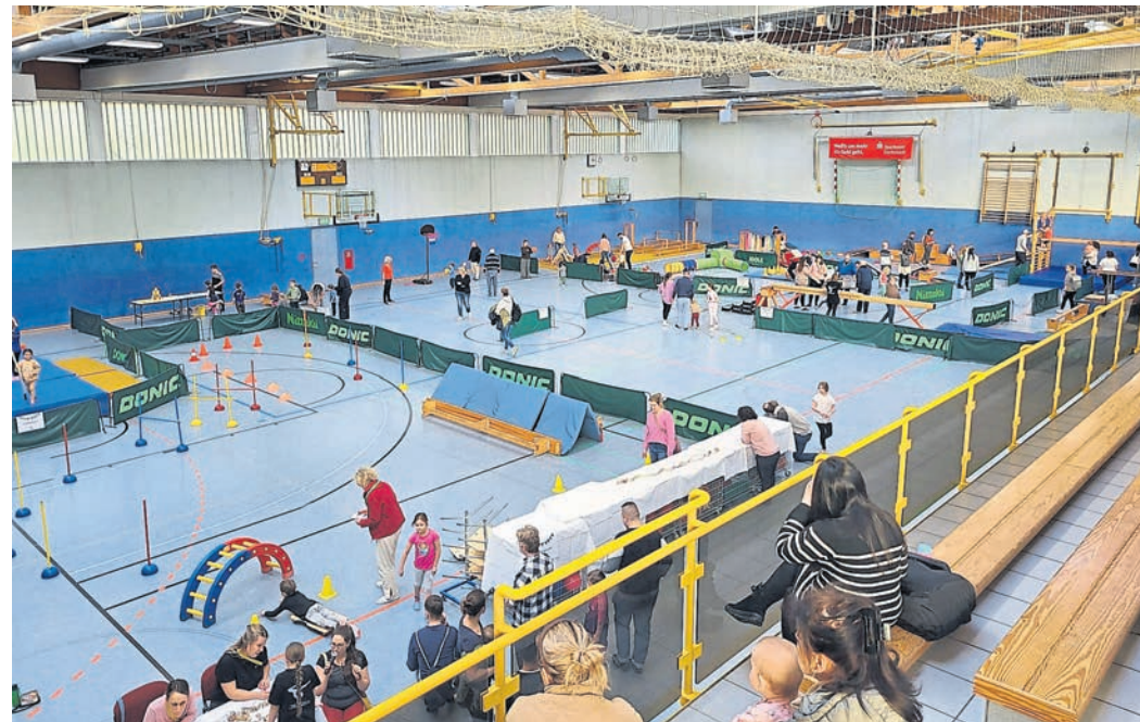
Eine ganze Halle zum Spielen, Toben und Spaß haben. Die Abteilung Turnen und Leichtathletik der SKG Gräfenhausen hatte zu einem Tag voller Aktionen eingeladen.

Dank zahlreicher Kuchen-spenden konnten sich die Kinder und ihre Familien an einem großen Buffet stärken und eine kleine Pause genießen. Auch das Kinderschminken erfreute sich großer Be-