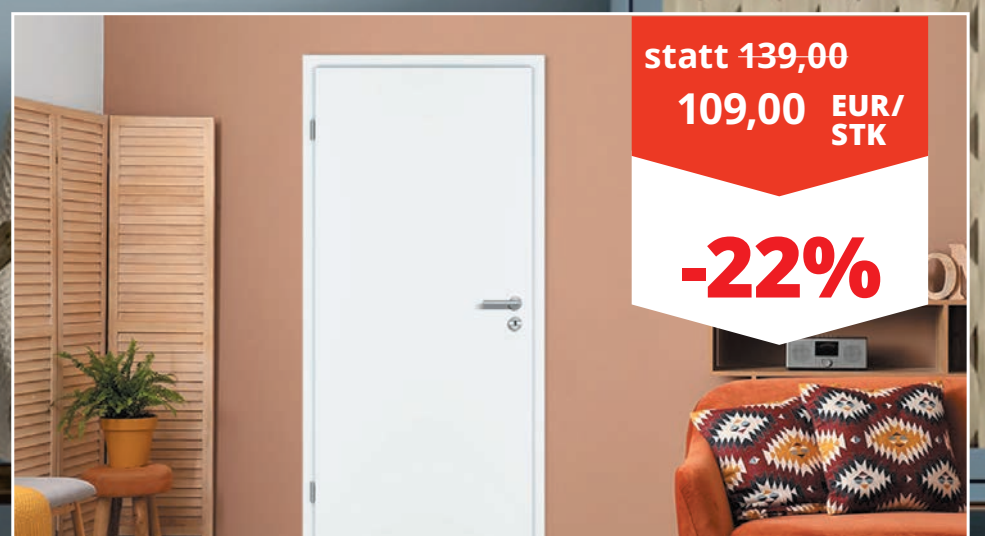
Zimmertür Weißlack RAL 9010 undkante, 39 mm stark, BxH: 98,5 x 198,5 cm