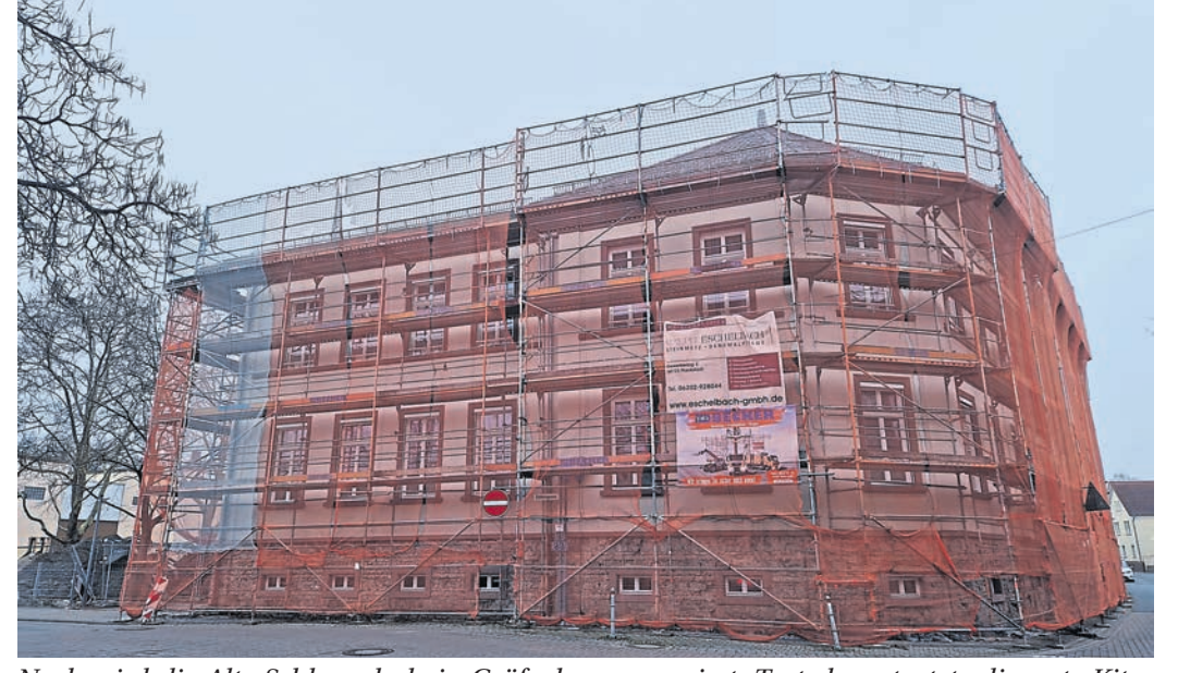
Noch wird die Alte Schlossschule in Gräfenhausen saniert. Trotzdem startete die erste Kita-Gruppe schon in den Kindergartenalltag.

Um besser planen zu können, freut sich das Veranstaltungsteam über eine