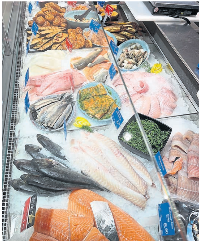
Lachs, Forelle, Hering und Co. schmecken am besten frisch vom Händler. In den letzten zehn Jahren haben aber immer mehr spezialisierte Geschäfte, wie etwa Fischläden, geschlossen, wie die Statistik des Landkreises Darmstadt-Dieburg zeigt.

Die Corona-Pandemie habe viele Unternehmen vor große Herausforderungen gestellt. Lockdowns und Kontaktbeschränkungen hätten dazu geführt, dass vor allem der stationäre Handel und die Gastronomie erhebliche Umsatzverluste verzeichnet hätten. „Während große Ketten und Onlineplattformen diese Zeit oft besser überstanden konnten, mussten viele kleinere Geschäfte und Restaurants dauerhaft schließen. Hinzu kommt eine langfristige demografische Entwicklung, die zu einer veränderten Nachfrage beiträgt“, teilt der Kreis weiter mit. Eine alternde Bevölkerung benötige