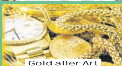
Gold aller Art