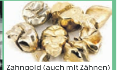
Zahngold (auch mit Zähnen)