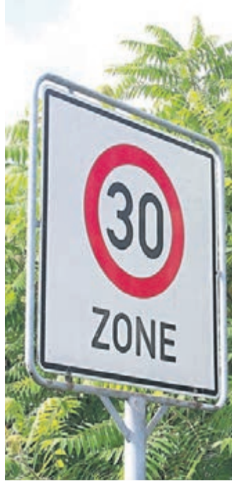
In Bensheim werden neue Tempo-30-Zonen eingerichtet (Symbolbild).

In der Friedhofstraße werde aufgrund der drei dort liegenden Fußgängerüberwege ebenfalls eine Geschwindigkeitsbeschränkung auf 30 Stundenkilometer angeordnet. „Besonders der Zebrastrifen direkt am Friedhofsausgang, der aus Richtung Zell/Gronau kommend erst sehr spät sichtbar ist, war hier das leitende Argument“, so die Stadt. Die Beschränkung komme laut den neuen Regelungen vor allem