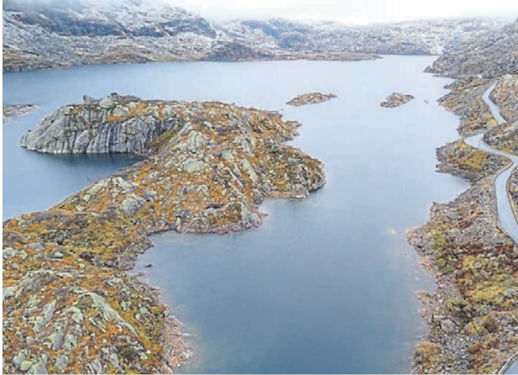
Impression von der Landschaftsrouten Ryfylke. Diese Landschaftsrouten ist zweigeteilt – zu sehen ist ein Abschnitt der Hochebene von Sauda.

hatten an diesem Abend Glück und fanden einen Stellplatz direkt auf einem kleinen Plateau am Lysefjord. Da es aufgehört hatte zu regnen, genossen wir die wunderschöne Aussicht vor unserem Bus und planten unseren nächsten Städtetrip nach Stavanger. Nach einem ausgiebigen Frühstück mit Blick auf den atemberaubenden Lysefjord ging es für uns am nächsten Tag Richtung Stavanger. Ein neu fertiggestellter Tunnel sollte uns dorthin bringen: 14 Kilometer lang sollte es unter dem Meer hindurch gehen. Auch in der kleinsten der drei besuchten Städte war es letztendlich kein Problem, einen Parkplatz