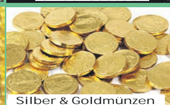
Silber & Goldmünzen