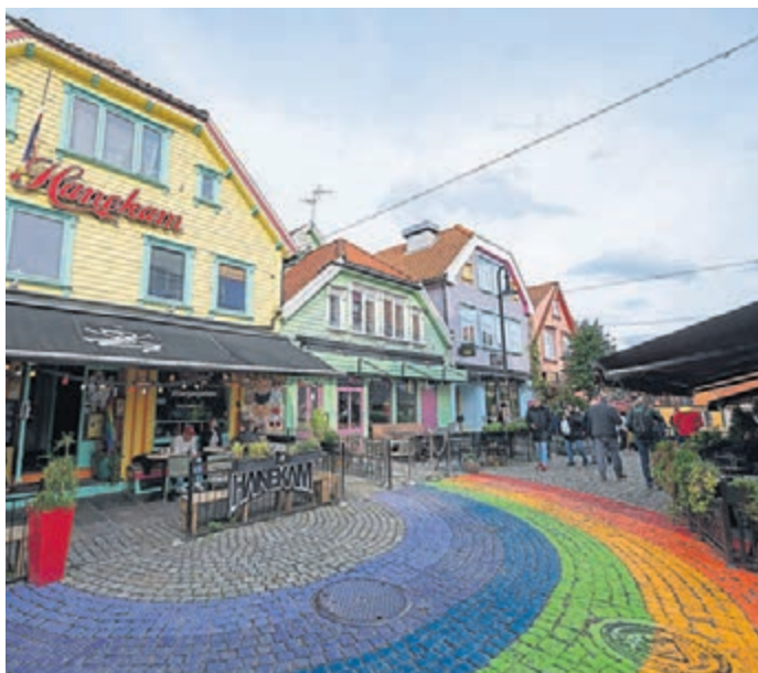
Links: Die Altstadt von Stavanger zeichnet sich durch einen Mix aus weißen und knallbunten Häusern aus. Rechts: Der Refnesstranda im Süden von Norwegen. Für Hartgesottene ist er auch im Oktober zum Baden geeignet.

Am Ende der Route besuchten wir noch das kleine Örtchen Mandal, bevor es für uns Richtung Oslo ging. Kurz vor Norwegens Hauptstadt fanden wir für unsere letzte Nacht einen schönen Stellplatz an einem kleinen See. Am nächsten Morgen ging es für uns dann Richtung Oslo und auf die Fähre Color Fantasia. Dieses Schiff ist mehr ein Kreuzfahrtschiff als eine Fähre und war der krönende Abschluss dieser aufregenden Reise. In den unzähligen Bars und Restaurants ließen wir unsere Seele baumeln und schwelgten bereits in Erinnerungen über diese fantastische Reise. Norwegen hat uns gefesselt, mitgenommen in andere Welten und uns die Schönheit unserer Natur mehr als nur einmal gezeigt. Eines steht für uns bereits jetzt fest: Das war nicht unsere letzte Reise mit dem Van durch Norwegen.