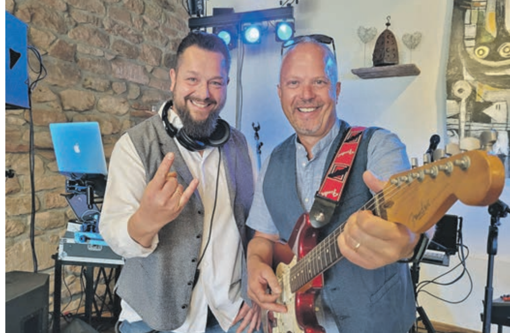
Bei der Gernsheimer Straßenfastnacht sind in diesem Jahr erstmals die „Bergstreetboys“ aus Hähnlein mit dabei und sorgen vom Stadthausbalkon aus für Stimmung.