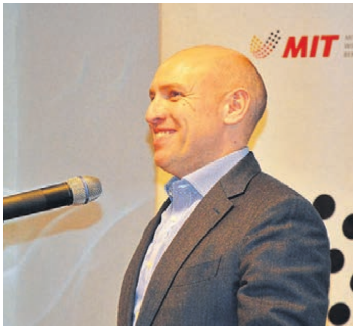
Manfred Pentz, hessischer Minister für Bundes- und Europaangelegenheiten, war beim Empfang der MIT Bergstraße prominenter Gast.

Zwingenberg (gp). Manfred Pentz, hessischer Minister für Bundes- und Europaangelegenheiten, Internationales und Entbürokratisierung sowie Sebastian Clever, Bürgermeisterkandidat der Stadt Zwingenberg waren am vergangenen Dienstag, 13. Februar, zu Gast beim Frühlingsempfang der Mittelstands- und Wirtschaftsunion Bergstraße (MIT) und des MIT-Bezirks Südhessen in Kooperation mit dem CDU Stadtverband Zwingenberg im Diefenbachsaal des Restaurant „Bunter Löwe“. Staatsminister Manfred Pentz trug sich während seines Aufenthalts im Goethezimmer des Hauses in das Goldene Buch der Stadt Zwingenberg ein.