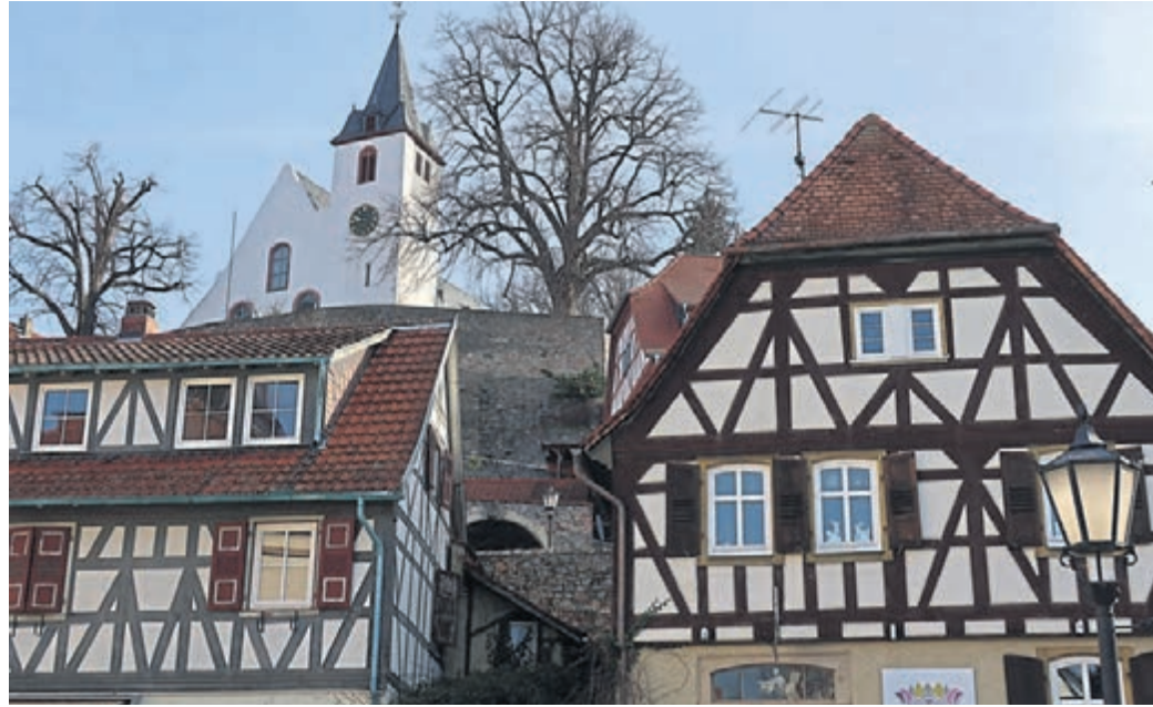
Die Bürger in Zwingenberg können am Sonntag nicht nur an der Bundestagswahl teilnehmen, sondern auch einen neuen Bürgermeister wählen.