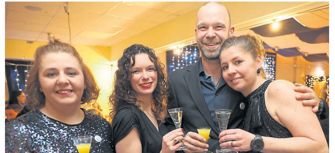
Ein Prosit auf das neue Jahr 2025: Das Empfangskomitee kredenzte allen Gästen ein Glas Sekt.