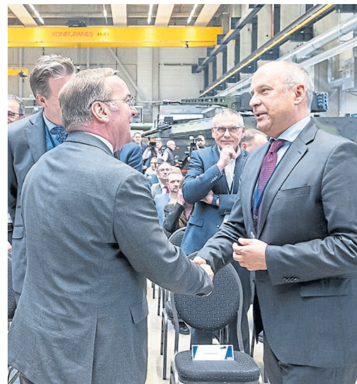
Verteidigungsminister Boris Pistorius (links) und der hessische Innenminister Roman Poseck bei der Feierstunde zur Übergabe der Radhaubitze RCH 155 an die Ukraine, die in den Fertigungshallen des deutsch-französischen Waffenherstellers KNDS in Kassel stattfand.

Beauftragung weiterer 36 RCH folgte 2023. Dies entspricht drei Artilleriebataillionen. Die Kosten für die Radhaubitzen werden von Deutschland im Rahmen der Ukraine-Hilfe übernommen, teilt das Unternehmen auf Anfrage der Redaktion mit. „Haubitzen haben grundsätzlich die Aufgabe den Gegner in der Distanz zu