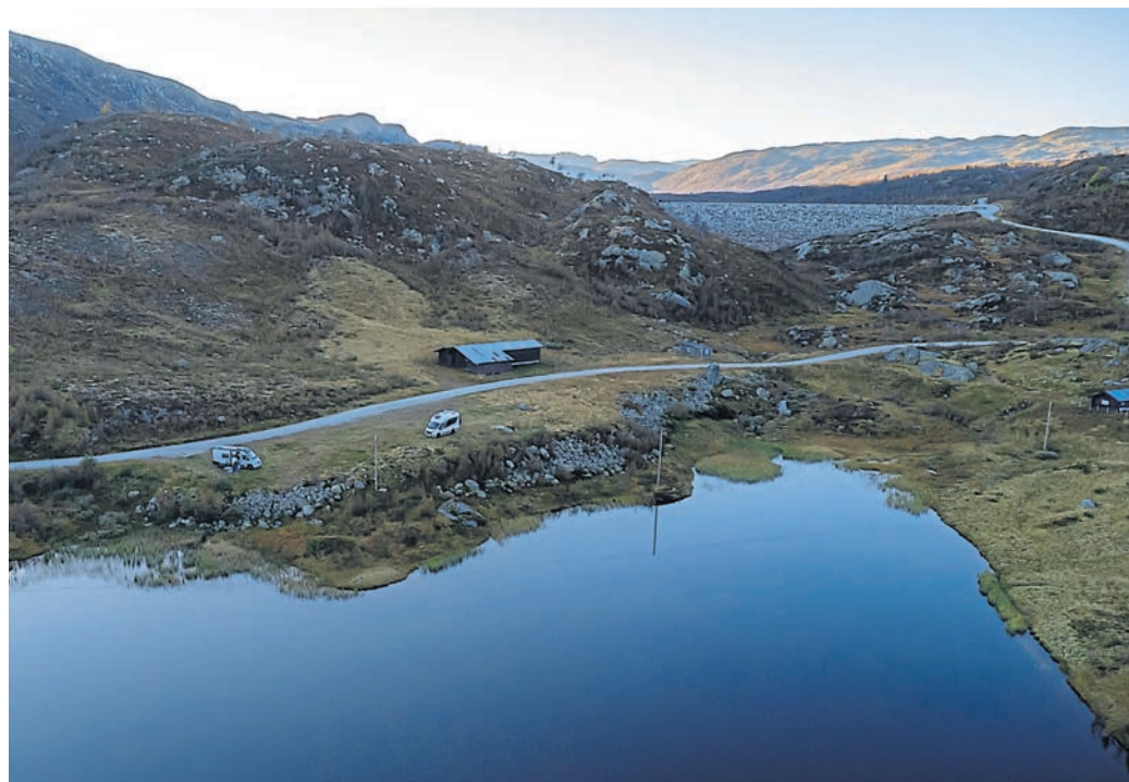
Ein traumhafter Stellplatz an einem ruhigen See kurz hinter Haukeli.

Wasser gelegen, sehr ruhig und unheimlich idyllisch.