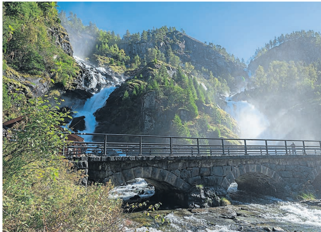
Der Låtefossen ist ein spektakulärer Wasserfall an dem unterhalb eine Straße verläuft.

Weiter auf der Route stand dann der Edlandsfossen auf unserem Plan. Dieser befindet sich ein wenig oberhalb an einer Nebenstraße und bahnt sich seinen Weg durch einen kleinen Wald. Nach dem Besuch des Edlandsfossen entschieden wir uns, die am Abend zuvor geplante Route über Bord zu werfen und einer Nebenstraße zu folgen, statt auf die E9 zurückzukehren. Entlang der Straße 450 entdeckten wir eine wunderschöne Hochebene, die bis an den imposanten Telemarkkanalen führte. Dort ging es für uns über etliche Serpentinafen bis nach Dahlen und weiter auf der E134 bis kurz hinter Haukeli. Als Schlafplatz hatten wir einen kleinen See ungefähr zwei Kilometer abseits der Straße ausgemacht. Wie der erste Stellplatz in Norwegen war auch dieser direkt am