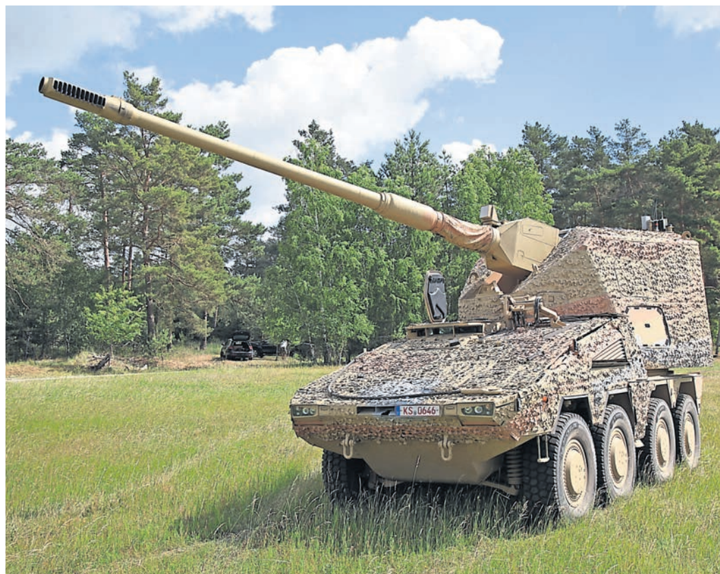
Insgesamt 54 Artillerie-Systeme vom Typ RCH 155 soll die Ukraine erhalten.

Hessen (ps). Bundesverteidigungsminister Boris Pistorius hat kürzlich im Rahmen einer Feierstunde in den Fertigungshallen des deutsch-französischen Rüstungsunternehmens KNDS in Kassel das neue Artilleriesystem RCH 155 an den ukrainischen Botschafter Oleksij Makejew überreicht. Wie das hessische Innenministerium mitteilt, steht RCH für „Remote Control Howitzer“, also für eine ferngesteuerte Haubitze. Die RCH-155-Systeme werden, von einzelnen Baugruppen abgesehen, in Kassel gefertigt. Bis zum Jahr 2027 sollen 18 Radhaubitzen produziert und an die Ukraine übergeben werden, erklärte Hessens Innenminister Roman Poseck in seinem Grußwort. Hessen spiele damit eine „entscheidende Rolle“ für die Sicherheit der Ukraine, die sich seit Februar 2022 gegen eine russische Invasion verteidigt. Die von der Bundesregierung eingeläutete „Zeitenwende“ werde in Hessen vorangetrieben. Insgesamt wird KNDS der Ukraine 54 Radhaubitzen RCH 155 liefern, die ersten sechs Systeme noch in diesem Jahr, erklärt das Bundesverteidigungsministerium. Der Vertrag über die Lieferung von 18 RCH 155 wurde bereits 2022 gezeichnet, die