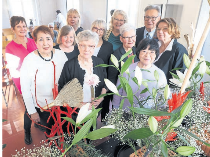
Die zahlreichen Präsentationen der Ikebana-Künstlerinnen und Künstler kamen beim Publikum gut an.