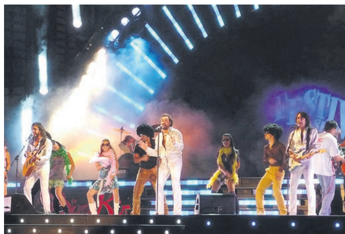
Bühnenimpression aus dem Musical „Massachusetts“ über die weltbekannte Band „Bee Gees“.

Bensheim (red). Das Musical „Massachusetts“ über die weltweit erfolgreiche Band „Bee Gees“ gastiert am Donnerstag, 20. März, um 20 Uhr in der Bensheimer Weststadthalle. Darin dreht sich laut Veranstalter alles um das Leben und musikalische Wirken der drei Gebrüder Gibb, die sich 1958 in Australien als Pop-Band „The Bee Gees“ gründeten und 1966 in ihre Heimat Großbritannien zurückkehrten. Es folgten viele Welthits, vor allem in den 1970er Jahren prägten die „Bee Gees“ die Disco-Ära und hatten etwa 1978 zeitgleich fünf Songs in den Top-Ten der US-Charts. Im Musical sollen alle großen Songs der drei Brüder zu hören sein, auch die frühen sowie die späten aus der Zeit des Albums „You Win Again“ Ende der 1980er Jahre. Im musikalischen Teil des Abends sind „The Italian Bee Gees“ zu hören, eben-