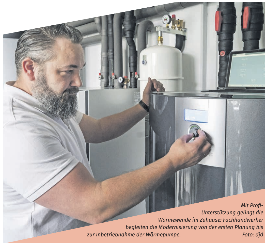
Mit Profi-Unterstützung gelingt die Wärmewende im Zuhause: Fachhandwerker begleiten die Modernisierung von der ersten Planung bis zur Inbetriebnahme der Wärmepumpe.

Jetzt bewilligte Förderanträge haben auch nach der Bildung einer neuen Bundesregierung im Frühjahr oder Spätsommer in jedem Fall Bestand. Weitere Infos: waermepumpe.de