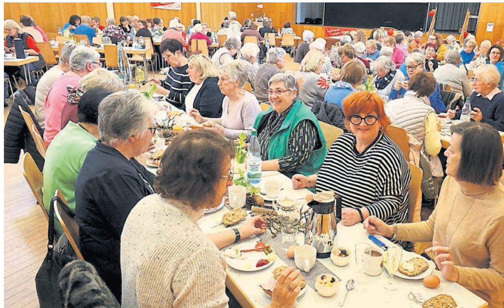
Alle Riedstädter Landfrauen hatten sich erstmal zu einem gemeinsamen Neujahrsempfang im Bürgerhaus in Wolfskehlen eingefunden.