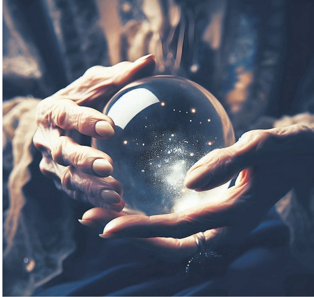
Für Zukunftsprognosen hat die Glaskugel längst ausgedient und ist mehr ein Jahrmarktgimmick als präzises Instrument. Dank neuer Künstlicher Intelligenzen, von denen die Redaktion auf verschlungenen Wegen an eines der besten Modelle geraten ist, lässt sich heute wesentlich mehr Präzision erwarten.

Pfungstadt. Politischer Paukenschlag in Pfungstadt. Nachdem bei der Bundestagswahl im Februar die FDP mit kläglichem drei Prozent Wählerstimmen aus dem Plenum geflogen ist, überrascht deren – weiterhin an seinem Stuhl klebende – Bundesvorsitzende Christian Lindner alle mit seiner Kandidatur auf das Bürgermeisteramt der Mühlenmetropole. Zuvor war er in den Sozialen Netzwerken mit dem Tarnaccount „911Samsbar“ unterwegs gewesen und hatte umständlich die Präsentation des Polithammers in die Wege geleitet. Aus einigen internen Sitzungen seiner Wahlkampfmannschaft war die Botschaft jedoch fix herausgesickert und so früh keine vertrauliche Botschaft mehr. Was der „Würger aus Wermelskirchen“, bezogen auf seinen strikten Sparkurs, genau mit der Bewerbung