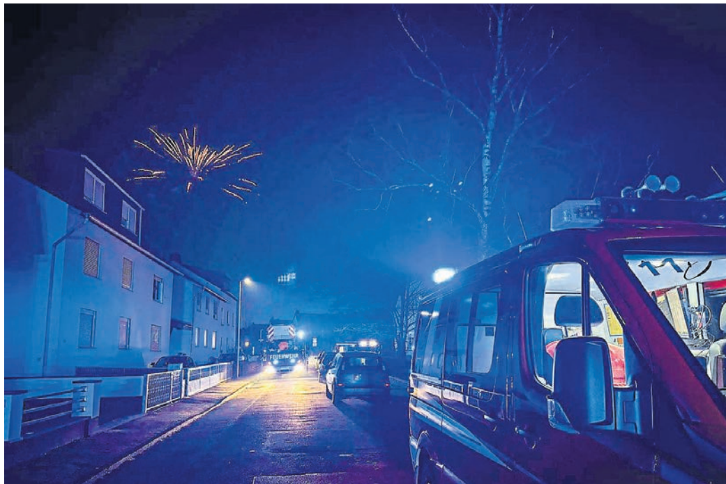
34 Mal mussten die Einsatzkräfte der Feuerwehren im Kreis Darmstadt-Dieburg ausrücken. Das Bild stammt aus Weiterstadt.

Region (red/ps). In den letzten Stunden des Jahres 2024 und den frühen Morgenstunden des Neujahrstags verzeichneten die Feuerwehren und der Rettungsdienst im Kreis Darmstadt-Dieburg ein höheres Einsatzaufkommen. „Zwischen dem 31. Dezember, 18 Uhr, und dem 1. Januar, 8 Uhr, bearbeitete die Zentrale Leitstelle für die nichtpolizeiliche Gefahrenabwehr in Dieburg insgesamt 183 Hilfeersuchen aus der Bevölkerung“, berichtet der Kreis Darmstadt-Dieburg in einer Mitteilung an die Presse. Die ehrenamtlichen Einsatzkräfte der Feuerwehren im Landkreis wurden zu 34 Einsätzen alarmiert, darunter sieben Einsatzstellen im Stadtgebiet Babenhausen. Hauptsächlich handelte es sich um Brandeinsätze bei Kleinbränden wie Containerbränden sowie um unklare Feuermeldungen in oder an Wohngebäuden. „Glücklicherweise blieben Personenschäden aus“, so der Kreis. Die Feuerwehren aus den Gemeinden Alsbach-Hähnlein, Babenhausen, Bickenbach, Dieburg, Erzhausen, Griesheim, Groß-Umstadt, Groß-Zimmern, Mühlthal, Ober-Ramstadt, Pfungstadt, Reinheim, Roß-