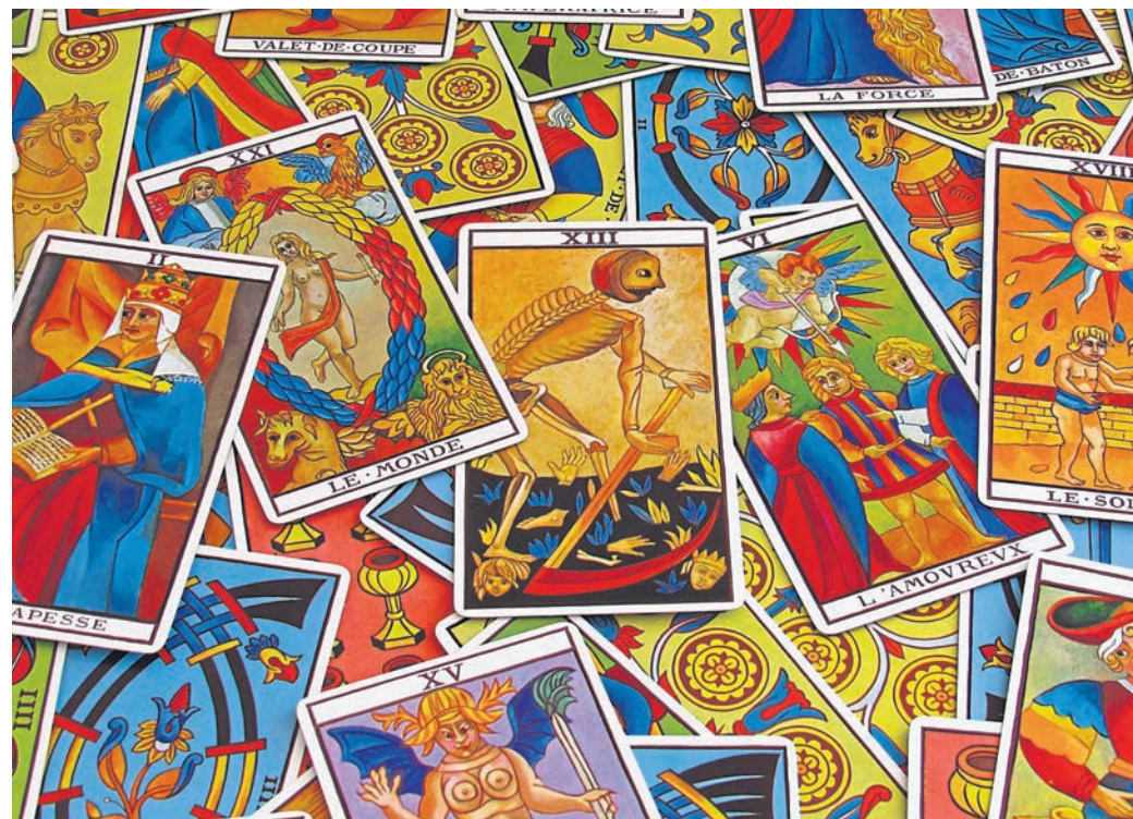
Tarotkarten? Das war einmal und ist längst nur noch Nostalgie. Echte Profis wissen die Zukunft digital zu lesen und vertrauen auf die Schlaueheit der Computerwelt.

Weiterstadt. Kurz nachdem die Pläne für den neuen Flugzeug-E-Highway bekannt geworden sind, präsentieren die Stadt Weiterstadt und die Loop-5-Verantwortlichen in einer Pressekonferenz ihre Pläne für das Loop-5-Parkhaus, das für das neue Kohlekraftwerk weichen muss. Da ein Abriss zu teuer wäre, hat man sich etwas anderes einfallen lassen: Das Parkhaus wird eine Kulisse für den neuesten Teil der Street-Racing-Filmreihe „Fast & Furious“ und im Zuge der Dreharbeiten bei einem spektakulären Stunt gesprengt, wofür Hollywood die Kosten übernimmt. Der Streifen soll den Namen „Fast & Furious Ultimate Explosion: Höher, Schneller, Weiter(stadt)“ tragen und Ende des Jahres weltweit in die Kinos kommen. Auf der Pressekonferenz sind auch Star-Schauspieler Vin Diesel, der wieder die Hauptrolle verkörpern soll, und der erfahrene Katastrophenfilm-Regisseur Roland Emmerich anwesend, die einen ersten Einblick ins Drehbuch geben. So soll Vin Diesel mit einem Auto in einer actionreichen Verfolgungsjagd zunächst über alle Ebenen des Parkhauses nach oben driften, ehe er dann vom Dach über eine Rampe durch einen brennenden Reifen springt und in der geöffneten Ladefläche eines vorbeifliegenden Flugzeugs landet, wodurch er seinen Verfolger entkommt. Anschließend dockt das