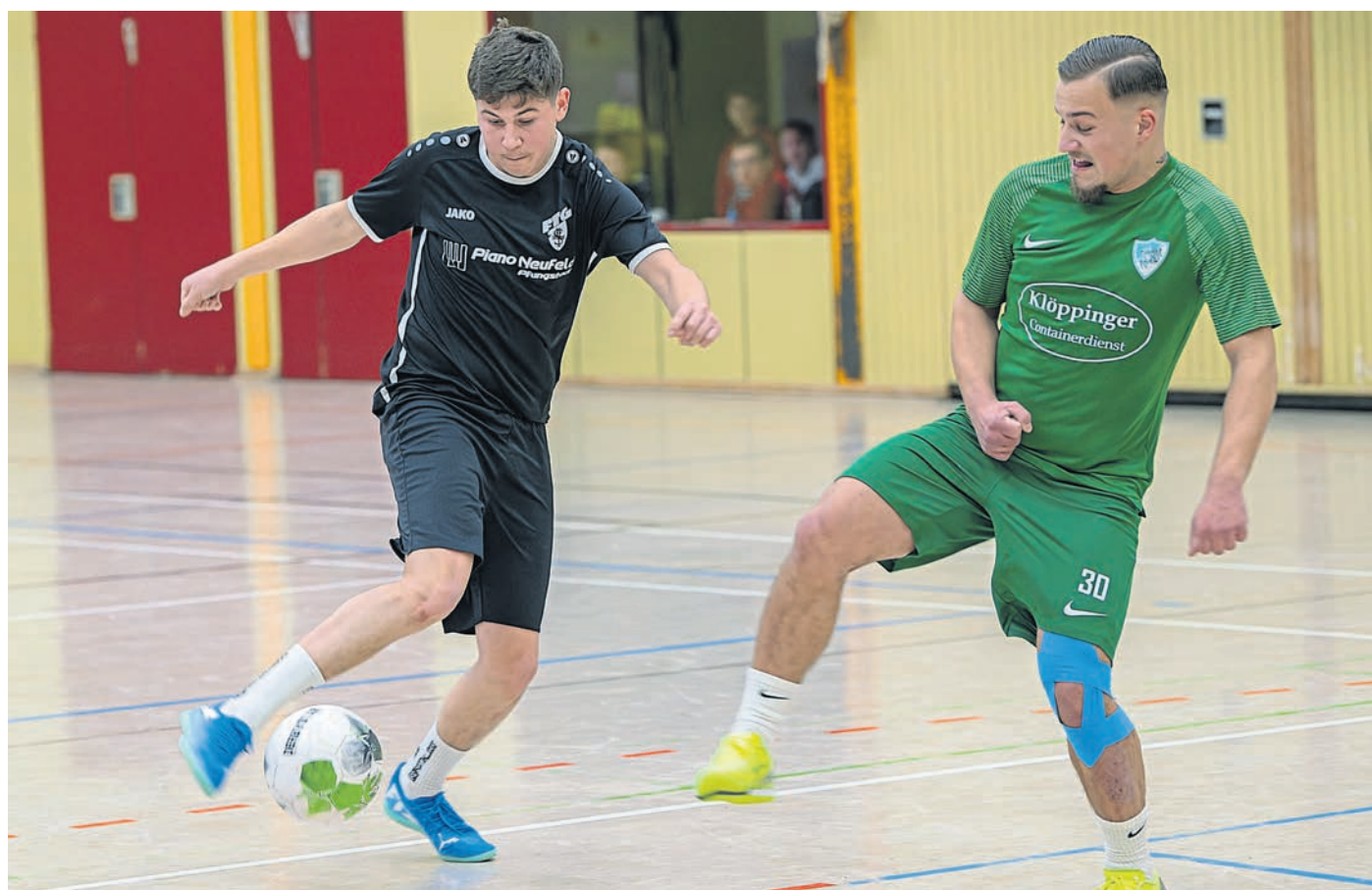
Pfungstadt (sh). Am letzten Wochenende im vergangenen Jahr fanden in der Pfungstädter Großsporthalle die Pfungstädter Stadtmeisterschaften im Hallenfußball statt. Ausrichter war in diesem Jahr der TSV Eschollbrücken. Gespielt wurde mit vier Feldspielern und einem Torhüter in zwei Gruppen. Am Ende setzten sich die Kicker vom SV Hahn (grüne Trikots) mit sieben Punkten und 24:5 Toren durch und krönten sich zum Stadtmeister.

SV Hahn holt sich den Titel bei Stadtmeisterschaften im Hallenfußball