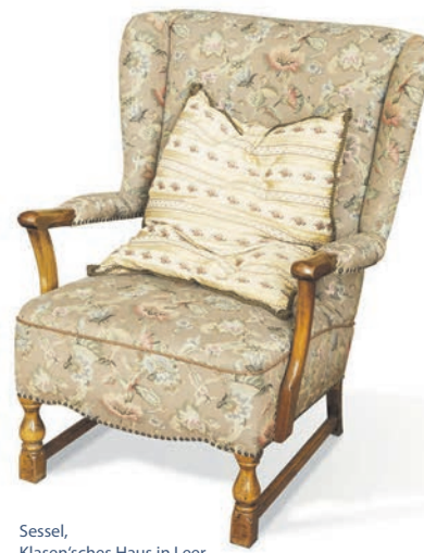
Sessel, Klassisches Haus in Leer Das Haus ist eines von über 5.500 geförderten Denkmälern.

DEUTSCHE STIFTUNG DENKMALSCHUTZ Wir bauen auf Kultur.