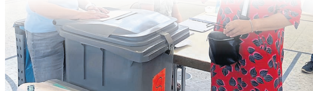
Am 23. Februar findet die vorgezogene Bundestagswahl statt. Alle wahlberechtigten Griesheimer sind aufgerufen, ihre Stimme abzugeben. Wie viele das sind, wo gewählt wird und wohin aufgrund durch Fastnachtsveranstaltungen belegte Hallen ausgewichen wird, lesen Sie hier.

Wahlberechtigte in Griesheim In Griesheim sind nach aktuellem Stand 17 707 Einwohner wahlberechtigt. Sie teilen sich in folgende Altersgruppen auf. 18 bis 24 Jahre: 1571 Personen. 25 bis 34 Jahre: 2439 Personen. 35 bis 44 Jahre: 2768 Personen. 45 bis 59 Jahre: 4453 Personen. 60 bis 69 Jahre: 3131 Personen. 70 Jahre und älter: 3348 Personen. Ein Blick auf die Altersstruktur aller Wahlberechtigten in Deutschland zeigt, dass von allen 59,2 Millionen