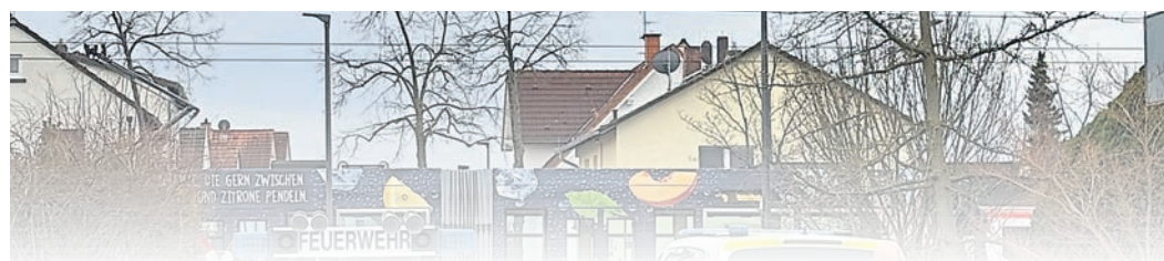
Neben der Polizei und den Notärzten war auch die Griesheimer Feuerwehr im Einsatz. Sie stellten einen Sichtschutz und säuberten im Nachgang die Wege. feuerwehr-foto