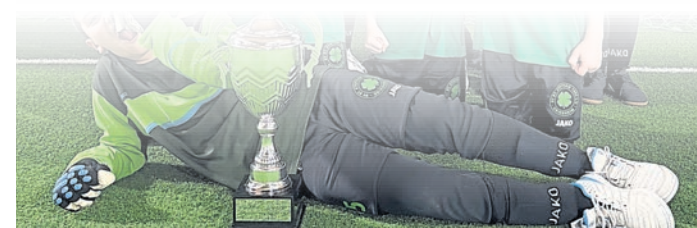
Die E-Junioren gewannen am vergangenen Wochenende das Turnier in Arheilgen.

es wurde im Format Jeder gegen Jeden gespielt. Die Gegner waren zum Großteil ein Jahr älter, was der Spielfreude der Jungs aber keinen Abbruch tat.