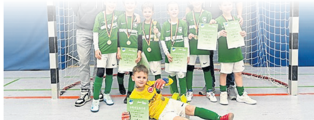
Den zweiten Turniersieg holte sich die E-Jugend des SVS beim Turnier der KSG Georgenhausen. Die jungen Kleebblätter entschieden alle fünf Spiele für sich.

Die Ergebnisse: Doppel: Pätsch/Varona (1); Einzel: G.