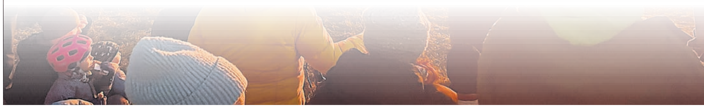
Vor allem für die jüngsten Besucher des Christbaumverbrennens der Griesheimer Feuerwehr war der Anblick der brennenden Tannenbäume ein tolles Erlebnis, aber auch die Erwachsenen genossen das Beisammensein und die Wärme des Feuers.

www.plegge-medien.de/service/abonnentenservice