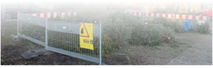
Noch bis Freitag können die alten, abgeschmückten Weihnachtsbäume an den Ablagestellen abgelegt werden.

nuar. Zusätzlich besteht die Möglichkeit, die Weihnachtsbäume kostenfrei an der Wertstoffsammelstelle des städtischen Bauhofs abzugeben. Die ausgedienten Tannen können bis Freitag an folgenden Stellen abgelegt werden: Parkplatz an der Lutherkirche, An der Frie-