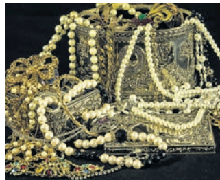
Alter Schmuck lässt sich jetzt ganz einfach zu Geld machen.

fall als Oliven- oder Kugelform, kann man schon mit mehreren hundert Euro rechnen. Ebenfalls hoch im Kurs stehen Luxusuhren der Marken „Rolex“, „Breitling“, „Omega“ und Co. Besonders interessant sind alte Vintage-Uhren aus den 60er- und 70er-Jahren, welche ihre Preise in den letzten Jahren um ein Vielfaches steigern konnten. Hier lohnt es sich durchaus, die alten „Wecker“ aus dem Tresor zu holen und diese den Experten vorzulegen. Laut Experten kann z. B. eine Rolex GMT Master aus den 70er-Jahren bis zu 9 000 Euro erzielen. Des Weiteren bieten die Experten von „Bares für Wa(h)res“ kostenlose Wertschätzungen von Diamanten an. Besonders interessant sind Diamanten im Brillant-Schliff ab einer Größe von 0.50 Carat. Hier gilt die Faustregel: Ein einzelner Diamant ist wertvoller als viele