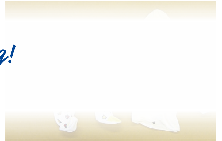
Im Rahmen der Zeugensuche veröffentlicht die Polizei diese Kleidung und hofft auf Informationen aus der Bevölkerung.

Ein Cold Case (ungelöster Kriminalfall) aus dem Jahr