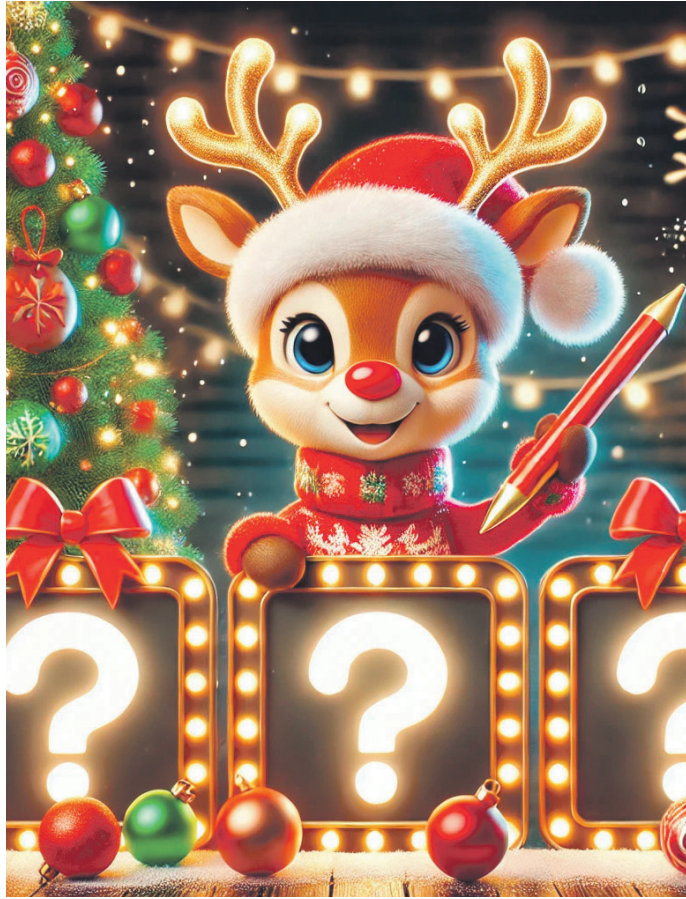
Mit der Fortgeschrittenenvariante können Sie zeigen, dass Sie ein wahrer Weihnachtsexperte sind. Foto: Dall-E

5. In welchem europäischen Land wird Weihnachten traditionell mit dem Julbock (Weihnachtsbock) gefeiert?