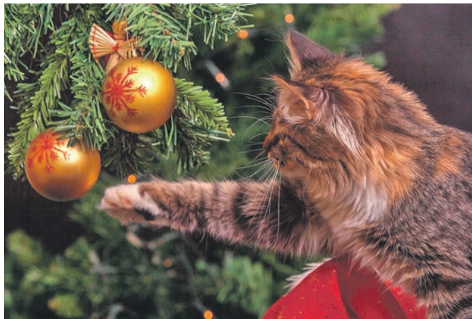
Ein Rückzugsort gibt Katzen die Möglichkeit, bei aufregenden Situationen besser zu entspannen.

man die Verdampfer am besten schon ein bis zwei Wochen vor Silvester am Rückzugsort des Tieres. Beim Spaziergang mit einem Hund empfiehlt es sich, diesen mit einem Geschirr zu sichern, um ein Entweichen aus dem Halsband zu vermeiden. Freigängerkatzen sollten bereits eine Woche vor Silvester bis eine Woche danach im Haus bleiben. Fenster, Katzenklappen und Türen müssen in dieser Zeit geschlossen sein. Das Aufstellen des Weihnachtsbaums, Besucher sowie kaltes Wetter und die damit verbundene vermehrte Zeit im Haus, sorgen ebenfalls für Unbehagen, vor allem bei Katzen. Hier hilft es kuschelige Rückzugsorte, beispielsweise in einem um-