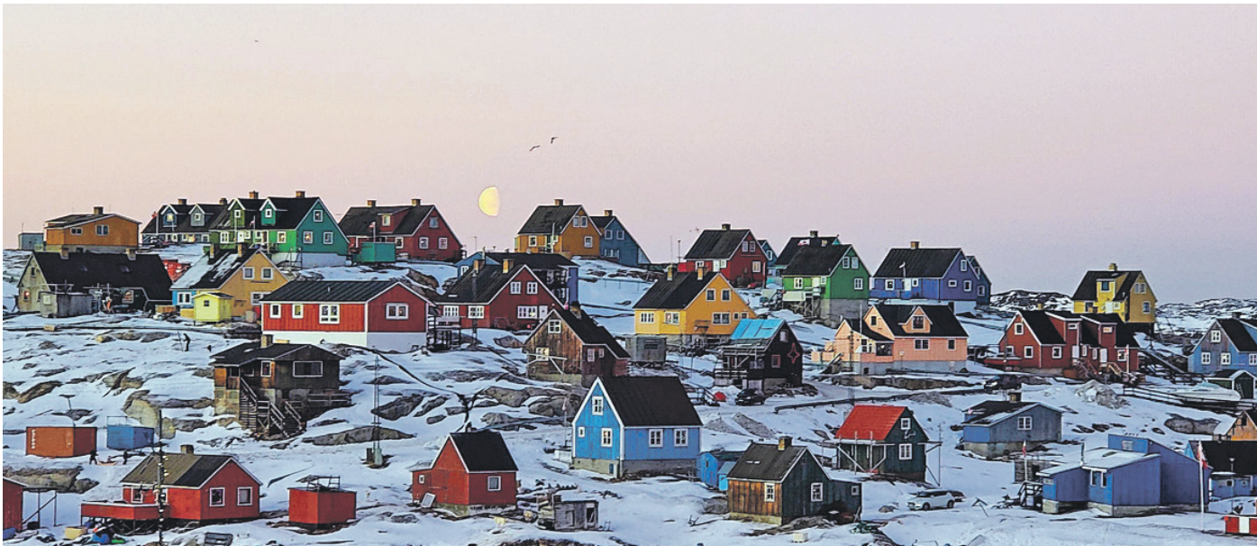
In Grönland kommen an Weihnachten zumindest für Mitteleuropäer skurril anmutende Gerichte auf die Festtafel, darunter fermentierte Vögel.

Ein Einblick in die ungewöhnlichsten Weihnachtsarten