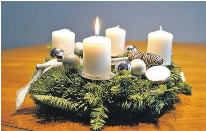
Echtes Immergrün: Ein Adventskranz gehört in vielen deutschen Haushalten zur weihnachtlichen Grundausstattung.

Auf einem Hektar Tannenkultur produzieren Baumschulen sowie Land- und Forstbetriebe jährlich rund vier Tonnen Dekorationsgrün. Für das Binden der Adventskränze verwendet man traditionell die Zweige der Nobilistanne. „Die Nadeln verlieren die intensive blaugrüne Farbe ein wenig und werden grau, aber die Nobilis nadeln nicht, das ist ihr großer Vorteil. Außerdem ist sie die haltbarste aller Tannen“, sagt Eberhard Henneke, erster Vorsitzender des Bundesverbandes der Weihnachtsbaum- und Schnittgrünerzeuger in Deutschland. Ein Adventskranz übersteht die Adventszeit gut, wenn er nicht in Heizungsnahe aufgestellt wird.