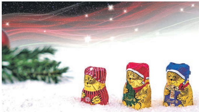
Der hell erschienene Stern, den die drei Weisen sahen, bewegte sie dazu, ihm zu folgen.

nen einen richtigen Rat geben. Herodes ist ein doppelt falscher König. Nicht der, den die Weisen suchen. Zudem spielt er ein falsches Spiel. Er gibt ihnen den Hinweis auf Bethlehem und macht sie zu unfreiwilligen Informanten. Sie sollen ihm berichten, wo er den neugeborenen König finden kann. Sein Plan: das Kind ermorden, ehe es seinem Thron gefährlich wird. Die Bibel beschreibt die Wirklichkeit so grausam, wie sie sein kann. Herodes denkt. Doch Gott lenkt die Geschichte. Sobald die Magier Jerusalem verlassen haben, leuchtet der Stern wieder auf und geht ihnen voran nach Bethlehem. Sie finden keinen Palast und keinen Prinzen. Sie sehen ein Kind in einem Futtertrog. Die weit gereisten Anatolier (so heißt Morgenland auf Griechisch) könnten sich vom Himmel hoch genommen fühlen: Das soll der neu geborene König sein? So viel Aufwand im Universum für diese bescheidene Szene?