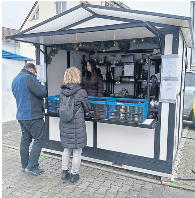
Pfungstadt (red). Der Karnevalverein Pfungstadt (KVP) war am vergangenen Wochenende mit einer Losbude (Foto) sowie einem Glühweinstand auf dem Pfungstädter Weihnachtsmarkt vertreten. Viele Menschen habe die Tombola, bei der die Nielen Trostpreise waren, wie der KVP berichtet, an den Stand gelockt. Zu gewinnen gab es Gutscheine wie auch Sachpreise und die Fastnachtstreibenden danken den örtlichen Geschäften, die als Sponsoren der Tombola auftraten.