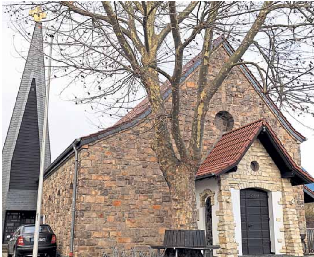
In der Pfarrgemeinde Sankt Bonifatius in Goddelau hat sich vor 45 Jahren ein Missbrauchsfall ereignet, der in der Gemeinde erst kürzlich bekannt wurde.