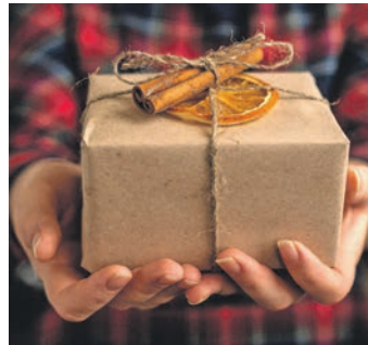
Wer anderen ein Geschenk macht, empfindet dabei auch selbst Glück.

Weihnachten (red). Schenken und beschenkt werden gehört für die meisten Menschen zur Weihnachtszeit fest dazu. Die Bescherung unter dem Weihnachtsbaum ist für sie eine feste Tradition, auf die sie auf keinen Fall verzichten möchten. Der Soziologe Friedrich Rost von der Freien Universität Berlin hat diesen „Gabentransfer“ wissenschaftlich beleuchtet. Er ist überzeugt davon, dass dieser bis weit in die Stammesgeschichte zurückreicht. „Wer schenkt, will binden“, sagt er. „Durch das gegenseitige Schenken werden Beziehungen gefestigt.“ Das unterstreicht auch der Philosoph Wilhelm Schmid. Er hat sogar ein Buch zum Thema geschrieben. Darin geht es unter anderem um Freude- und Freiheitsgeschenke, Verlegenheits- und Notgeschenke. Sie alle sagen etwas über das Verhältnis zwischen Schenkendem und Beschenktem aus. „Die Kunst des Schenkens ist eine von vielen Künsten, die das Leben schöner und reicher machen“, so Schmid. „Schenken macht die Seele weit, und Geiz macht sie eng. Deswe-