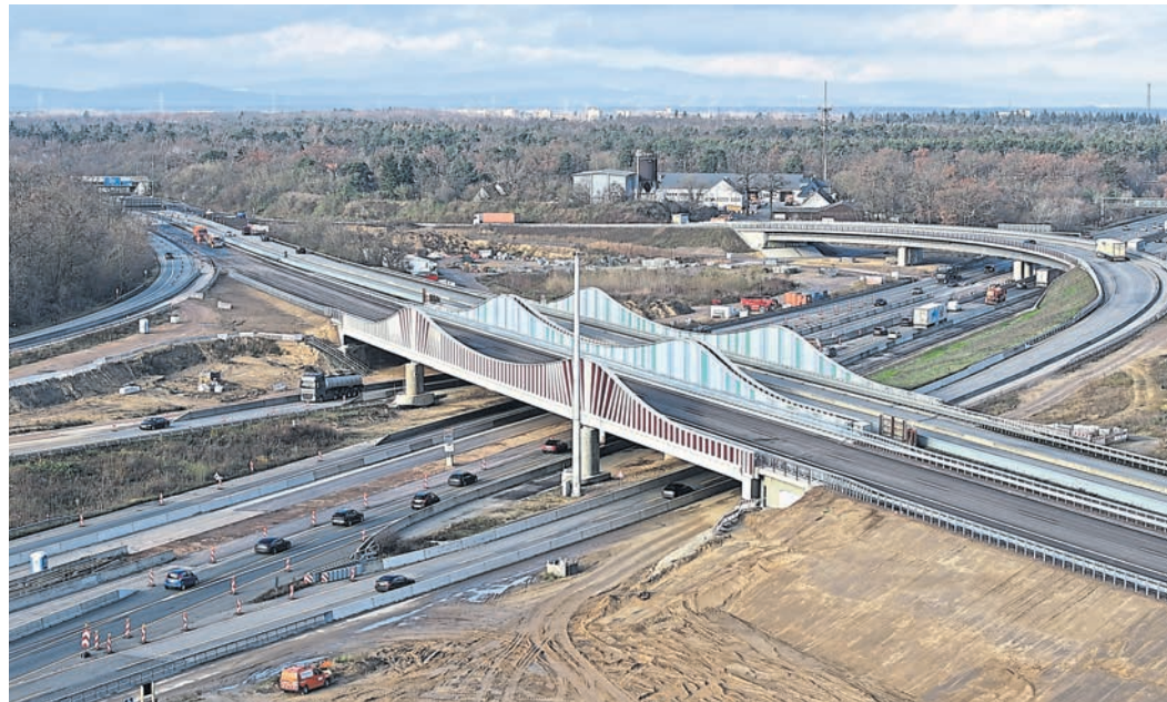
Der südliche Teil des neuen Zentralbauwerks am Darmstädter Kreuz (rote Akzente) wurde kürzlich auch für den Verkehr freigegeben.

Als wellenförmige Trogbücke geplant und realisiert, stabilisieren bis zu sieben Meter hohe Seitenwände mit oberliegendem Tragwerk die Konstruktion, heißt es wörtlich in der Pressemitteilung der Darmstädter Außenstelle der Bundesgesellschaft. Bis Ende 2025 soll das gesamte Darmstädter Kreuz erneuert sein, inklusive der noch ausstehenden Südrampe.