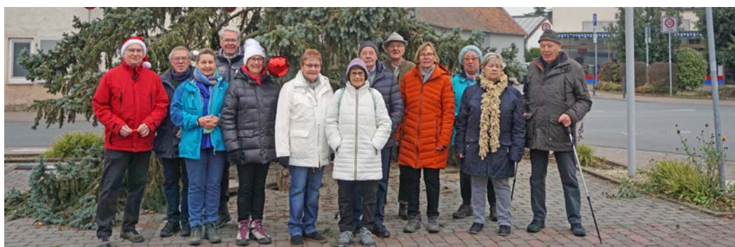
13 Wanderinnen und Wanderer trauten sich auf die Strecke.