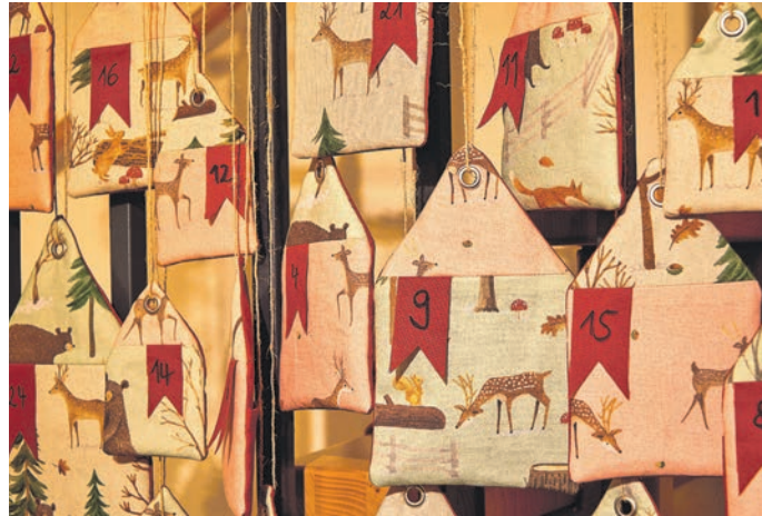
Auch der Adventskalender ist bei vielen Menschen in Deutschland ein fester Bestandteil in der Vorweihnachtszeit.

Weihnachten (red). Was für die einen eine Zeit voller Stress und Hektik ist, bedeutet für die anderen die besinnlichste Zeit des Jahres. Das Wort Advent selbst stammt vom lateinischen „adventus“ ab und bedeutet übersetzt „Ankunft“. Die Ankunft von Jesus Christus. Die Adventszeit, wie wir sie kennen, entstand im siebten Jahrhundert. Damals wurde die Anzahl der Sonntage von Papst Gregor von sechs auf vier reduziert. Diese vier Sonntage sollten die vier Jahrtausende versinnbildlichen, die die Menschen nach dem Sündenfall auf ihren Erlöser warten mussten. Als krönender Abschluss dieser Zeit steht das Weihnachtsfest. Jeder der Adventssonntage an sich hat zudem einen speziellen Bezug. So bezieht sich der erste Sonntag auf die Wiederkunft Jesu, der zweite wie auch der dritte auf Johannes den Täufer und schließlich bezieht sich der vierte Sonntag auf Maria. Die Tage vor dem Advent sind von Vorfreude geprägt – aber auch von Arbeit und Vorbereitungen, will doch das Haus geschmückt werden, um die