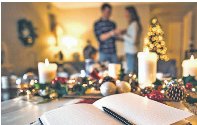
Eine To-do-Liste hilft, den Überblick zu behalten und reduziert Stress in der Vorweihnachtszeit.

Weihnachten (red). Weihnachten bringt oft eine Mischung aus Vorfreude und Stress mit sich. Geschenke besorgen, die Wohnung schmücken und das Festtagsessen planen – all das kann schnell überwältigen. Eine gute Planung kann jedoch helfen, Stress zu vermeiden und die Weihnachtszeit entspannt zu genießen. Hier sind sechs praktische Tipps: