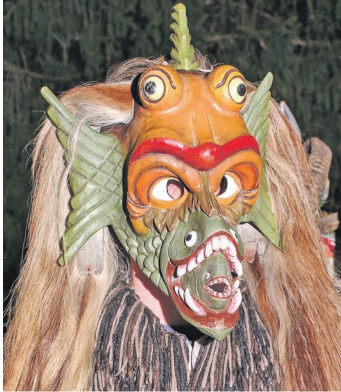
Die Zeit um die Wintersonnenwende, zu der die „Rauhächte“ gehören, ist mit vielerlei Traditionen und Brauchtum verbunden. Besonders farbenfrohe Spektakel sind die Perchtenläufe (Foto) im süddeutschen und alpinen Raum, aber auch aus Südhessen sind für diese Zeit viele altergebrachte Bräuche bekannt.

den Rauhächten verbunden ist. Dabei wird flüssiges Blei in kaltes Wasser gegossen, wo es sofort zu bizarren Formen erstarrt. Aus Form und Schattenwurf der Bleigebilde lassen sich nach Überlieferung Vorhersagen über die Zukunft des Bleigießers treffen. Auch aus Kaffeesatz haben die Menschen versucht, in jener Zeit die Zukunft zu deuten.