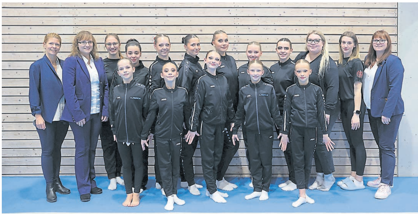
Das Team der FTG Pfungstadt holte Platz Fünf in der Teamwertung beim Norbert-Müllmann-Hessenpokal.