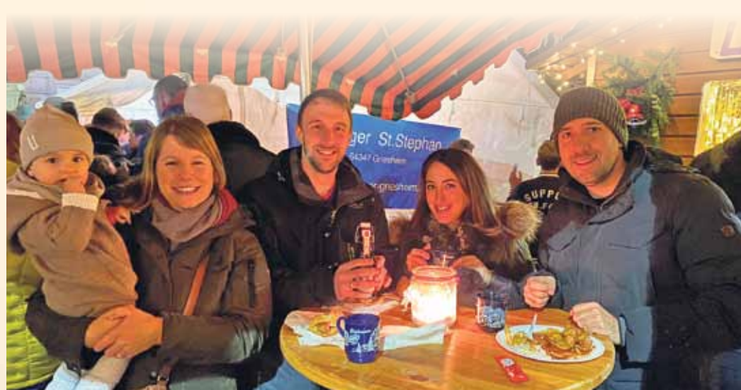
Hier kann man es sich gut gehen lassen. Wer Glück hat, ergattert sich einen Stehtisch und genießt im Kreise seiner Freunde die leckeren kulinarischen Köstlichkeiten der Vereine. Kleine Preise sorgen seit vielen Jahren dafür, dass jeder auch an mehreren Ständen zuschlagen kann.

Am Sonntag (8. Dezember) wird an verschiedenen Ständen ab 12 Uhr Mittagessen angeboten. In der Zeit von 16 bis 18 Uhr kommt der Nikolaus und verteilt Schokoladenweihnachtsmänner an die Kinder. km