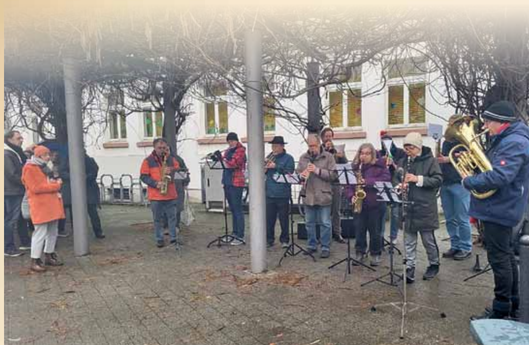
Die Musiker des Blasmusikvereins spielen auch in diesem Jahr am Heiligen Abend an verschiedenen Stationen im Stadtgebiet. Die Endstation in der Groß-Gerauer Straße war im vergangenen Jahr gut besucht und den Musikern wurde mit reichlich Applaus gedankt.

Weihnachtsblasen des Blasmusikvereins stimmt auf Heiligen Abend ein