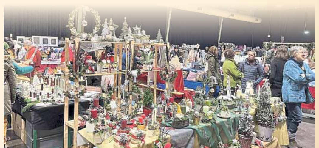
Wer auf der Suche nach weihnachtlichen Dekorationsartikeln war, wurde beim Weihnachtsmarkt in der Wagenhalle fündig.