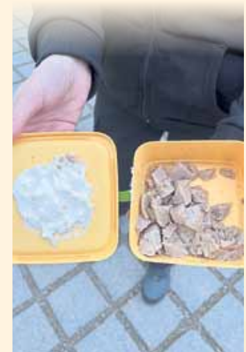
Nassfutter mit Schmierkäse als Belohnung.