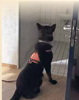
Schäferhund Jack setzte sich vor das Bad im Untergeschoss des Hauses und zeigte somit an, dass sich die Person hier befindet.

Zwei Mal pro Woche trainieren die Hundeführer gemeinsam mit ihrem Hund für den Ernstfall. Dabei wird das Training immer mit einem positiven Ausgang beendet. „Eigentlich ist jeder Hund als Rettungshund geeignet. Nur Hunde mit einer kurzen Atmung sind eher nicht geeignet, da die Hunde während eines Einsatzes Hochleistung betreiben und das Schnüffeln von großer Bedeutung ist“, so die erfahrenen Hundeführer, die mit ihren Rettungshunden durchs Leben gehen. jpp