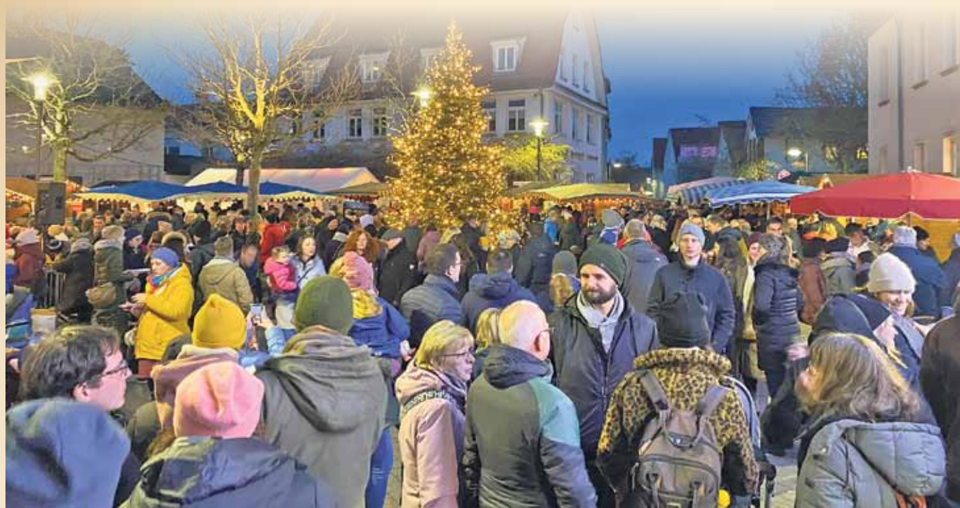
Die Vorfreude auf den Griesheimer Weihnachtsmarkt steigt. Am kommenden Wochenende liegt am Kreuz wieder der Duft von heißem Glühwein, gebrannten Mandeln und frisch gemachten Kartoffelpfannkuchen in der Luft.

Griesheimer Weihnachtsmarkt vom 6. bis 8. Dezember – Musikalisches Bühnenprogramm