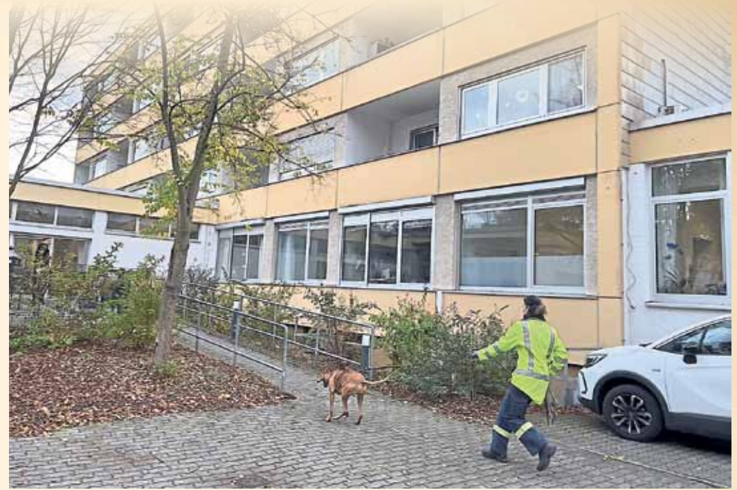
Hündin Julie und ihre Führerin Sandra Krämer gingen über den Hintereingang des Hauses Waldeck auf die Suche nach einer vermissten Person. Hierbei handelte es sich jedoch um ein Training und nicht um einen realen Einsatz.

Ungewohnte Umgebung: Rettungshunde im Haus Waldeck zu Gast