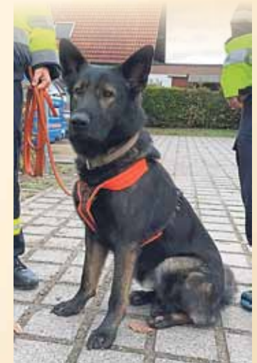
Jack trägt bereits sein Geschirr für den Einsatz.