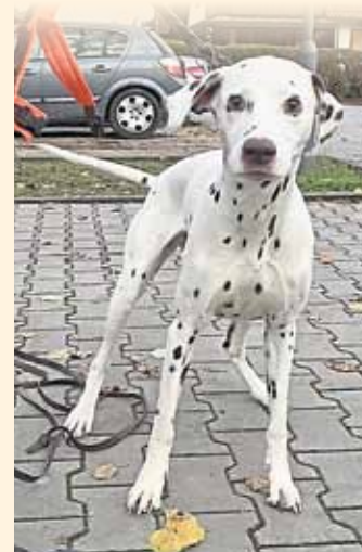
Hündin Amra wartet gespannt auf ihren Trainingseinsatz.

Allen unseren Kunden wünschen wir ein frohes Weihnachtsfest und ein gutes neues Jahr verbunden mit dem Dank für die vertrauensvolle Zusammenarbeit.