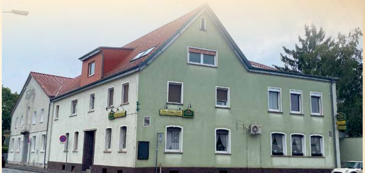
Wenn heute vom „Zöllerhannes“ gesprochen wird, dann ist damit das Gasthaus „Zum Grünen Laub“ an der Ecke Oberndorfer Straße/Schaaßgasse gemeint, das in diesem Jahr auf sein 300-jähriges Bestehen zurückblicken kann und in der Griesheimer Geschichte eine besondere Rolle spielt.

Gaststätte „Zum Grünen Laub“ hat in der Griesheimer Geschichte eine besondere Rolle gespielt