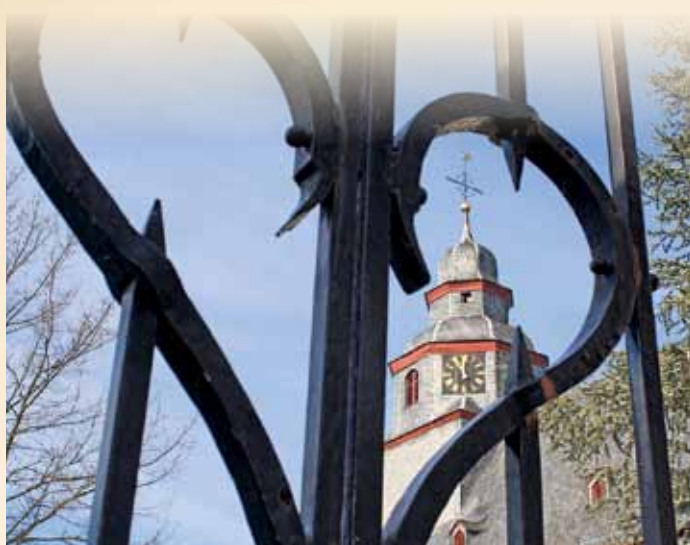
Die Griesheimer Kirchengemeinden laden an Heiligabend und den Weihnachtsfeiertagen wieder zu Gottesdiensten mit Krippenspielen und musikalischer Begleitung ein.