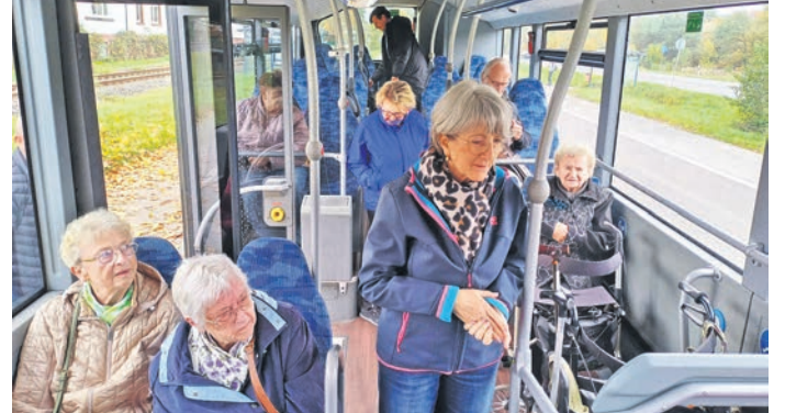
In einem zweitägigen Seminar konnten unlängst Seniorinnen und Senioren aus Bensheim das Fahren mit Bus und Bahn üben.

Im Besprechungsraum des städtischen Teams Familie, Jugend, Senioren und Vereine am Berliner Ring erhielten die Teilnehmenden Tipps, etwa für eine gute Reiseplanung und ein entspanntes Ankommen. Darüber hinaus stand eine Trainingsfahrt auf dem Programm. „Dies war vor allem für Personen mit Rollator aufschlussreich, denn sie konnten beim Einstieg die ausklappbare Rampe testen und an einer barrierefreien Haltestelle den