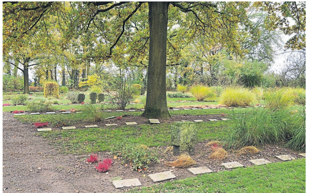
An der Kriegsgräberstätte in Auerbach fand die zentrale Kundgebung zum Gedanken an die Gefallenen und Verstorbenen statt.

Zentrale Gedenkveranstaltung mit Kranzniederlegung