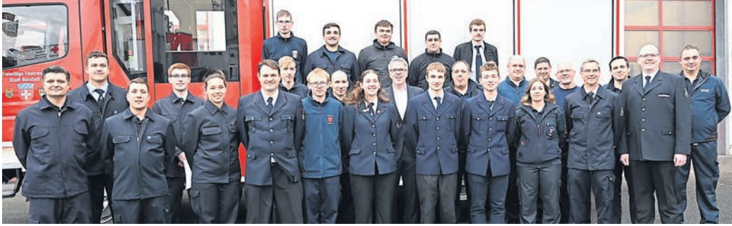
17 junge Brandschützerinnen und Brandschützer haben unlängst in Bürstadt erfolgreich ihren Atemschutzlehrgang absolviert.