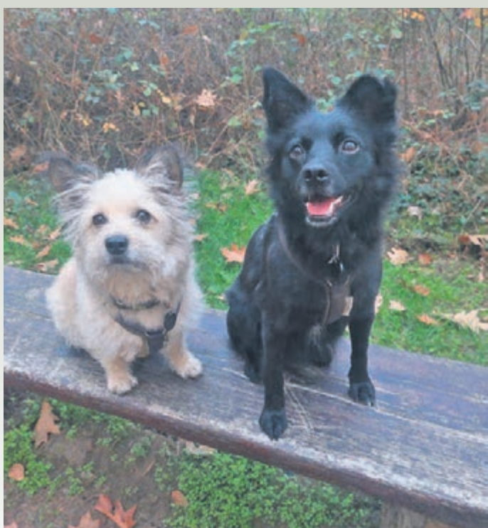
So schön die warmen Herbst- und Wintertage sind, für Tiere und Menschen bedeuten sie aber auch, dass die Zeckensaison noch länger andauert.

(red). Die Monate September und Oktober waren von den Temperaturen her eher Sommermonate. In den letzten Jahren war es in Deutschland deutlich zu spüren, dass die kalte Jahreszeit immer wärmer wird. Laut Deutschem Wetterdienst war der Winter 2022/2023 mit einer Durchschnittstemperatur von 2,9 Grad schon der zwölfte zu warme Winter in Folge. Das hat zahlreiche – oft negative – Auswirkungen. Eine davon ist die Verlängerung der Zeckensaison und damit die erhöhte Gefahr für die Infektion mit Zecken übertragener Erkrankungen. Denn die kleinen Blutsauger werden schon ab Temperaturen von circa sieben Grad Celsius, die bei mildem Herbst- und Winterwetter schnell erreicht werden, aktiv. In kalten Wintern sterben Zecken zwar nicht, aber sie ruhen. Gut bedeckt von feuchtem Laub und Nadeln fühlen sich Zecken auch im Winter wohl, denn hier finden sie die für sie überlebenswichtige hohe Luftfeuchtigkeit und sind zudem gleichzeitig vor extremen Witterungsbedingungen und Fressfeinden geschützt. Gerade Hundebesitzer:innen, die mit ihren Tieren das ganze Jahr über durch Wälder, Parks und Grünanlagen streifen, müssen deshalb nicht nur