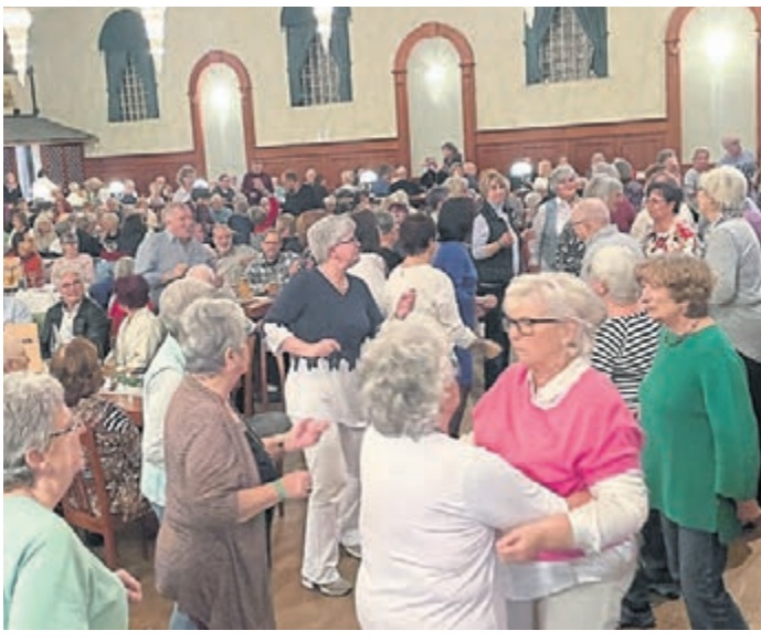
Bis Mitternacht wurde das Tanzbein geschwungen.

techniker/Mischpult) haben einmal mehr für einen ungewohnten Oldie-Abend gesorgt, der für viele sicherlich viel zu schnell vorbei ging, km