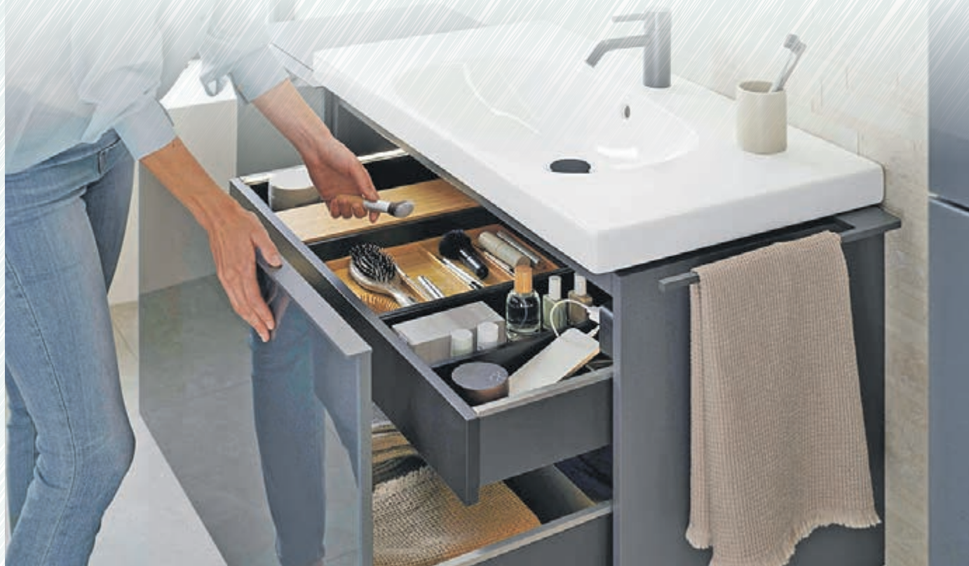
Stauraum bieten die geräumigen Schubladen von Waschtischunterschrank, die dank cleverer Ablaufsysteme ohne Aussparung für den Waschtischsiphon auskommen.

(djd). Großzügig, hell und gut organisiert: So sieht für viele Menschen ihr Traumbad aus. Doch das durchschnittliche deutsche Badezimmer ist nur circa neun Quadratmeter groß, in urbanen Regionen müssen Mieter und Wohnungseigentümer oft mit noch kleineren Grundrissen planen. Da stellt sich fast zwangsläufig die Frage: Wohin mit all den Tüben und Flaschen, den Badtextilien, dem Rasierer, dem Föhn und all den anderen Dingen, die wir für die tägliche Körperpflege benötigen? Gefragt sind Badezimmermöbel, die möglichst viel Stauraum bieten, Ordnung schaffen und dabei auch noch eine ansprechende und zeitgemäße Ästhetik besitzen.