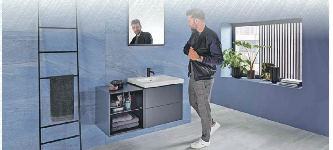
Moderne Waschplätze zeichnen sich durch Klarheit und Harmonie aus und bringen Ruhe in die Badeinrichtung.

Ein aufgesetzter Waschtisch oder ein Möbeleinbaumodell können die Form des Unterschranks aufnehmen und Ruhe in das Design des Waschplatzes bringen. Ein Spiegelschrank ist in der Regel rechteckig, nahezu wandbündig eingebaute Modelle nutzen den Raum optimal und unterstützen die zurückhaltende Badgestaltung. Alternativ bietet sich auch ein Lichtspiegel an, der ebenso wie eine Dusch- oder Badewanne Ecken und Kanten mit sich bringt. „In diesem ästhetischen Kontext macht auch das eckige WC Sinn“, führt Christoph Behling aus. Es gibt heute bereits eine Auswahl an WC-Keramiken mit eckiger Grundform und dazu passendem Sitz und Deckel. Als angenehmen Nebeneffekt erwähnt Behling, dass viele Nutzende die leicht vergrößerte Sitzfläche als komfortabler empfinden. Auch innovative WCs mit Duschfunktion sind bereits