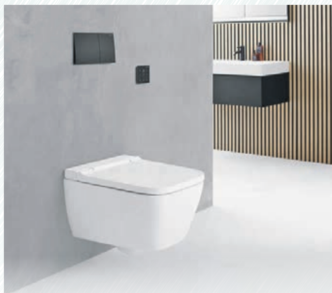
Wer sich ein Bad mit geometrischer Formensprache wünscht, muss auf den Komfort eines Dusch-WCs nicht verzichten.

erhältlich. Bei dem Modell „Aqua-Clean Sela Square“ verbirgt sich unter der eckigen Hülle eine Extraportion Wellness mit der „Whirl-spray“-Duschtechnologie, die einen besonders sanften Duschstrahl und eine angenehme Po-Reinigung verspricht. Die Innenform des WCs ist asymmetrisch und komplett ohne Spülrand gestaltet. Das Spülwasser wird in einem kraftvollen Strudel durch die Keramik geleitet und spült diese gründlich und leise aus. Die Reinigung der glatten Flächen ohne verdeckte Bereiche ist besonders einfach. Unter geberit. Als ansprechendes Accessoire in der Badgestaltung bieten die Hersteller heute eine große Auswahl an Be-tätigungsplatten für die WC-Spülung an. Die Konturen einer Drückerplatte sind meist bereits in eckiger Form. Passend zum individuellen Stil gibt es die Auslösetasten in runder oder eckiger Formensprache. Modelle wie die „Sigma 70“ von Geberit gehen in Sachen minimalistisches Design noch einen Schritt weiter und vereinen Form und Funktion – die Plattenoberfläche ist gleichzeitig die Auslösetaste. Die Oberfläche kann nach bevorzugter Optik oder präferierter Haptik ausgewählt werden. Die angebotene Palette reicht von Kunststoff und Glas über Metall und Holzoptik bis hin zu Kunststein.