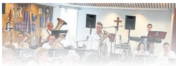
Die Gäste nutzten den rundum gelungenen und gemütlichen Nachmittag, um gemeinsam in Erinnerungen zu schwelgen, sich auszutauschen und der Musik zu lauschen.

oder andere Musikstück mitgesummt, es wurde geschunkelt und so manch einer nutzte auch die Tanzfläche.