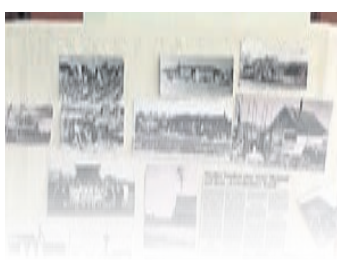
Erinnerungswand mit Berichten und Fotos aus der Anfangszeit der Siedlung St. Stephan.