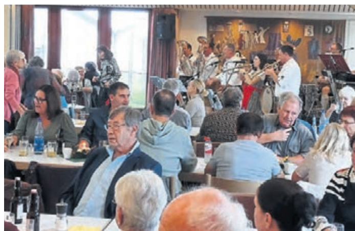
Die Siebenbürger Musikanten spielten aus ihrem großen Repertoire viele bekannte Melodien. Es wurde mitgesummt, geschunkelt und getanzt.