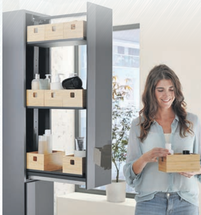
Hochschränke mit Apothekerauszug und entnehmbaren Boxen schaffen viel Platz auf kleiner Grundfläche.

Waschtisch ermöglichen zudem bei Badserien wie Acanto von Geberit den Verzicht auf einen Siphonausschnitt, wodurch mehr Stauraum in den Schubladen entsteht. Ein verschiebbares Ordnungssystem und eine Innenbeleuchtung tun ein Übriges, um Ordnung und Übersicht ins Bad zu bringen. Unter mix-and-match.geberit.com lassen sich unterschiedliche Kombinationen für den Waschtisch modular gestalten. Dabei sind drei verschiedene Badserien untereinander kombinierbar und können ganz nach den persönlichen Vorlieben und räumlichen Gegebenheiten zusammengestellt werden. Ein Spiegel gehört im Idealfall zu jedem Waschplatz, eine gute Beleuchtung ebenfalls. Warum nicht beides verbinden und zusätzlich Stauraum gewinnen? In einem Lichtspiegelschrank lässt sich vieles unterbringen, was täglich griffbereit sein soll, ohne Platz zu verschwenken. Gleichzeitig erhält der Waschplatz ein optimales Arbeitslicht für die Pflegeroutinen beim Frisieren, Schminken oder Rasieren. Es gibt heute sogar Modelle, die unter Putz eingebaut werden – und im Raum so wenig Platz beanspruchen