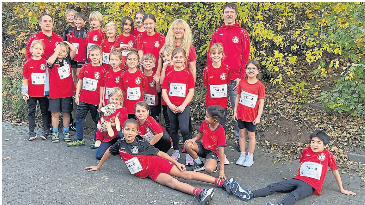
Seeheim (red). Das Team der Seeheimer Roten Tiger vom TV Seeheim (TVS) stand wieder ganz oben bei der Siegerehrung. „In der Gräfenhäuser Turnhalle krönte das Team der U8 (Foto) die Kinderleichtathletik-Saison (Kila) mit dem Tages- und auch Jahresgesamtsieg“, berichtet der TVS in einer Meldung. Dabei teilten sich die Kleinsten den obersten Podestplatz mit der Mannschaft des ASC Darmstadt. Die Seeheimer Roten Tiger 2 erreichten den achten Platz. Einen Tag später zeigten an gleicher Sportstätte die Sportlerinnen und Sportler der U10 starke Leistungen: Beim Wettkampf zwischen 19 Vereinstams belegte das Seeheimer Team 1 Platz Drei, die zweite Mannschaft landete auf Rang 14. In der Jahresgesamtwertung durften die Roten Tiger auf den zweiten Podestplatz, Punktgleich mit Wixhausen, klettern.

Leichtathletik: U8-Team des TVS holt Gesamtsieg in Gräfenhausen