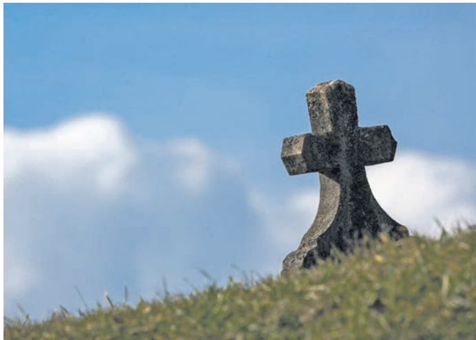
Direkt nach dem Tod eines geliebten Angehörigen schwerwiegende Entscheidungen treffen zu müssen, stellt für Angehörige häufig eine große Belastung dar.

Hat die verstorbene Person zu Lebzeiten vorsorglich bereits Entscheidungen für den Todesfall getroffen, so sollten diese unbedingt berücksichtigt werden. Gibt es Vorsorgeverträge oder Willenserklärungen zum Beisetzungsort oder dem Ablauf der Trauerfeier?