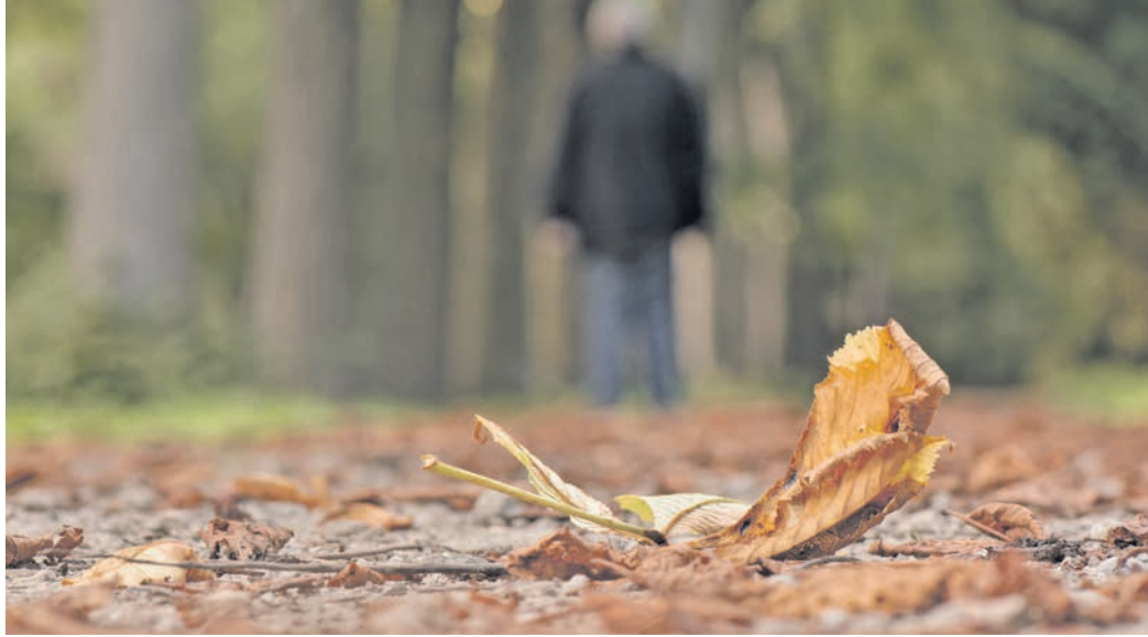
Wer sich in der Ausnahmesituation Todesfall nicht in der Lage fühlt, alleine über die Beisetzungsformalitäten zu entscheiden, kann sich Unterstützung auch bei dem Bestattungsunternehmen holen.

Ist ein Mensch verstorben, stellt eine Ärztin oder ein Arzt den Totenschein aus. Mit diesem Dokument wird der Todesfall beim Standesamt gemeldet und die Sterbeurkunde beantragt. Das muss am ersten Werktag nach dem Tod erfolgen. Ist der Angehörige in einer Pflegeeinrichtung oder einem Krankenhaus verstorben, ist die Trägerschaft für diese Formalitäten verantwortlich. Ist der Tod zu Hause eingetreten, übernimmt nach dem ärztlichen Besuch ein Bestattungshaus oft diese Aufgabe. Bestatter holen auch den Leichnam ab und bereiten ihn für die Beerdigung vor. In einem Erstgespräch kann die Familie schnell klären, welche Aufgaben den Fachleuten darüber hinaus zusätzlich übertragen werden können oder sollen und welche sie selbst übernehmen möchte. So beraten Bestatter ebenfalls zur Auswahl der Urne oder des Sarges, zu Waldbeisetzungen und vielen anderen Fragen.