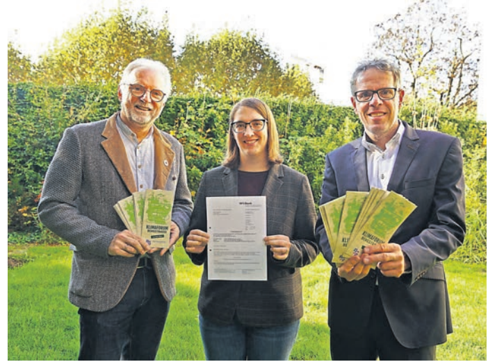
Landrat Christian Engelhardt (rechts), Katrin Heuer (Mitte) und Reiner Pfuhl (links) vom Klimaschutzteam des Kreises mit dem Förderbescheid des HMLU.

Für das neu ausgerichtete Klimaforum Bergstraße 2024 on Tour erhielt der Kreis vor kurzem rund 38.000 Euro aus der Förderung für kommunale Klimaschutz- und Klimaanpassungsprojekte sowie kommunale Informationsinitiativen vom Hessischen Ministerium für Landwirtschaft und Umwelt, Weinbau, Forsten, Jagd und Heimat (HMLU). Die Mittel seien zur Durchführung der Veranstaltungsreihe bestimmt.