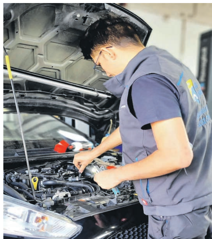
Seit über zehn Jahren sorgen die Heppenheimer Auto-Experten nun schon dafür, dass sich ihre Kundinnen und Kunden bedenkenlos durch den Straßenverkehr bewegen können.