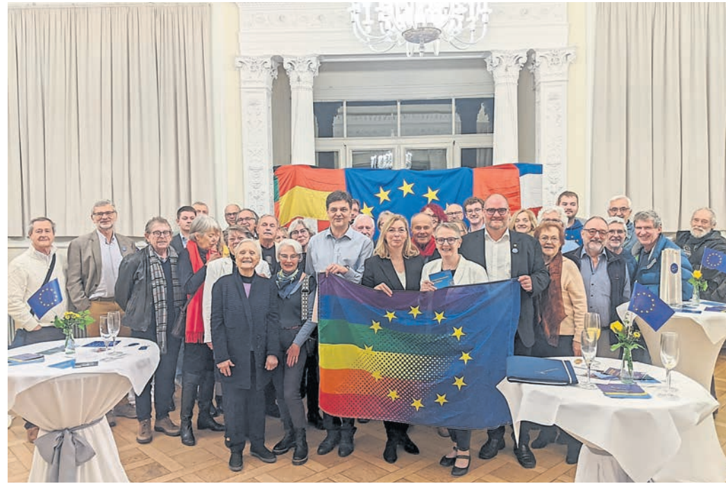
Bürgermeister aus der Region, die an der Bürgermeister-Challenge von Puls of Europe teilgenommen hatten, trafen sich unlängst auf Schloss Heiligenberg in Jugenheim.

„Mit 66 Prozent lag die Wahlbeteiligung im Kreis Darmstadt-Dieburg über den Werten für Deutschland (65 Prozent) und Hessen (63 Prozent)“, so PoE. Bei der Bürger-