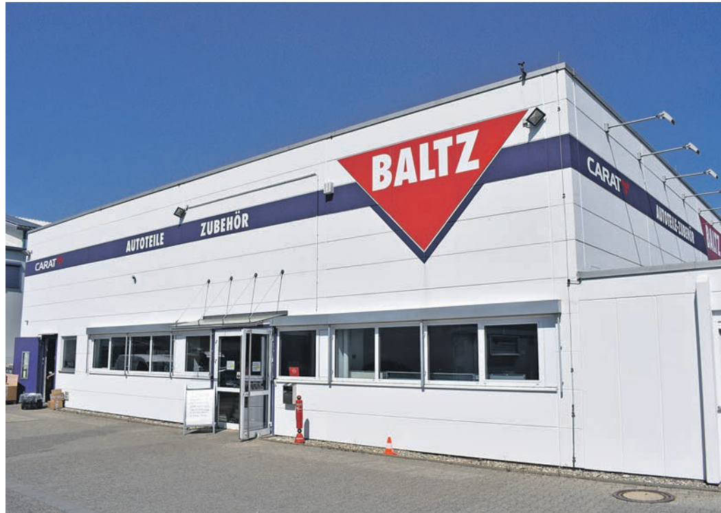
Seit bald 20 Jahren ist Autoteile Baltz in der Robert-Bosch-Straße 4A zu finden.

Autoteile Baltz bietet seinen Kundinnen und Kunden eine preiswerte und gut sortierte Auswahl an qualitativ hochwertigen Produkten führender Markenhersteller auf circa 700 Quadratmeter Lager- und Verkaufsfläche an. Aber auch Bestellungen sind kein Problem und werden von den kompetenten und freundlichen Mitarbeitern noch am gleichen Tag oder innerhalb von 24 Stunden erledigt. So müssen Autofahrer nicht lange warten, bis sie das benötigte Produkt, zum Beispiel eine Bremscheibe oder eine Zündkerze, in ihren Händen halten. Natürlich beschränkt sich das Angebot von Autoteile Baltz nicht nur auf PKWs, auch Besitzerinnen und Besitzer von LKWs oder Mopeds können sich vertrauensvoll an das Unternehmen wenden. Gerade moderne Kraftfahrzeuge begründen ihre Zuverlässigkeit und Leistung auf dem perfekten Zusammenspiel der verbauten Fahrzeugteile. Sollten diese dann aber doch einmal getauscht werden müssen ist es wichtig, mindestens gleichwertigen Ersatz für die vom Fahrzeughersteller verwendeten und empfohlenen Fahrzeugteile