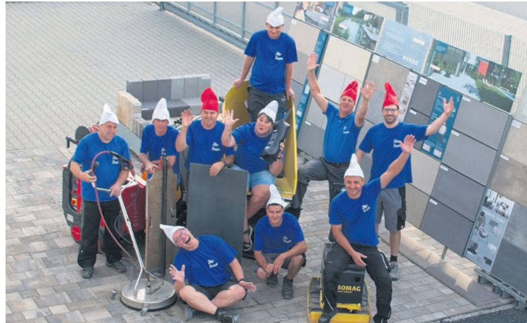
Das Team von „WG-Bau“ in Gernsheim verwirklicht gerne die Träume seiner Kundschaft und will dies auch in den kommenden Jahrzehnten tun.