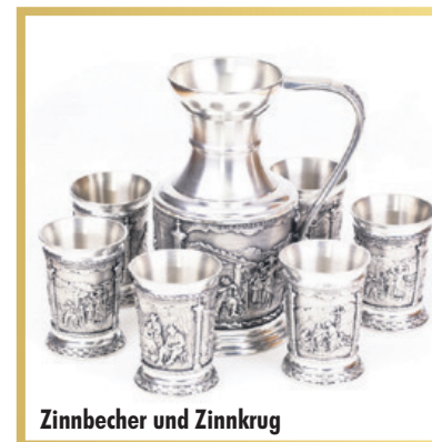
Zinnbecher und Zinnkrug