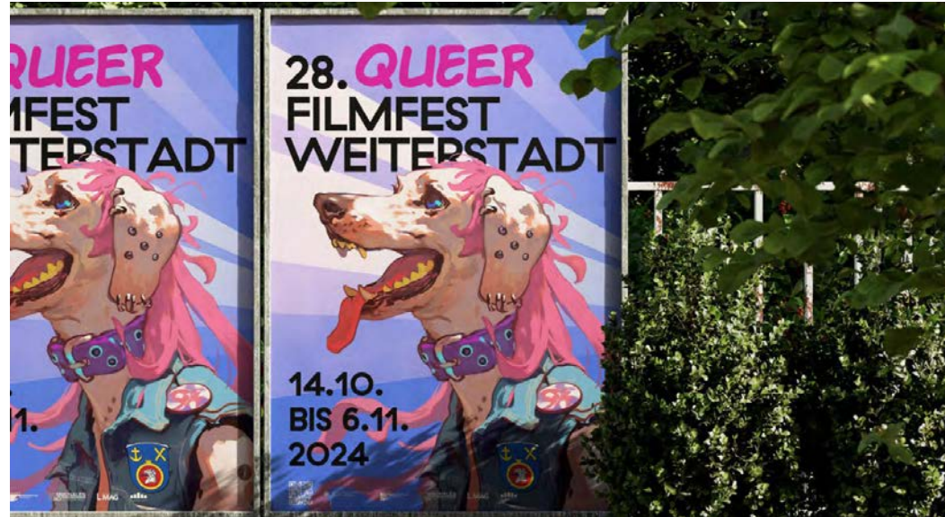
Längst ist das Queer-Filmfest im Kommunalen Kino nicht mehr aus dem regionalen Kinoangebot wegzudenken. Auf den Plakaten ist jedoch etwas im Datum verrutscht, offizieller Start im Lichtspielhaus ist am 24. Oktober.

Weiterstadt (red). Das 28. Queer Filmfest Weiterstadt im Kommunalen Kino vom 24. Oktober bis 6. November bietet ein vielfältiges Angebot an Filmen gegen Vorurteile und für mehr Diversität. Die 28. Ausgabe bietet 23 Langfilme und fünf Kurzfilmprogramme mit einer umfangreichen Auswahl an Themen wie Identitätsfindung, den Kampf um Freiheit oder gleichgeschlechtliche Liebe im Alter. Das zehnköpfige Team samt weiteren Helfenden sichtet hunderte aktueller Arbeiten auf Festivals und als Einreichung. Im Gegensatz zum Vorjahr bespielt man jetzt wieder durchgehend die 18 Uhr-Schiene. Eröffnet wird der cineastische Reigen am Donnerstag, 24. Oktober, um 19.30 Uhr mit einem Sektempfang und dem Duo „It Takes 2“. Das Ensemble aus Sängerin Jessica Cogswell aus Weiterstadt und dem in Erbach lebenden, britischen Keyboarder Max Hunt bietet ein Programm zwischen Pop, Soul und Balladen. Im anschließenden Eröffnungsfilm „Crossing“ taucht Levan Akin tief in Istanbul queere Szene ein. Der Reisefilm um eine pensionierte Lehrerin auf der