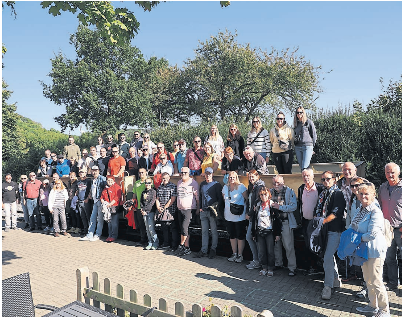
Die beiden Feuerwehrgesellschaften vor dem offenen Sommerwagen der Brohltalbahn.