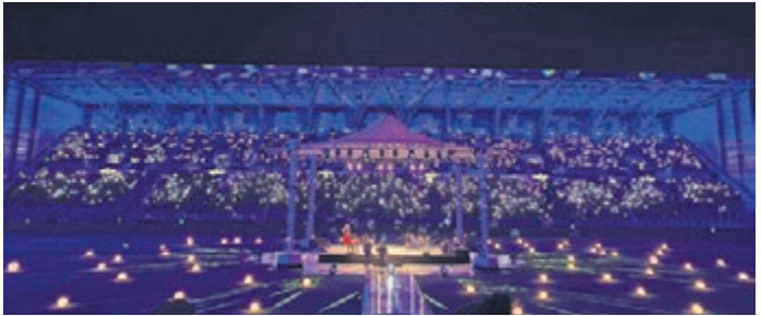
Bereits im vergangenen Jahr fand im Merck-Stadion am Böllenfalltor ein Weihnachtssingen statt. Das soll im Dezember wiederholt werden.

8. November erfolgen soll. Um eine Überschneidung zu vermeiden, wird der SVD den genauen Termin erst nach der Terminierung des Spiels festlegen. Die Lilien selbst hatten das Weihnachtssingen zunächst