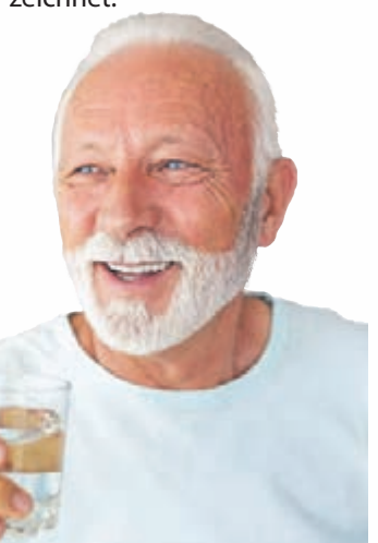
Regelmäßig trinken, so lautet eine Faustregel nicht nur für ältere Menschen: Mindestens anderthalb Liter pro Tag sollten es sein, bei Hitze deutlich mehr.

viel trinken und genügend Mineralstoffe, aber weniger Kalorien aufnehmen. Ideale Quellen dafür sind natürliche Heilwässer, die kalorienfrei Flüssigkeit und wichtige Mineralstoffe liefern. Zugleich können sie beispielsweise helfen, die Knochen zu stärken (ab 250 Milligramm Calcium), die Verdauung anzukurbeln (ab 1.200 Milligramm Sulfat) oder Sodbrennen zu lindern (ab 1.300 Milligramm Hydrogencarbonat). Heilwässer sind Naturprodukte, die in der Regel viele Mineralstoffe enthalten und nachgewiesene Wirkungen auf die Gesundheit ausüben. Die meisten Heilwässer schmecken ähnlich wie Mineralwasser und können auch täglich in größeren Mengen getrunken werden, um Gesundheit und Wohlbefinden sanft zu unterstützen. Zurzeit gibt es in Deutschland 23 verschiedene Heilwässer, die in Flaschen abgefüllt werden. Auf dem Etikett jeder Flasche sind Inhaltsstoffe, Anwendungsgebiete und Trinkempfehlungen verzeichnet.