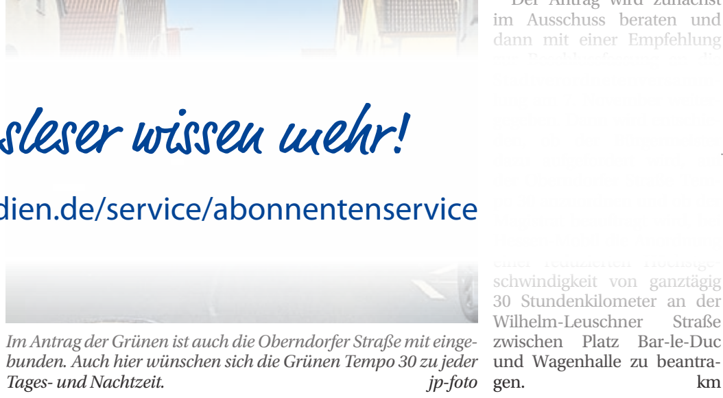
Im Antrag der Grünen ist auch die Oberndorfer Straße mit eingebunden. Auch hier wünschen sich die Grünen Tempo 30 zu jeder Tages- und Nachtzeit.

den Straßen auf durchgängig 30 Stundenkilometer zu reduzieren. Derzeit ist auf der Oberndorfer Straße Tempo 50 erlaubt. Auf der Chaussee darf ebenfalls 50 gefahren werden. Einzige Ausnahme ist der Bereich vom Grünen Zimmer bis etwa zur Weichgasse, in dem die Geschwindigkeit in der Zeit von 22 bis 6 Uhr auf 30 Stundenkilometer reduziert ist. „Vor zwei Jahren hat sich die Stadt Griesheim durch einstimmigen Beschluss der Stadtverordnetenversammlung der Initiative ‚Lebenswerte Städte durch angemessene Geschwindigkeiten‘ angeschlossen, dessen Ziel es ist, Kommunen mehr Mitsprache und Möglichkeiten bei der Gestaltung des Straßenverkehrs zu geben. Durch die aktuelle Grünen ein zusätzlicher Handlungsbedarf aus dem in Aufstellung befindlichen Lärmaktionsplan. In diesem vierten Entwurf ist zur Oberndorfer Straße zu lesen: „In weiten Streckenabschnitten werden die Orientierungswerte, die eine Prüfung der Anordnung von straßenverkehrsrechtlichen Maßnahmen erfordern, sowohl tagsüber als auch nachts überschritten. (...) Eine Geschwindigkeitsbegrenzung auf 30 Stundenkilometer zeigt eine überwiegende Pegelminderung um bis zu drei Dezibel.“ Zur Begründung einer durchgängigen Tempo-30-Zone auf der Wilhelm-Leuschner-Straße im genannten Kraftfahrzeug-Verkehr wird daher durch Tempo 30 nicht