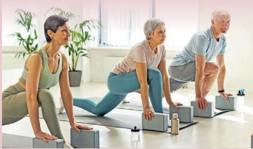
Fließende Bewegungsabläufe, wie sie etwa beim Yoga üblich sind, tun den Gelenken erwiesenermaßen gut.

Personen machbar sind. Anfangs ist es sinnvoll, die Übungen unter Anleitung eines geschulten Trainers zu machen, der auf die richtige Ausführung achtet. Qualifizierte Coaches können außerdem auf die speziellen Gelenkprobleme der Teilnehmer eingehen und helfen, falsche Belastungen zu vermeiden. Viele Krankenkassen fördern hier entsprechende Kurse, die etwa in Vereinen, Yoga- oder Fitnessstudios und Volkshochschulen angeboten werden. Wichtig ist es, mit der Fitness aus Fernost behutsam zu starten und sich dann erst nach und nach an anspruchsvollere Übungen heranzuwagen. Und gerade in der kalten Jahreszeit sollte man sich vor jeder Trainingseinheit immer gut aufwärmen. Das gilt ebenfalls für alle anderen