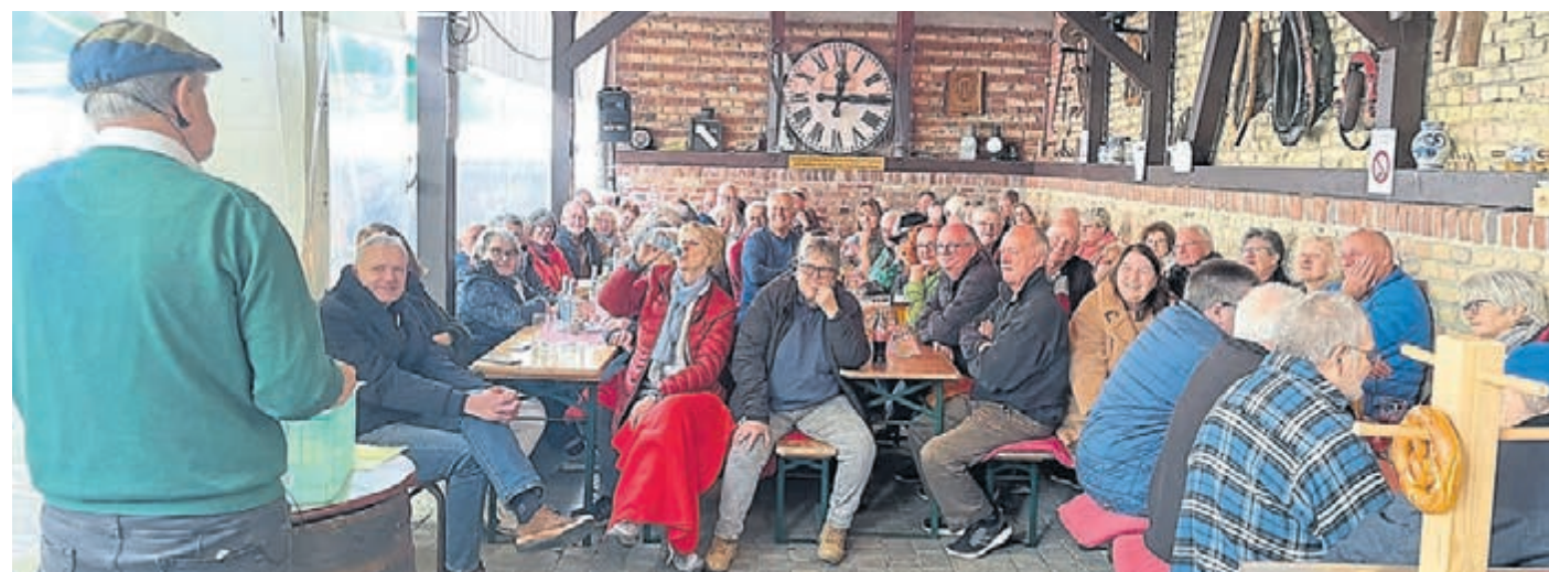
Der Platz in der Remise reichte nicht aus, so dass einige Gäste im Hof davor über Lautsprecher zuhörten und sich köstlich amüsierten.

www.plegge-medien.de/service/abonnentenservice