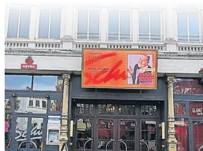
Woods Leuchtreklame am Tivoli-Theater in Hamburg.