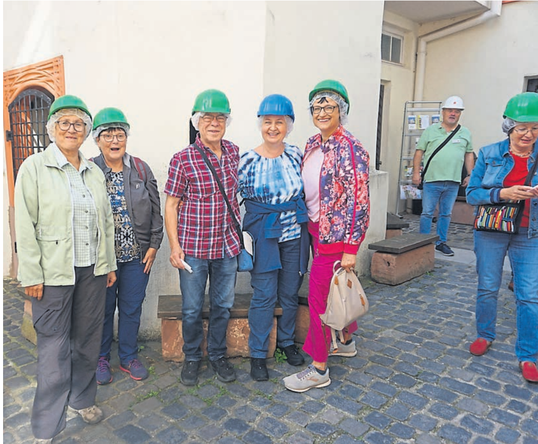
Kurz vor dem Einlass in den Oppenheimer Untergrund: die Wandergruppe aus Eschollbrücken mit den vorgeschriebenen Schutzhelmen.