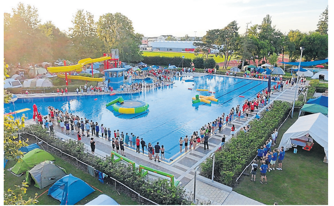
Mit über 700 Teilnehmenden war das „Swim In“ in Griesheim ein voller Erfolg.