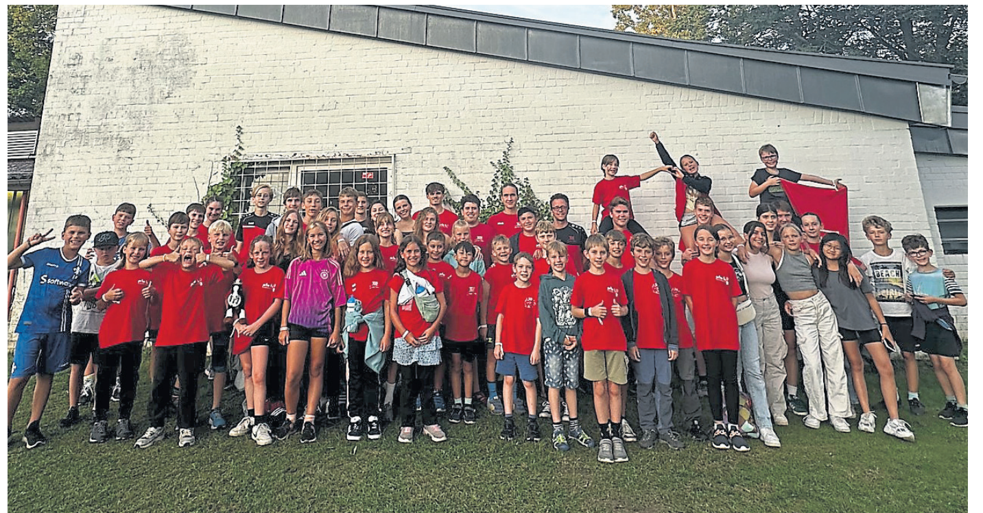
Die TuS-Schwimmabteilung verbrachte beim „Swim In“ ein kurzweiliges Wochenende im Griesheimer Freibad.

dann alle fertig für die große Saturday-Night-Show, die in der Kirschberghalle stattfand. Gegen 19.30 Uhr zogen dann 700 Schwimmerinnen und Schwimmer, angeführt von den Gastgebern und der Swim-In-Fackel, durch Griesheim Richtung Sporthalle. „Dort gab es Magie, Schattenspiel, Tanz und eine anschließende Disco“, so der TuS. Am Sonntagmorgen verwandelte sich das Freibad dann in eine olympische Spielstätte und auch die TuS-Schwimmer traten zur großen Lagerolympiade an und zeigten ihr Können bei allerlei Spielen. Den Abschluss des Wochenendes bildet dann noch das traditionelle „Swim-Out“.