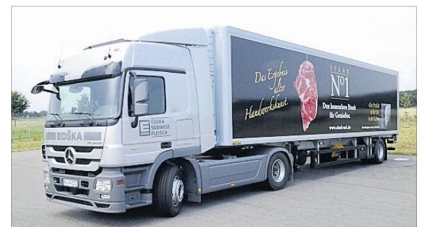
Am Standort Rheinstetten von Edeka Südwest Fleisch befindet sich einer der modernsten Betriebe Europas zur Verarbeitung von Fleisch. Rund 1500 Mitarbeitende, darunter 50 Azubis, sind hier beschäftigt. Über 1100 Edeka-Märkte in fünf Bundesländern, darunter auch in Hessen, versorgt der auf einem Areal von 20 Hektar befindliche Produktionsbetrieb nahe Karlsruhe.