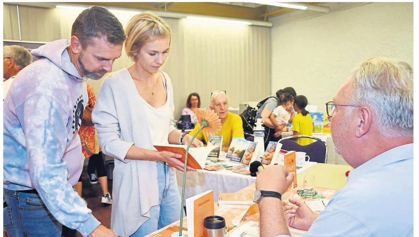
Allerlei Literatur hielt die Buchmesse im Georg-August-Zinn-Haus bereit.