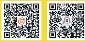
Apotheken.app Apotheke im Hauptbahnhof