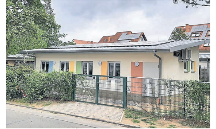
Der Erweiterungsbau der Kita Draustraße soll voraussichtlich im Oktober eröffnet werden.

Griesheim (red). Die Stadt Griesheim teilt mit, dass der Erweiterungsbau der Kita Draustraße im Ortsteil St. Stephan, bis auf kleinere Restarbeiten, fertiggestellt wurde. Im Anschluss beginnen jetzt die Arbeiten an den Außenanlagen rund um das neue Gebäude, um eine sichere Zuwegung vom Hauptgebäude zum Neubau zu gewährleisten. Nach Abschluss dieser Arbeiten soll die Eröffnung des Erweiterungsbaus voraussichtlich im Oktober stattfinden. „Die Stadt Griesheim hat die Kindertagesstätte Draustraße durch einen rund 60 Quadratmeter großen, eingeschossigen Erweiterungsbau in elementarierter Holzbauweise erweitert. Die 1960 erbaute Kindertagesstätte ist in den letzten Jahren an ihre Kapazitätsgrenzen gestoßen. Sowohl die Aufenthalts- und Schlafräume für die Kinder als auch die Rückzugsmöglichkeit für das Kita-Personal waren nicht mehr ausreichend“, erklärt die Stadtverwaltung. Der Neubau beinhaltet einen