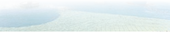
In fünf Wochen verzeichnete das Griesheimer Freibad knapp 32000 Besucher.

sche Untersuchung zeigte, dass Grenzwerte von Ansaug-, Ablauf- und Zulaufanlagen überschritten wurden (wir haben berichtet), die behoben werden mussten. Am Eröffnungstag begrüßten die Bademeister dann bereits rund 1250 Besucher. Das Hallenbad war während der Freibadsaison nicht geöffnet. Zu den über 30000 Besuchern kommen außerdem noch die Vereinsschwimmer hinzu, die bei der Besucherzahl nicht berücksichtigt werden.