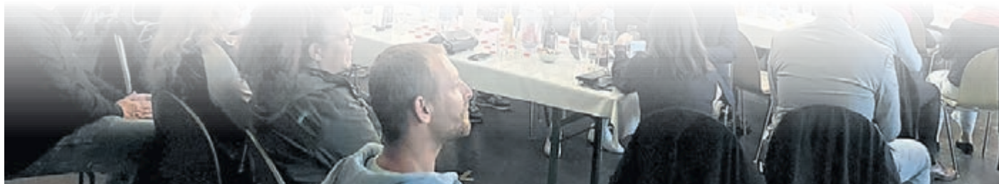
Einen humorvollen Abend in lockerer Atmosphäre erlebten die rund 150 Gäste am Dienstag bei der Jubiläumsfeier des TuS Griesheim in der Wagenhalle. Interviews, Aufführungen und Musikeinlagen sorgten für ein buntes Rahmenprogramm.

www.plegge-medien.de/service/abonnentenservice