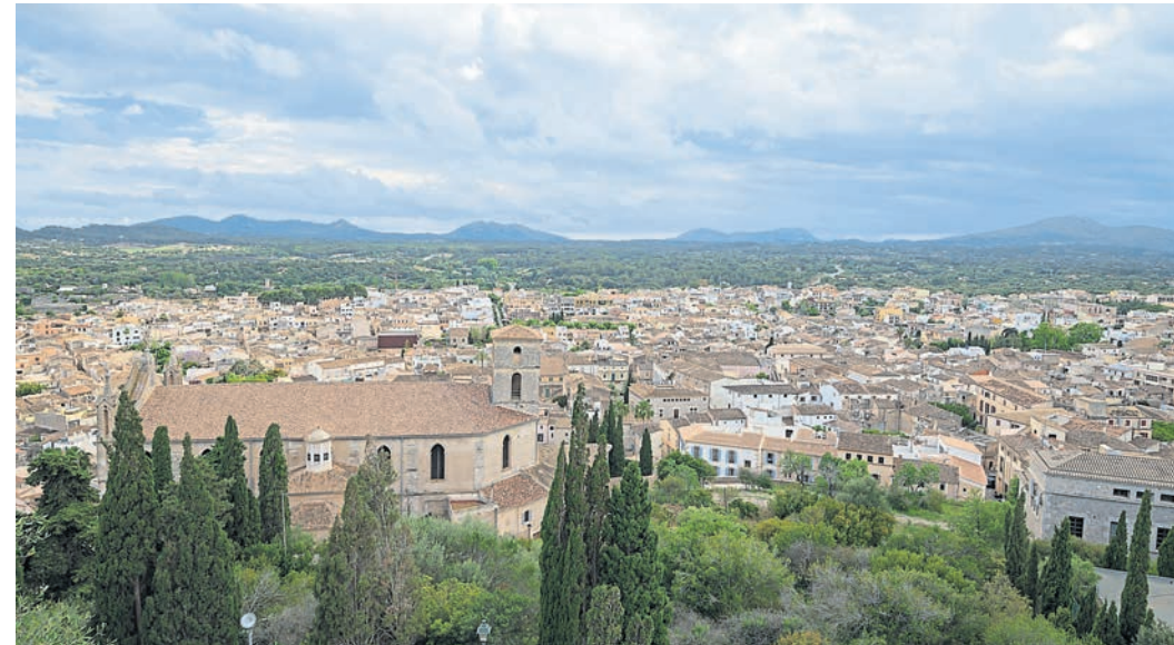
Links: Das kleine Städtchen Artá von oben. Auch hier gibt es einen sehenswerten Markt. Rechts: La Seu, die Kathedrale in Palma, hat eine lange Geschichte. Ganze 400 Jahre dauerte ihr Bau.

Nach zwei Stunden Fährfahrt von Menorca aus kamen wir in Alcudia auf Mallorca an. Unsere Unterkunft lag dieses Mal im Nordosten der Insel. Eine kleine, abgelegene Finca mit Pool in der Nähe von Cala Rajada. Der riesige Außenbereich lud zum Verweilen und Entspannen ein, was wir in den kommenden Tagen auch ausführlich taten. Nachdem wir uns am Tag unserer Ankunft erst einmal einrichteten, begannen wir am folgenden Tag mit dem weiteren Erkunden von Mallorca. Da es ein Mittwoch war, lag es für uns auf der Hand, den Markt in Santanyi zu besuchen. In den Markt und die Stadt hatten wir uns bereits im Jahr zuvor ein wenig verliebt, sodass wir die Anfahrt von einer Stunde gerne in Kauf nahmen. Zwar war der Markt bei unserem