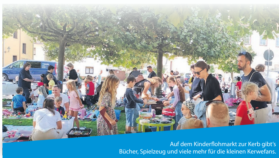
Auf dem Kinderflohmärkte zur Kerb gibt's Bücher, Spielzeug und viele mehr für die kleinen Kerwefans.