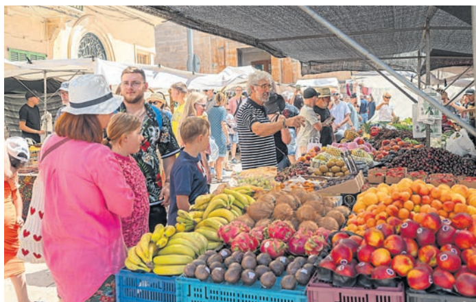
Links: Eindrücke vom Markt in Santanyi. Rechts: Eine Impression aus Palma.

Trotz des holprigen Starts und der großen Enttäuschung vor der Reise ließen uns diese Erlebnisse all das vergessen. Wo es uns in Zukunft hin verschlägt, vielleicht auch noch in diesem Jahr, steht zu diesem Zeitpunkt noch nicht fest – starten wir vielleicht einen erneuten Versuch, mit dem Camper durch Norwegen zu reisen?