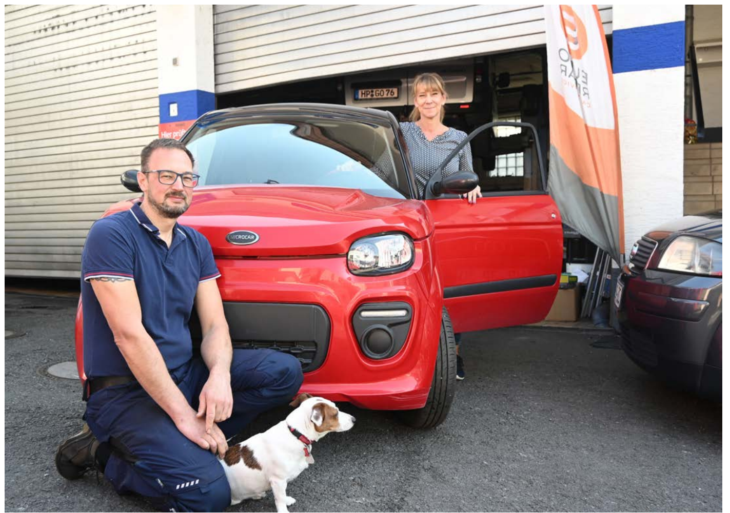
In guten Händen: Bei Auto Frank können die Kundinnen und Kunden darauf vertrauen, dass das eigene Fahrzeug vollumfänglich geprüft und bei Bedarf entsprechend gewartet und repariert wird.

Auto Frank: Ausgezeichneter Kfz-Meisterbetrieb in Reichenbach