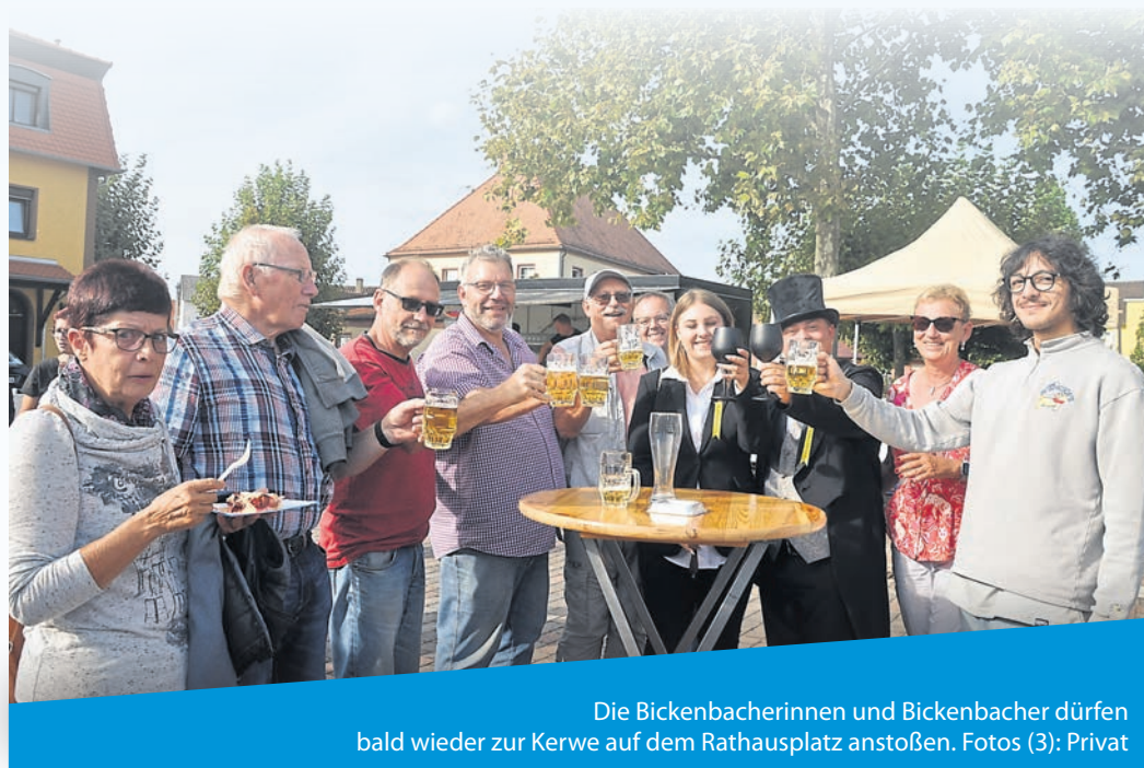
Die Bickenbacherinnen und Bickenbacher dürfen bald wieder zur Kerwe auf dem Rathausplatz anstoßen.