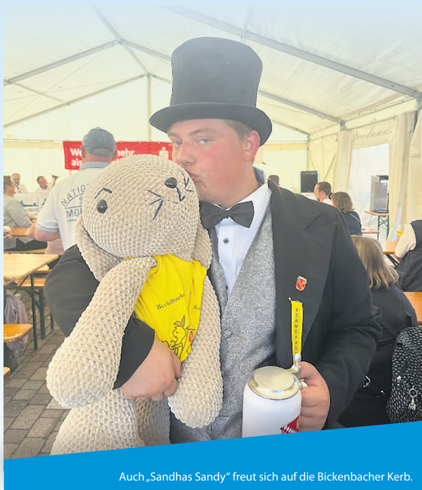
Auch „Sandhas Sandy“ freut sich auf die Bickenbacher Kerb.