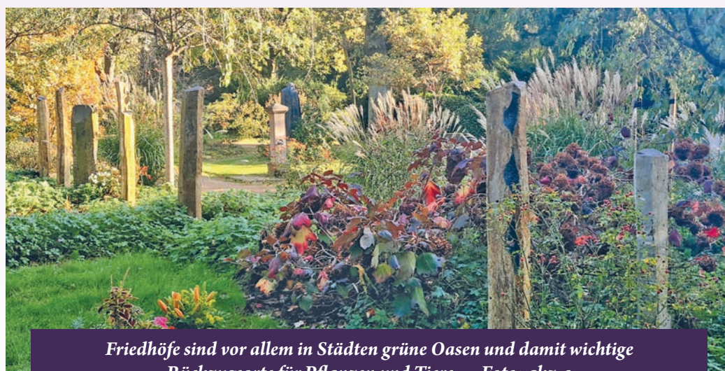
Friedhöfe sind vor allem in Städten grüne Oasen und damit wichtige Rückzugsorte für Pflanzen und Tiere.

Tier- und Pflanzenarten beheimatet ist. Der Wandel in der Friedhofskultur führt dazu, dass Friedhofsträger bewusst Aspekte des Klima- und Umweltschutzes in ihre landschaftlichen und gestalterischen Planungen einbeziehen. So entstehen auf Friedhöfen beispielsweise Insektenweiden, Areale mit Bienenstöcken oder naturbelassene Flächen, die den parkähnlichen Charakter mancher Friedhöfe noch stärker betonen.