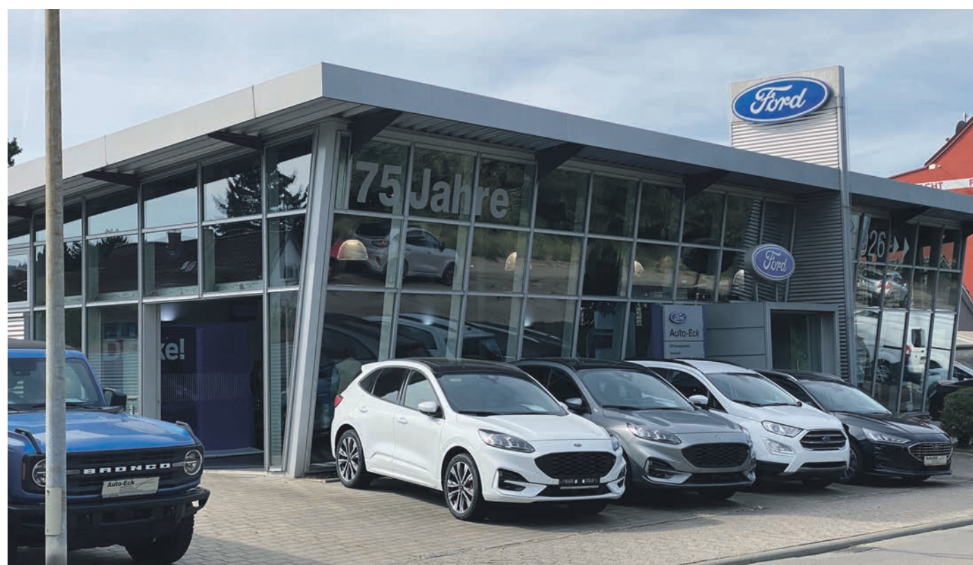
Das Autohaus in der Breslauer Straße ist spezialisiert auf Modelle der Marke Ford. Centro-, Maxus-, XEV- und DFSK-Fahrzeuge gehören aber ebenso zum Sortiment.

Ihr Ford Vertragspartner für Fahrzeugverkauf und Service