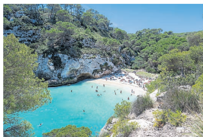
Links: Der sehr bekannte, aber schwer zu erreichende Strand Macarelleta. Rechts: Impression aus der Altstadt von Ciutadella.

An unserem letzten Tag auf Menorca erkundeten wir noch ein wenig den Norden der Insel. Das etwas trübe Wetter passte an diesem Tag hervorragend zu den schroffen Landschaften des Nordens. Wir besuchten die Cala Viola de Ponent, die auf dem Weg zum Cape Cavalleria Lighthouse liegt. Die Straße zum Leuchtturm schlängelt sich kilometerlang über Felsen und Klippen und ist auf jeden Fall eine Fahrt wert. Den Abschluss unserer Menorca-Reise bildete dann die Aussicht auf den Cala Tirant. Am Ende bleibt zu erwähnen, dass wir den Endgegner (ich berichtete in Teil I) erfolgreich besiegt und am nächsten Tag nach Mallorca übersetzen konnten.