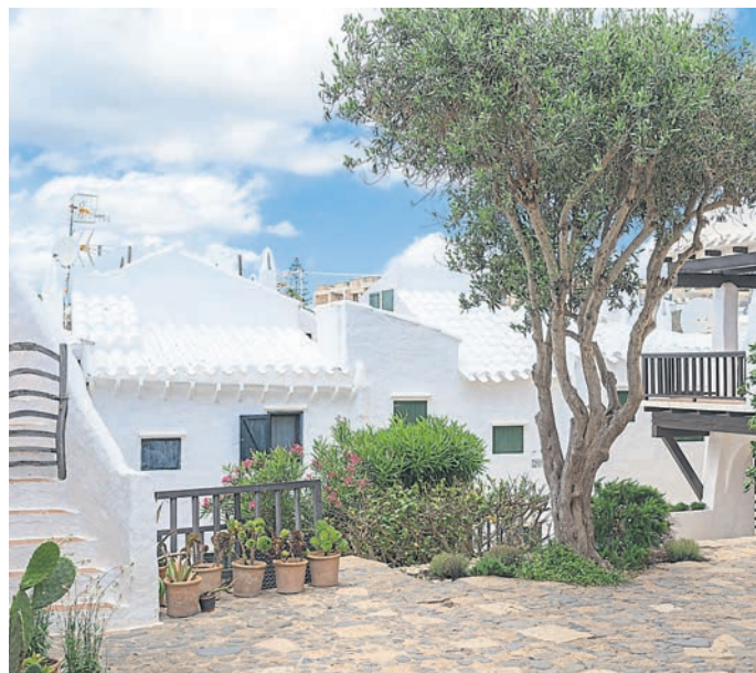
Links: Die weiße Stadt Binibeca Vell. Ihre Fassaden sind komplett in weiß getaucht. Rechts: Es Castell bei Nacht. Der kleine Hafen in der Nähe von Mahon ist einen Ausflug wert.

Menorca – Weiße Strände und bezaubernde Städte / Reisebericht Teil Zwei