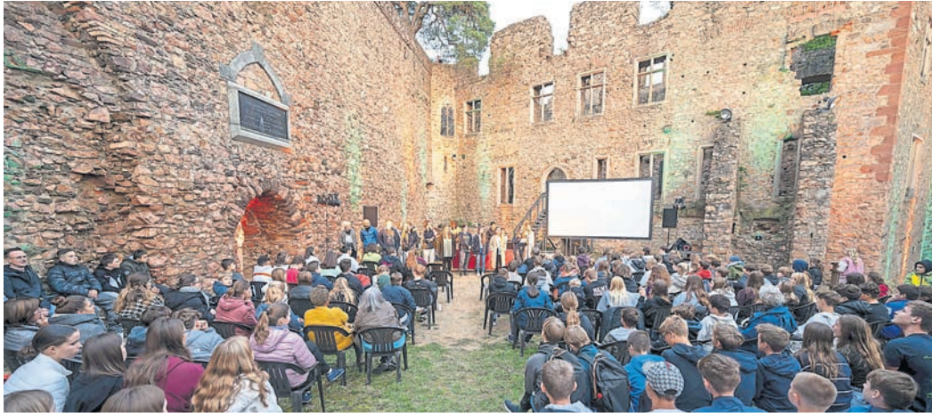
Rund 300 Jugendliche nahmen am Jugendgottesdienst in den Ruinen des Auerbacher Schlosses teil.

Jugendkirche im malerischen Auerbacher Schloss