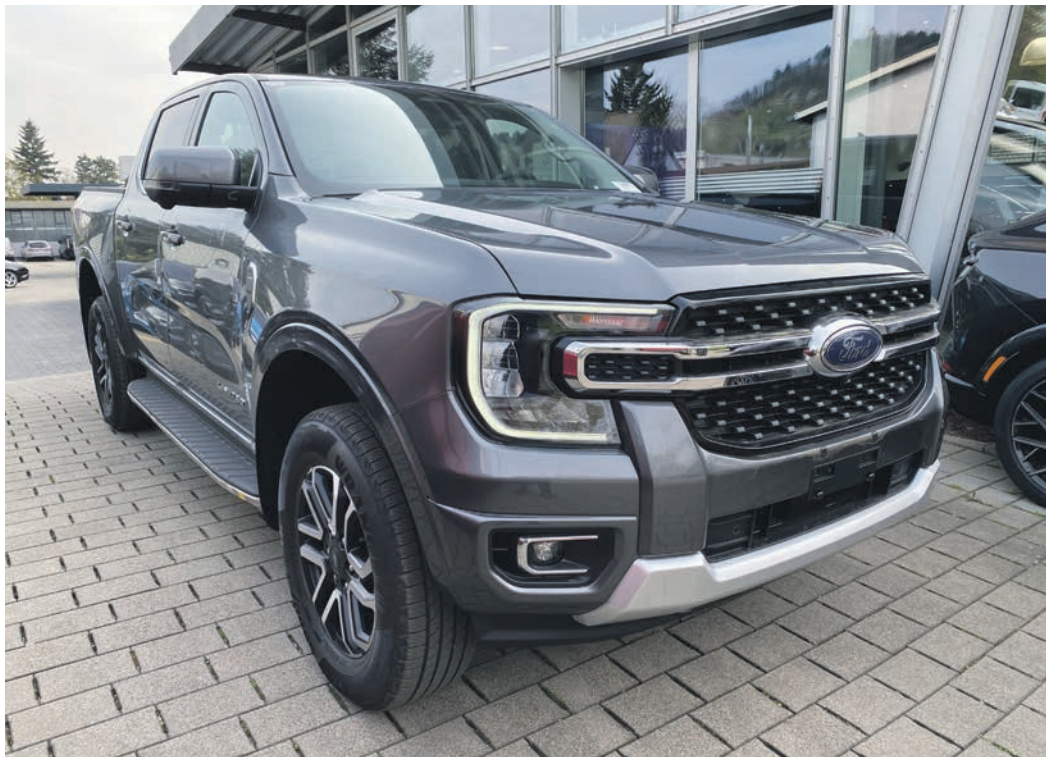
Wer auf der Suche nach einem der vielen Modelle der Marke Ford ist, wird beim Autohaus Auto-Eck in Heppenheim garantiert fündig.

Die Mobilitäts-Experten von Auto-Eck verfügen jedoch nicht nur im Bereich der Ford-Fahrzeuge über große Expertise, denn seit einiger Zeit umfasst die Produktpalette nun auch Fahrzeuge der Marken Maxus und Tropos, heute bekannt als Cenntro. Während die robusten und vielseitigen Maxus-