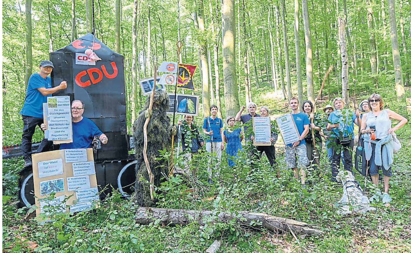
Mitglieder des Seeheim-Jugenheimer NABU demonstrierten mit der Errichtung von „Monstern“ gegen die Fällung alter Buchen im hessischen Staatswald.

NABU übt mit Aktion im Schutzwald Kritik an Plänen der Landesregierung