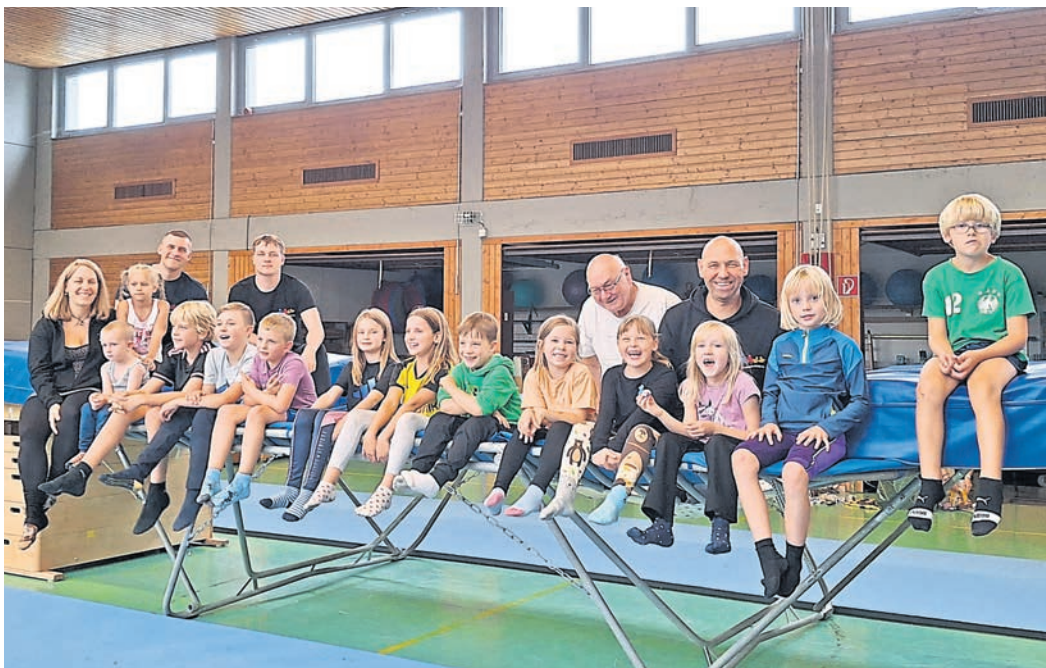
Schlechtes Wetter zwang die Teilnehmenden des „Leichtathletischen Dreikampfs“ beim TV Hähnlein in die Halle. Den Spaß ließen sich die Mädchen und Jungen davon aber nicht nehmen.

ten sich auf die verschiedenen sportlichen Aktivitäten.“ Dennoch hofft man beim Verein, dass der traditionelle Dreikampf im nächsten Jahr wieder „trocken und unter etwas wärmeren Bedingungen stattfinden kann“. Interessierte sind eingeladen, zum Training der „Spiel, Spaß und Sportabzeichen“-Gruppe vorbeizuschauen. Sie trainiert jeden Mittwoch um 17 Uhr auf dem Außengelände oder in der Sporthalle der Hähnleiner Grundschule. Weitere Infos: tv-haehnlein.de