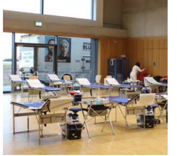
500 ml Blut kann Leben retten.

Braunshardt (red). Das DRK Braunshardt lädt am Freitag, dem 30. August, von 15 bis 19.30 Uhr, herzlich ein zur dritten Blutspende in diesem Jahr – auch diesmal wieder im Bürgerhaus Braunshardt und ausschließlich mit Terminreservierung (terminreservierung.blutspende.de/oeffentliche-spendeorte/6433132/), schreibt das DRK Braunshardt.