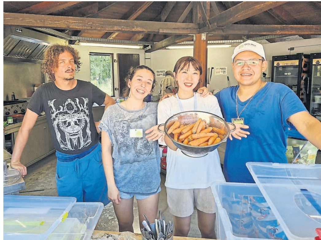
Gut drauf auch bei Gluthitze sind die Workcamper in Weiterstadt. Ihr Teamspirit ist beeindruckend und ansteckend.