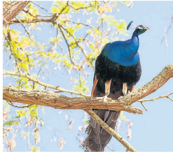
Wer die Kellerranch besucht, wird von diesem wunderschönen Vogel empfangen. Der Pfau Sparkey lebt seit 2016 hier und darf sich frei auf dem Gelände bewegen.

Eine Woche nach dem Tag der offenen Tür findet die Premiere von „Charly's Rock