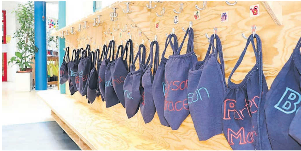
Viele Kinder in den Weiterstädter Kitas werden jeden Tag von morgens bis in den Nachmittag und frühen Abend betreut. Ab 2025 könnten die Randstunden nachmittags um eine Stunde reduziert werden, weil der Erziehermangel bei der Stadt Weiterstadt immer noch groß ist.

Dieser Brief hat nun dazu geführt, dass einige Eltern sich Sorgen machen, wie sie die Betreuung ihrer Kinder dann organisieren können. Andere sind empört und werfen in den Raum, dass eine Kürzung der Betreuungszeit deswegen vorgenommen würde, damit „die Erzieher mehr Freizeit haben“. Aber auch die Unvereinbarkeit von Beruf und Familie wird hier wie-