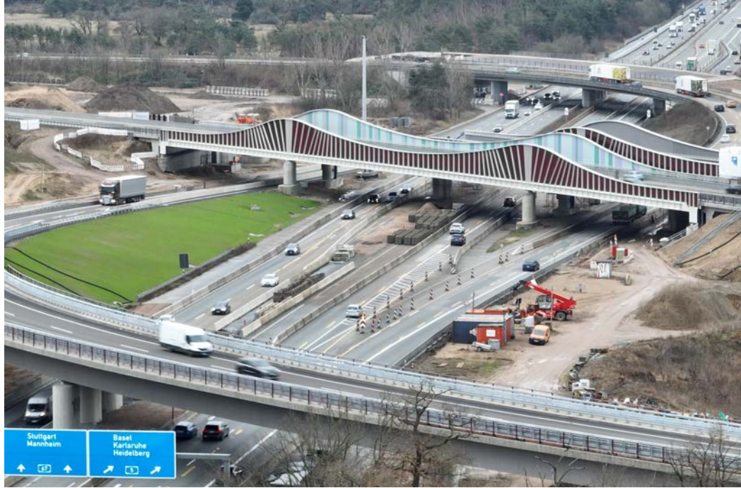
Aufgrund von Instandhaltungsmaßnahmen entfällt von Samstag auf Sonntag die Einfahrtmöglichkeit über die A672 auf die B26 nach Darmstadt. Unser Foto zeigt die neue Brücke am Darmstädter Kreuz.

Anschlussstelle Darmstadt-West Samstagnacht gesperrt