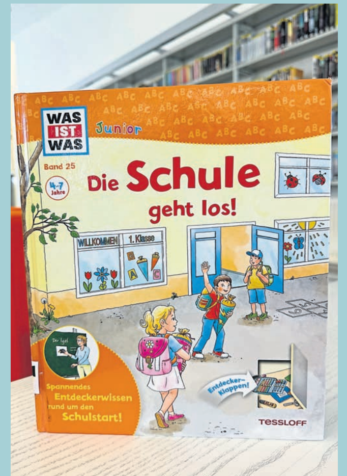
Das Team der Stadtbücherei im Medienschiff findet jede Woche einen neuen, spannenden Büchertipp für die Leserschaft des „Wochen-Kurier“.

Heute: Heute: „Die Schule geht los!“ von Christina Braun (Kindersachbuch)