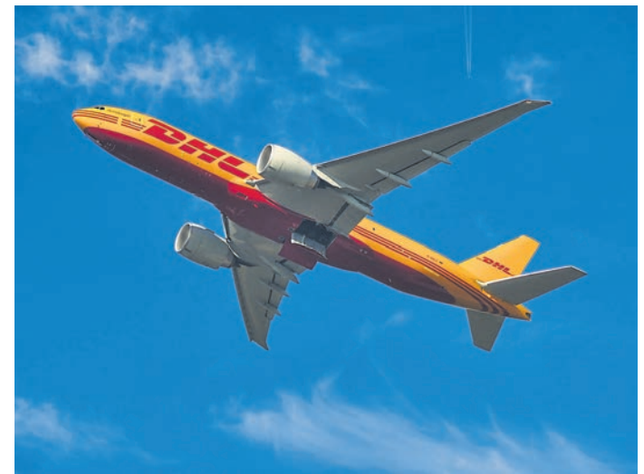
Am Himmel zieht ein ums andere Flugzeug seine Bahn über Weiterstadt (Foto aus dem Jahr 2021). Vor allem Gräfenhausen hat sehr unter dem Fluglärm zu leiden, aktuell sei es lauter als je zuvor.

Auf Nachfrage beim Forum Flughafen und Region (FFR), das die aktuellen und zukünftigen Flugrouten prüft und Empfehlungen ausspricht, wurde dem Wochen-Kurier mitgeteilt, dass es keinen Zusammenhang mit der alternativen Flugroute Cindy S, Variante B, gebe: „Abflüge in Richtung Südosten werden seit Januar 2021 über die Route Cindy S (früher Amix kurz) geflogen. Eine Entscheidung für oder gegen die FFR-Empfehlung und die damit verbundene Beantragung des Probetriebs beim Bun-