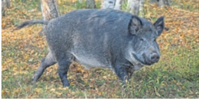
Die Afrikanische Schweinepest ist in Südhessen weiter auf dem Vormarsch.

Region (ps). Ende vergangener Woche wurde die Afrikanische Schweinepest (ASP) bei einem Wildschwein in der Gemarkung Ober-Ramstadt nachgewiesen. Aufgrund der geografischen Lage des Fundes inmitten des Kreises wird es nun erforderlich, die Sperrzone II zu erweitern, erklärt der Kreis Darmstadt-Dieburg. Auch im Kreis Bergstraße wurde die Sperrzone II ausgeweitet. Die beiden Kreise haben am Dienstag, 6. August, neue Allgemeinverfügungen zur Bekämpfung der ASP erlassen (Stand bei Redaktionsschluss). In der Sperrzone II (infizierte Zone) liegen nun 22 Kommunen des Kreises Darmstadt-Dieburg, wobei Babenhausen, Eppertshausen, Groß-Umstadt und Münster nur in Teilen in der infizierten Zone liegen. Nur Schaaheim sei bis jetzt nicht in der Sperrzone II. Für alle Kommunen innerhalb der Sperrzone II gibt es ein striktes Wegegebot sowie eine Leinenpflicht für Hunde. Es gilt ein Jagdverbot und für landwirtschaftliche Arbeiten gelten besondere Voraussetzungen. Zur Verhinderung der weiteren Ausbreitung der ASP werden in den nächsten Tagen und Wochen weitere Zäune aufgestellt werden, so der Kreis Darmstadt-Dieburg. Der grün gekennzeichnete Bereich soll die zukünftige Sperrzone I, die sogenannte Pufferzone, darstellen. Diese Zone, in der die Gemeinde Schaaheim sowie Teile der Städte Babenhausen und Groß-Umstadt liegen, wurde noch nicht verfügt, eine entsprechende