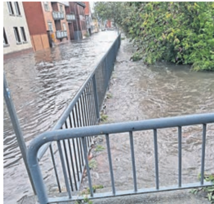
Jede Menge Wasser: Der Pegel der Modau stieg durch den heftigen Regen stark an.

Eine weitere Anwohnerin berichtete davon, dass auch die Modau nahe des historischen Rathauses über die Ufer getreten sei. Gegenüber dem Echo gab der stellvertretende Kreis-