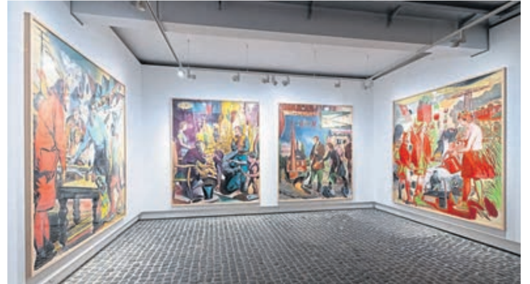
Die gegenwärtige Ausstellung mit Werken von Neo Rauch im Bensheimer Museum lockt viele Besuchende an die Bergstraße.

Mit Rauch präsentiert einer der bedeutendsten deutschen Künstler der Gegenwart und der prominenteste Vertreter der Leipziger Schule im städtischen Museum seine Werke. Der Kontakt ergab sich über die Ausstellung seiner Frau Rosa Loy in Bensheim. Sie hatte im vergangenen Jahr eine Gemeinschaftsausstellung mit der britischen Künstlerin Rose Wylie im Museum am Marktplatz. Rauch selbst habe bei der Vernissage vor 350 Gästen Anfang Juli erklärt, dass Bensheim eine weitere Perle auf einer Kette solcher Orte sei, in denen er gerne ausstelle, weil sie eine gewisse Wärme zurückspielen. „Selbst als Kurator an einem großen Haus ist einem viel-