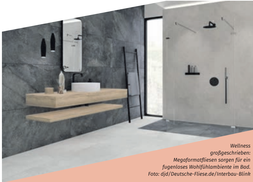
Wellness großgeschrieben: Megaformatfliesen sorgen für ein fugenloses Wohlfühlambiente im Bad.

(djd). Big is beautiful: Großformatige Fliesen liegen schon länger im Trend. Neu sind die sogenannten Megaformate mit Kantenlängen bis zu 1,20 x 2,60 Metern. Solche Fliesen erlauben es, Wand- und Bodenflächen ebenso harmonisch wie hochwertig zu gestalten – sei es im Bad oder in anderen Wohnbereichen. So kann eine einzige Fliese die gesamte Wandfläche einer Dusche bekleiden – Stichwort: das fast fugenlose Bad mit Fliesen. Zugleich weiten die imposanten Fliesen Flächen und damit den ganzen Raum optisch. Angenehmer Nebeneffekt: Der geringe Fugenananteil erhöht den von Haus aus hohen Reinigungskomfort von Fliesen zusätzlich.