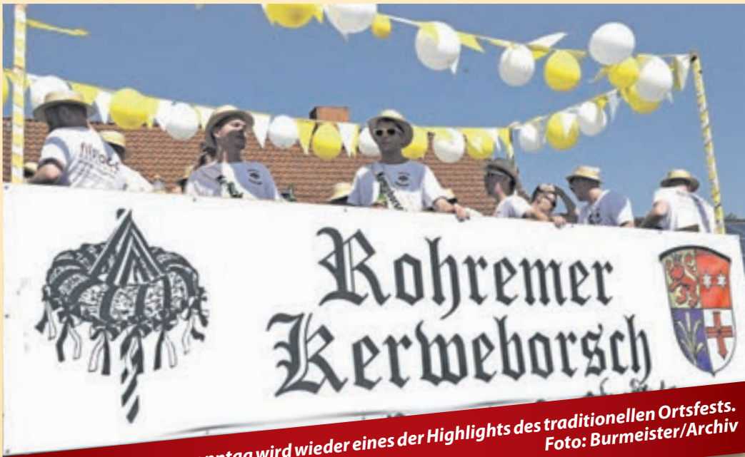
Der Umzug am Kerwesonntag wird wieder eines der Highlights des traditionellen Ortsfests.

Los geht es am frühen Samstagnachmittag um 14.30 Uhr wieder mit dem Aufstellen des Kerwebaums durch die Kerweborsch. Ist das geschafft, gibt es gleich im Anschluss den Fassbieranstich durch den Schirmherrn und Bürgermeister Karsten Krug. Der eröffnet die Kerwe damit auch offiziell. Die musikalische Unterhaltung zur Eröffnung kommt wie immer von der Rohrheimer Blasmusik. Der Samstagabend in der Bürgerhalle – auch das hat Tradition – bietet reichlich Livemusik mit der Band „Sounds“. Gespannt sein darf man dann