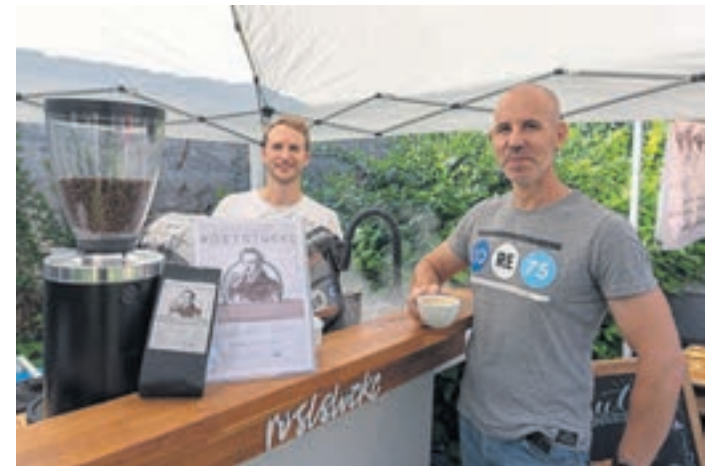
Goddelau (sh). Bereits zum achten Mal fand am vergangenen Samstagmorgen das Marktfrühstück im Goddelauer Kirchhof statt. Ins Leben gerufen wurde die Veranstaltung von den Jungs von „Schorschtoun“, die auch dieses Mal wieder mit ihrem eigenen Kaffee vor Ort waren. Etliche lokale und regionale Einzelhändler sorgten mit ihren Köstlichkeiten dafür, dass jeder Wunsch erfüllt wurde. Beispielsweise war die Räucherlachs Küche „Pahle“ aus Goddelau am Start, ebenso wie die Konditorin Balzer aus Erfelden oder „Gude Woi“ aus Gernsheim. Das Frühstück zog wie immer zahlreiche Besucherinnen und Besucher an und bot Gelegenheit, um sich mit Freunden zu treffen, dabei den ein oder anderen Schoppen zu trinken, vor Ort zu frühstücken oder um sich mit der ein oder anderen Leckerei für zuhause einzudecken. In diesem Jahr findet kein Marktfrühstück mehr statt. Das nächste ist für das erste Maiwochenende im kommenden Jahr geplant.