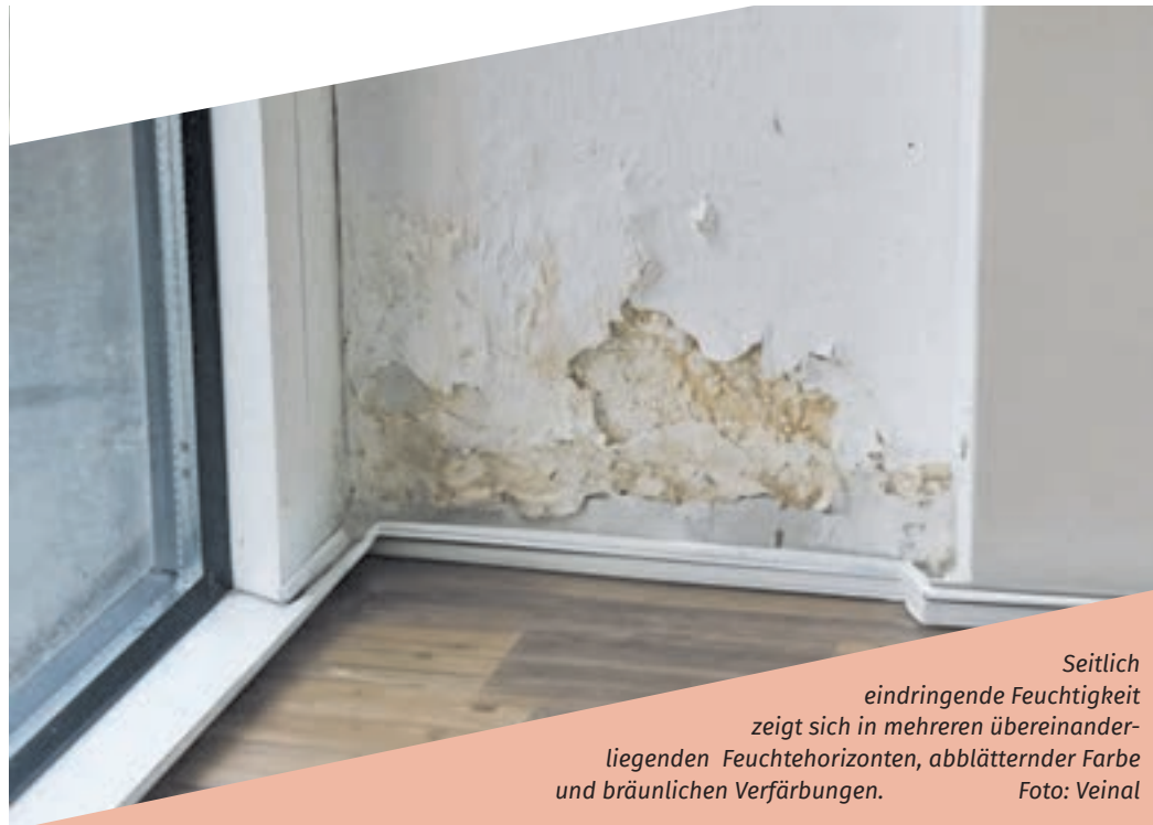
Seitlich eindringende Feuchtigkeit zeigt sich in mehreren übereinander- liegenden Feuchtehorizonten, abblättrender Farbe und bräunlichen Verfärbungen.

(prj). Wenn die Wandfarbe abblättert, der Putz bröckelt oder die Tapete Blasen wirft, wird das gern als Schönheitsfehler abgetan. Doch die betroffenen Stellen nach dem Motto „aus den Augen, aus dem Sinn“ einfach zu überstreichen löst das eigentliche Problem meistens nicht. Häufig liegen die Ursachen nicht an, sondern unter der Oberfläche. Bevor man zu Pinsel oder Kleister greift, ist Ursachenforschung angesagt. Meistens heißt die Diagnose: feuchte Wände. Die Gründe können vielfältig sein, etwa ein unbemerkter Rohrriß. Eine andere mögliche Schadensursache ist seitlich eindringende Feuchtigkeit oberhalb der Horizontalabdichtung im Gründungsbereich, zum Beispiel durch undichte Terrassenanschlüsse oder Terrassentüren.