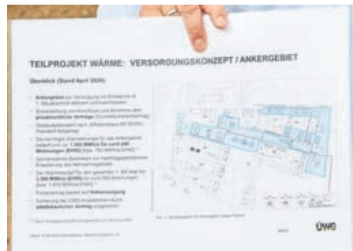
Auch zur geplanten Nahwärmeversorgung in dem entstehenden Baugebiet „Köllsche Gärten“ gab es viele Infos.

Im Anschluss daran informierte der Bürgermeister die Fraktion über die geplante Nahwärmeversorgung in dem entstehenden Baugebiet „Köllsche Gärten“. Diese umweltfreundliche Energieversorgung ist Teil der nachhaltigen Entwicklungspläne der Gemeinde und soll dazu beitragen, den CO 2 -Ausstoß zu reduzieren und die Energieeffizienz zu erhöhen. Das geplante Neubaugebiet hat eine Fläche von 13 Hektar. Dieses Gebiet wird zukünftig rund 1000 neue Bewohnerinnen und Bewohner nach Stockstadt bringen und somit die Gemeinde erheblich vergrößern. Darüber hinaus besteht die Möglichkeit, das Neubaugebiet, um weitere 16 Hektar zu erweitern, was zusätzliche Entwicklungsmöglichkeiten für die Zukunft bietet.