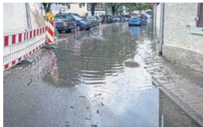
Die Kirchstraße stand teilweise bis zu einem halben Meter unter Wasser.