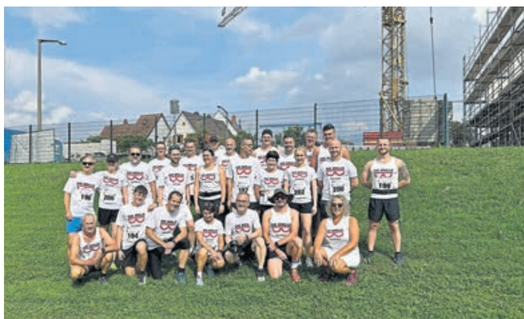
Das Team von „Die Brille“ in Gernsheim war dieses Jahr mit 27 Läuferinnen und Läufern beim Fischerfestlauf vertreten.