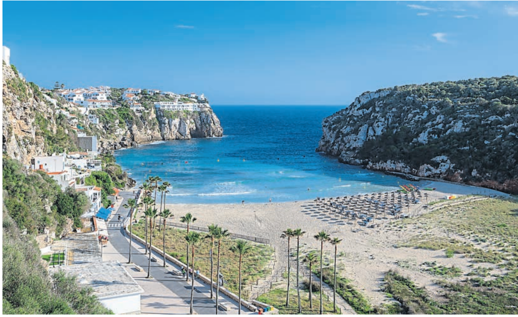
Die traumhafte Aussicht vom Balkon der Unterkunft in Cala en Porter auf Menorca.

Was also tun? Drei Wochen Urlaub lagen vor uns und wir wussten nun nicht mehr, wohin es gehen sollte. Wieder arbeiten zu gehen und später Urlaub zu machen war für uns keine Option. Glücklicherweise entschieden wir uns recht schnell für Mallorca, da wir uns dort aufgrund der letzten Reise auskannten (wir berichteten) und die