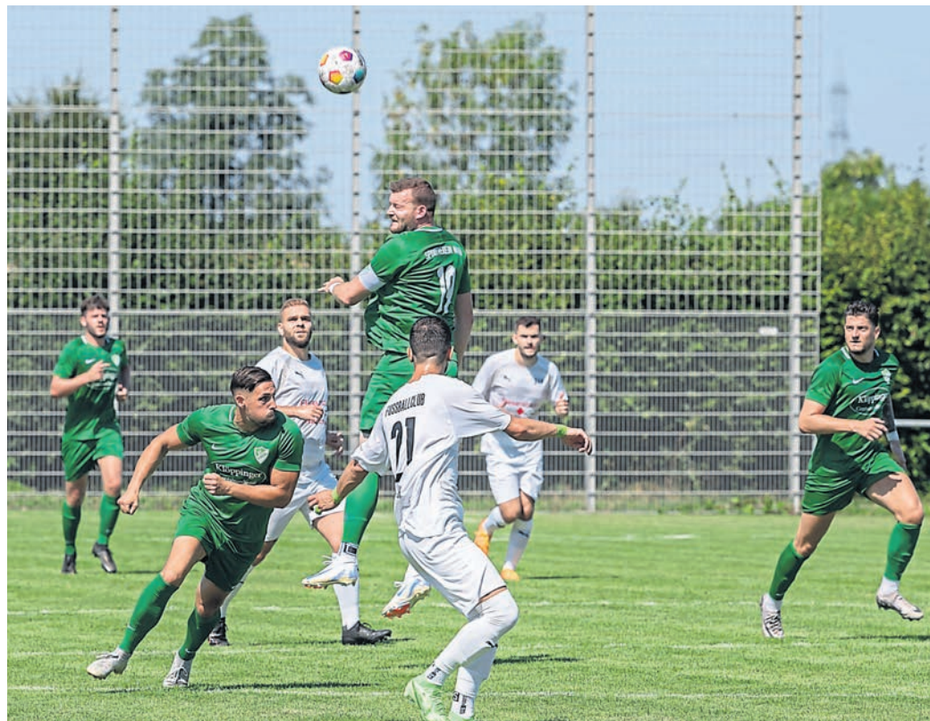
Bei brütender Hitze reichte es für den SV Hahn gegen den FC Alsbach am Ende für den ersten Punkt in der Gruppenliga Darmstadt.