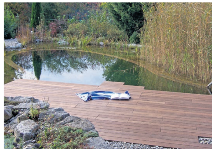
Die sogenannte Bewitterung über mehrere Monate macht das Holz besonders langlebig und resistent gegen äußere Einflüsse.

(djd-k). Der klimatische Wandel verändert auch die Forstwirtschaft. Heimische Baumarten wie Birke, Feldahorn oder Weißtanne dürften in Zukunft aufgrund ihrer guten Anpassungsfähigkeit an Bedeutung gewinnen. Damit sie auch im Außenbereich verbaut werden können und bezüglich ihrer Langlebigkeit und Robustheit mit Tropenhölzern vergleichbar sind, nutzen Hersteller wie „Swero“ spezielle Verfahren zur Veredelung. Bei einer Thermobehandlung, die zum Beispiel in Skandinavien seit langem üblich ist, erhält das Holz durch Temperaturen von bis zu 225 Grad Celsius eine wesentlich stärkere Widerstandskraft – ganz ohne Zusätze oder Chemikalien.