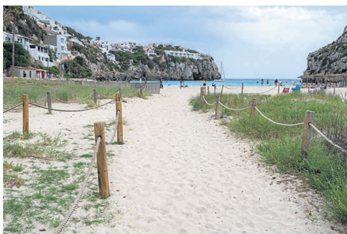
Links: Der Zugang zum Strand in Cala en Porter. Glasklares Wasser und feiner Sand laden zum Entspannen ein. Rechts: Der historische Hafen von Ciutadella.

überblicken. Besser konnte der Urlaub nicht beginnen. Wir stellten uns die Frage, ob wir die Wohnung überhaupt verlassen wollen, so schön gelegen war sie. Natürlich machten wir das nicht, so dass ab dem folgenden Tag die Erkundung der Insel anstehen sollte. Einen kleinen Haken hatte die Sache aber doch: Ich erwähnte zu Beginn bereits die sieben Stufen, die uns zur Unterkunft führten. Bereits in der Beschreibung wurde darauf hingewiesen und nach unten war das sicherlich auch alles kein Problem. Da die Treppe aber in den Felsen gehauen war, war jede Stufe unterschiedlich. Dies erschwerte den Aufstieg natürlich erheblich und mit dem Gedanken an die Abreise und dem damit verbundenen Schleppen von Gepäck erhielt die Treppe im Laufe der Zeit den liebevollen Spitznamen „Endgegner“. Wir verstaute noch unser Gepäck, richteten uns ein und genossen noch eine Weile die wunderschöne Aussicht, bevor wir überglücklich ins Bett fielen. Bereits am nächsten Tag sollte unsere Erkundungstour quer über die Insel beginnen.