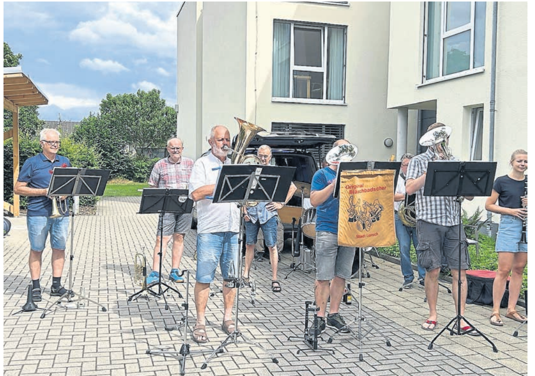
Lorsch (red). Wie das Lorsch Johanniter-Haus berichtet, waren kürzlich die „Original Bläschbadscher“ für ein Platzkonzert zu Gast. Zahlreiche Bewohnerinnen und Bewohnende, Mieterinnen und Mieter sowie Gäste nahmen an der Veranstaltung teil.