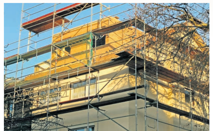
Durch eine Dachaufstockung in Holzbauweise können mehrgeschossige Wohnhäuser zusätzliche Wohnfläche bekommen. Im Bild ein Beispiel aus der früheren Bundeshauptstadt Bonn.

eines mehrgeschossigen Gebäudes vornehmen als mit anderen Materialien. Eine groß angelegte Studie der TU Darmstadt hatte erge-