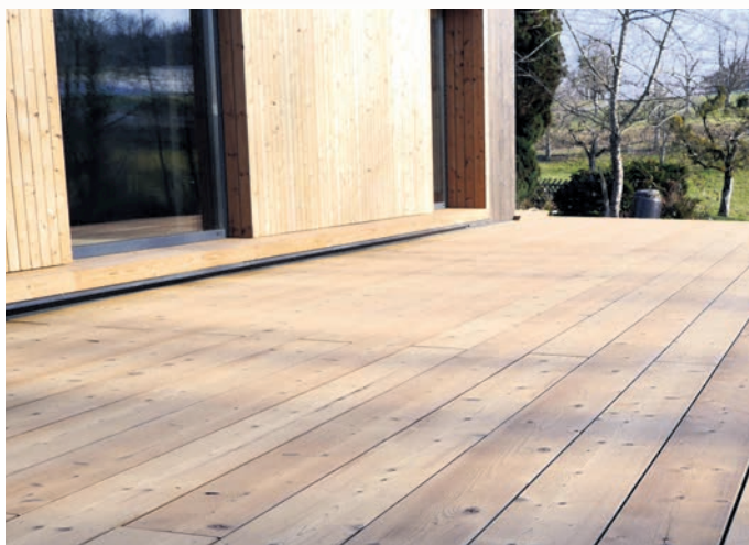
Nach der Thermobehandlung behalten die Holzdielen dauerhaft ihre Form und Robustheit.

wird die Resistenzklasse 1 erreicht: Demnach ist das Holz äußerst widerstandsfähig auch gegenüber Feuchtigkeit, Pilzen und Insekten. Dies erhöht die Lebensdauer der Fassadenverkleidung erheblich. Ganz ohne Chemie oder andere Zusätze wird reines Holz somit zum robusten Baumaterial für den Außenbereich. Zusätzlich zur attraktiven, wohnlichen Optik fördern Hauseigentümer auf diese Weise die regionale Forstwirtschaft und tragen zum Erhalt der Wälder bei. djd