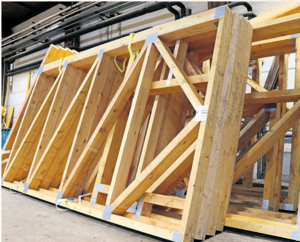
Die Holzmodule aus zertifiziertem Holz lassen sich nicht nur einfach einsetzen, sie sind zudem verhältnismäßig leicht.

Schätzungen zufolge sind Bauaktivitäten für etwa 35 Prozent des weltweiten Energieverbrauchs und der globalen Emissionen verantwortlich. Damit auch in