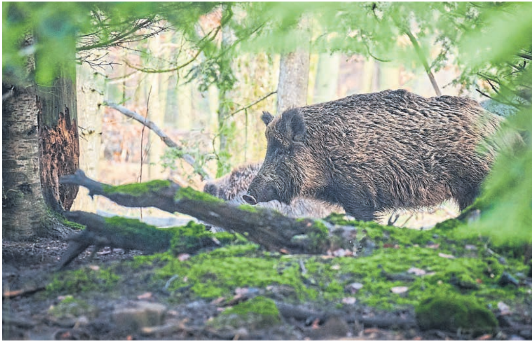
Die Afrikanische Schweinepest (ASP) breitet sich in Südhessen und Baden-Württemberg weiter aus.

Kreise in der Region reagieren auf Ausbreitung der ASP