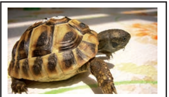
Griech. Landschildkröten Nachzuchten mit Papieren. ☎ 06155-604300