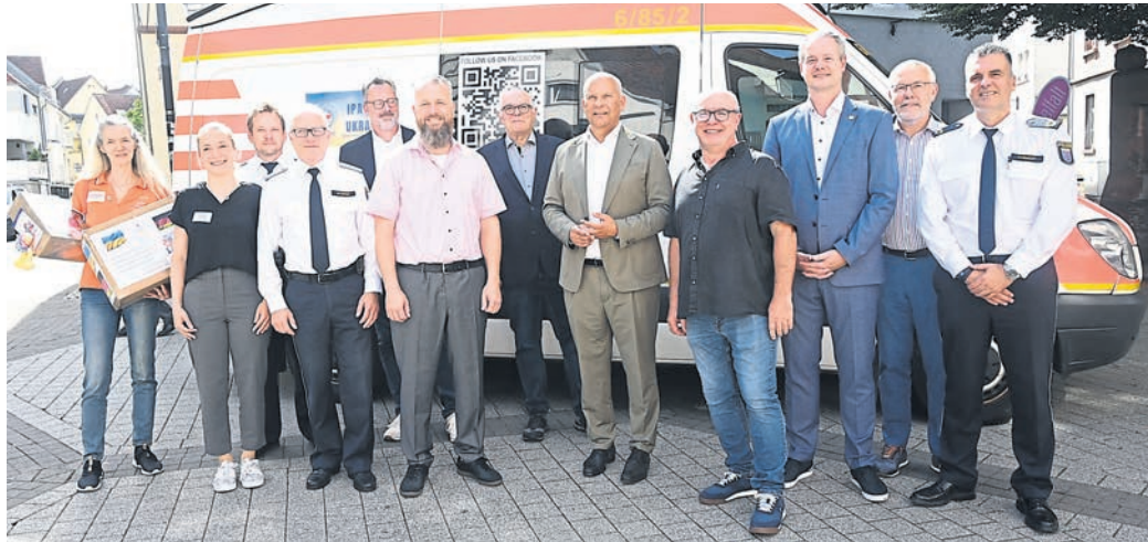
Freut sich mit den IPA-Mitgliedern: Der hessische Innenminister Roman Poseck (Fünfter von rechts).

Gemäß dem Leitspruch „Dienen durch Freundschaft“ sind nun die beiden Vorstandsmitglieder und Polizeibeamten Josef Simon und David Weise mit einem außer Dienst gestellten Rettungswagen des Deutschen Roten Kreuzes des Odenwaldkreises zu einer rund 1800 Kilometer langen