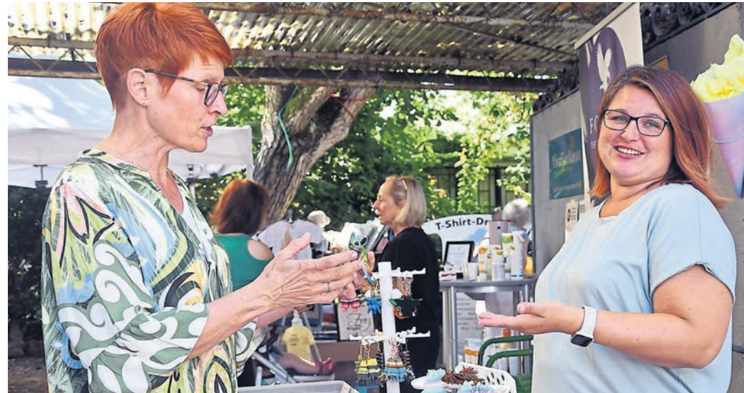
Stöbern, shoppen und genießen war angesagt bei der diesjährigen Ausgabe des Hofmarkts der Unternehmerinnen.

Zweiter Hofmarkt der Griesheimer Unternehmerinnen