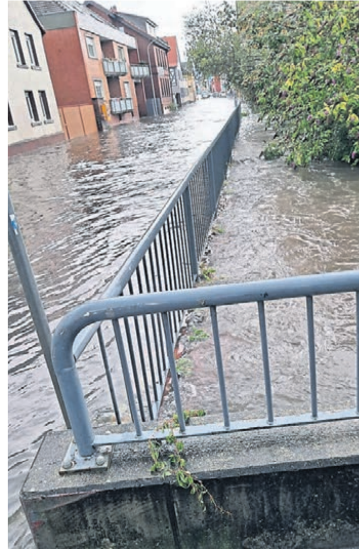
Jede Menge Wasser: Der Pegel der Modau stieg durch den heftigen Regen stark an.

Eine weitere Anwohnerin berichtete davon, dass auch die Modau nahe des historischen Rathauses über die