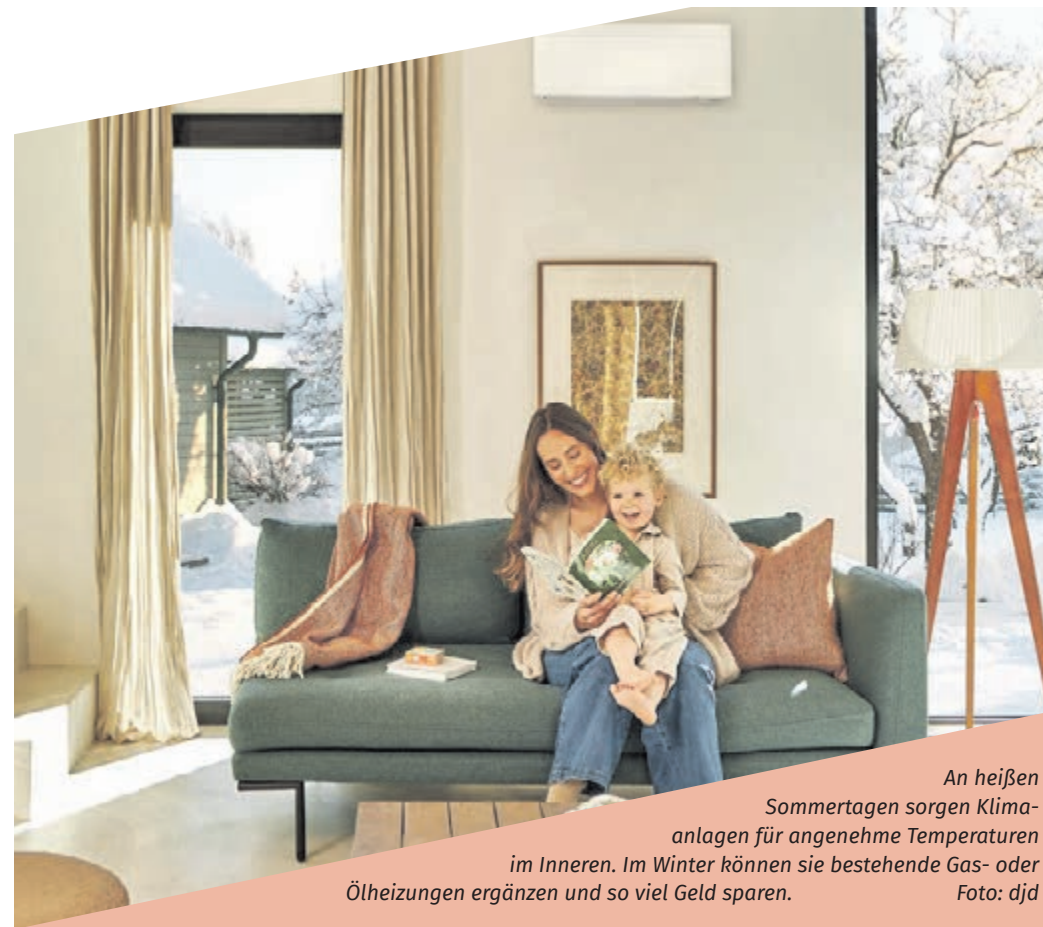
An heißen Sommertagen sorgen Klimaanlage für angenehme Temperaturen im Inneren. Im Winter können sie bestehende Gas- oder Ölheizungen ergänzen und so viel Geld sparen.

Warum sich auch das Heizen mit Klimaanlage lohnen kann