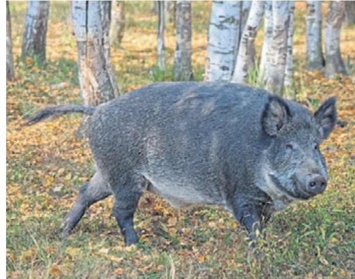
Die afrikanische Schweinepest ist in Südhessen weiter auf dem Vormarsch.

Zudem hat der Kreis Darmstadt-Dieburg seine Allgemeinverfügung zur Afrikanischen Schweinepest (ASP) aktualisiert. Die Allgemeinverfügung ist die Rechtsgrundlage, die neben der Festlegung der Sperrzone(n), auch die gültigen Restriktionen bezüglich der Öffentlichkeit, der Jägerschaft und der Landwirtschaft regelt.