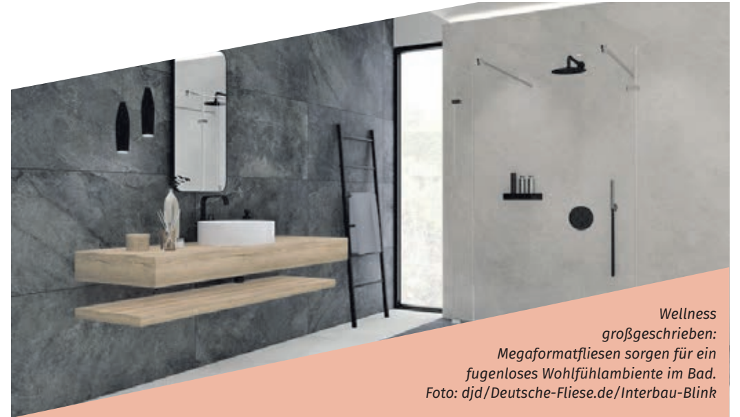
Wellness großgeschrieben: Megaformatfliesen sorgen für ein fugenloses Wohlfühlambiente im Bad.

(djd). Big is beautiful: Großformatige Fliesen liegen schon länger im Trend. Neu sind die sogenannten Megaformate mit Kantenlängen bis zu 1,20 x 2,60 Metern. Solche Fliesen erlauben es, Wand- und Bodenflächen ebenso harmonisch wie hochwertig zu gestalten – sei es im Bad oder in anderen Wohnbereichen. So kann eine einzige Fliese die gesamte Wandfläche einer Dusche bekleiden – Stichwort: das fast fugenlose Bad mit Fliesen. Zugleich weiten die imposanten Fliesen Flächen und damit den ganzen Raum optisch. Angenehmer Nebeneffekt: Der geringe Fugenanteil erhöht den von Haus aus hohen Reinigungskomfort von Fliesen zusätzlich.