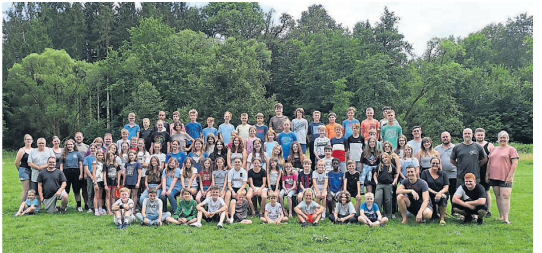
Der SVS veranstaltete unlängst ein großes Zeltlager mit 80 Teilnehmenden im Westerwald.

Cheerleading-Workshop ließen tagsüber keine Zeit für Langeweile“, heißt es in der Meldung. Großer Beliebtheit habe sich beim Nachwuchs die Nachtwache erfreut, ebenso das Schneiden an der Lagerfeuerstelle. Nachts ging es unter anderem auf Wanderschaft zu einem alten Bergwerk. Zum Abschluss des Aufenthalts wurde eine Lagerdisko gefeiert.