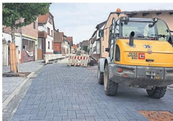
Die Stadt Griesheim zeigt sich mit dem Baufortschritt in der Pfützenstraße zufrieden.