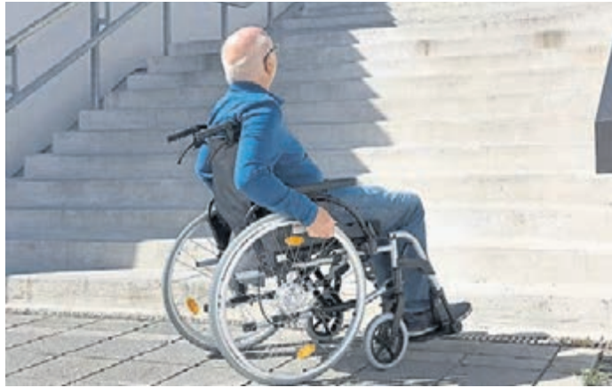
Treppen sind für Rollstuhlfahrerinnen und -fahrer ein schier unüberbrückbares Hindernis. Auch in der eigenen Wohnung. Hier berät der VdK Griesheim Menschen dabei, ihr Zuhause möglichst barrierefrei zu planen und zu realisieren.

Griesheim (red). Jeder Mensch kann von heute auf morgen von einer Erkrankung oder externen Behinderung betroffen sein – plötzlich ist das Verlassen der Wohnung schwierig ebenso wie Autofahren oder das Zurechtfinden in der Umgebung. Wie der VdK Ortsverband Griesheim in einer Meldung mitteilt, kann man sich bei der Umgestaltung von Wohnräumen bis hin zur Barrierefreiheit und der Verwirklichung von Barrierefreiheit im öffentlichen Raum von der Fachstelle für Barrierefreiheit oder den ehrenamtlichen Wohn- und Fachberaterinnen und -beratern unterstützen lassen. „Ziel ist es, allen Menschen größtmögliche Selbstbestimmung und Un-