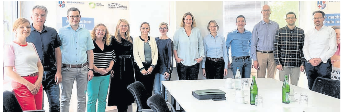
Die Teilnehmenden des jüngsten Fachaustauschs zur nachhaltigen Kreislaufwirtschaft im Bausektor

Kreis Bergstraße (red). Im Rahmen des europäischen Interreg-Projekts „Karma“ fand kürzlich ein regionales Treffen im Kreis Bergstraße statt, bei dem Expertinnen und Experten aus Wissenschaft, Wirtschaft und öffentlicher Hand neue Ansätze für zirkuläres Bauen diskutierten. „Die Bedeutung dieses Themas für den Klima- und Ressourcenschutz ist beträchtlich: Der Bausektor ist für etwa 54 Prozent des jährlichen deutschen Abfallaufkommens und 40 Prozent des globalen CO 2 -Ausstoßes verantwortlich“, erklärt der Kreis Bergstraße in einer Pressemitteilung. Baumaterialien sollen daher so lange und intensiv wie möglich genutzt und im Kreislauf behalten werden. Dazu ist ein Mitdenken ihrer Umnutzung, Wiederverwendung oder Verwertung von Beginn an notwendig. Gleichzeitig berge die Nutzung von sekundären Baumaterialien großes Potenzial für die Bauwirtschaft. Das Karma-Projekt, an dem sieben Partner aus fünf europäischen Ländern beteiligt sind, zielt darauf ab, zirkuläre Ansätze in den Bereichen Abfall-, Recy-