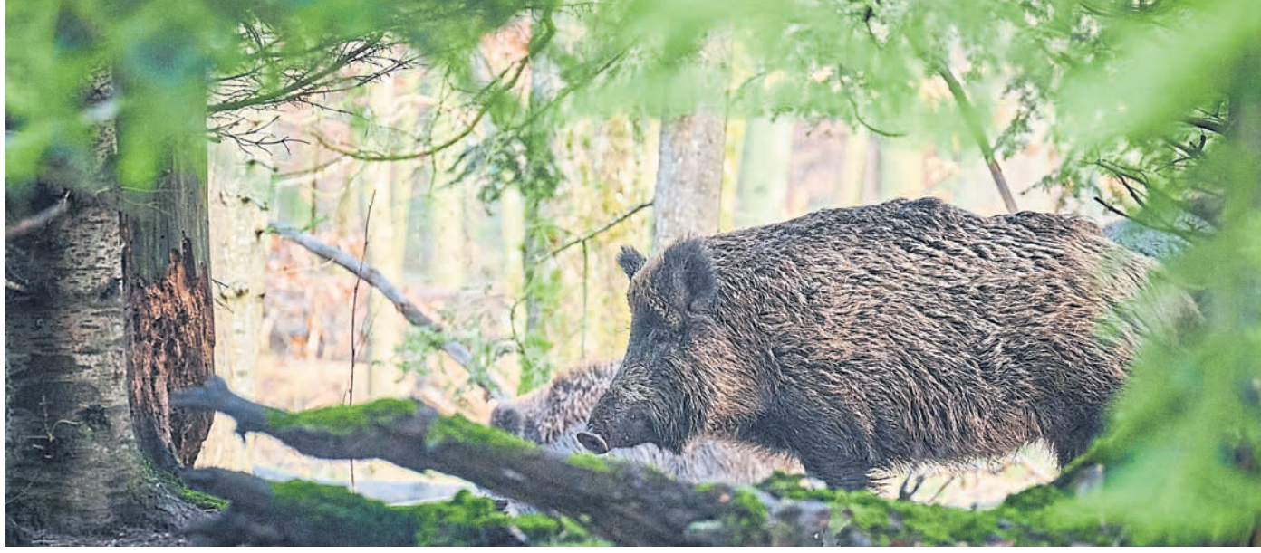
Die Afrikanische Schweinepest (ASP) breitet sich in Südhessen und Baden-Württemberg weiter aus.