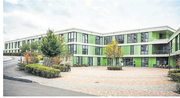
Das Zentrum für Seelische Gesundheit der Kreiskliniken Darmstadt-Dieburg am Standort Groß-Umstadt bietet rund um die Uhr eine psychiatrische Notfallversorgung an. Über das Zentrum ist kürzlich eine Doku-Reihe in der ARD erschienen.