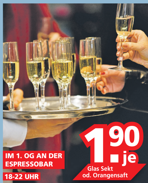
IM 1. OG AN DER ESPRESSO BAR 18-22 UHR