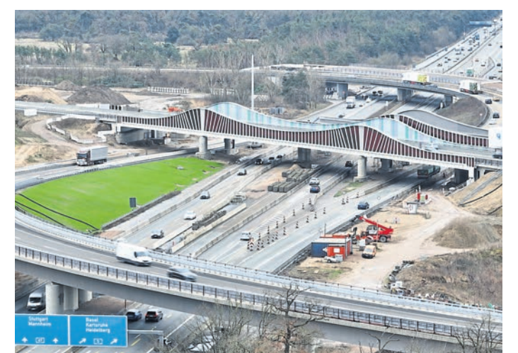
Aufgrund von Instandhaltungsmaßnahmen entfällt von Samstag auf Sonntag die Einfahrtmöglichkeit über die A672 auf die B26 nach Darmstadt. Das Foto zeigt die neue Brücke am Darmstädter Kreuz.

stadt (26) auf die B3 Richtung Darmstadt geleitet. Der Verkehrsstrom von Nord nach Süd wird an der AS Weiterstadt (25) auf die B42 Richtung Darmstadt geleitet. Auf der A67 wird der Verkehr von Süden an der AS Pfungstadt (7) auf die B426 geleitet. Dieser Verkehrsführung sei bis zum Knotenpunkt Pfungstädter Straße (B426) und Karlsruher Straße (B3) zu folgen. Der Verkehr aus der nördlichen Richtung werde an der AS Büttelborn (5) auf die B42 geleitet, der wiederum bis Darmstadt zu folgen sei.