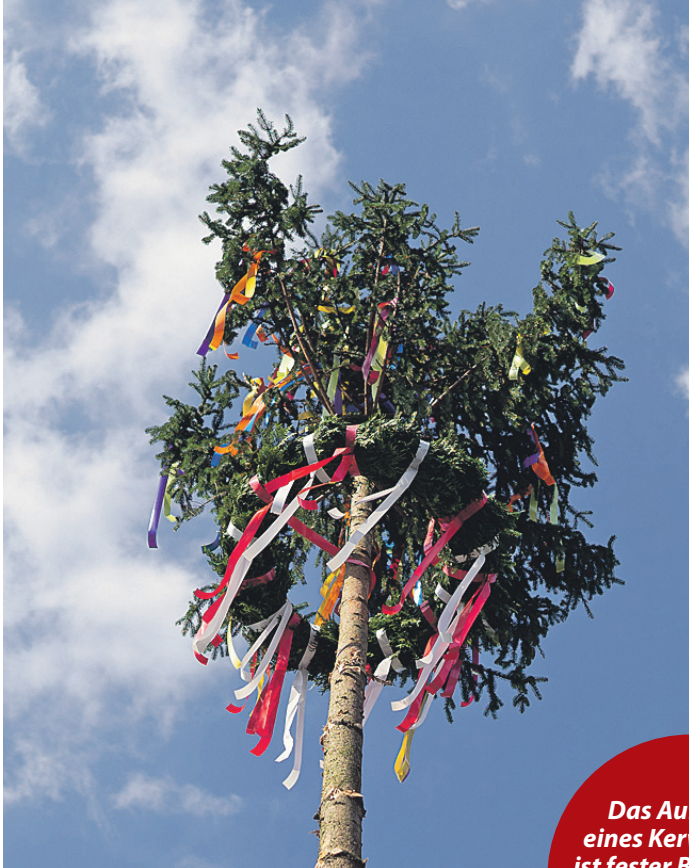
Das Aufstellen eines Kerwebaums ist fester Bestandteil der Juremer Kerwe-tradition.

Die Jugendlicher laden zur 39. Kerb mit vielen Veranstaltungen ein