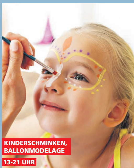
KINDERSCHMINKEN, BALLONMODELAGE 13-21 UHR