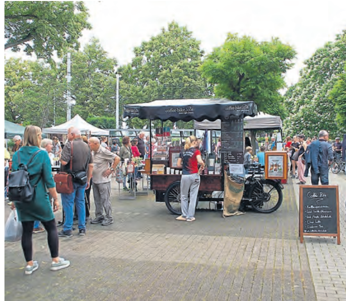
Am 15. August findet wieder der Seeheimer Feierabendmarkt statt.

Besuchende werden gebeten, möglichst zu Fuß, mit dem Rad oder mit den öffentlichen Verkehrsmitteln zur Veranstaltung zu kommen, da die Zahl der Parkplätze vor Ort beschränkt ist. Wer das Auto nutzen muss, kann die Parkplätze hinter dem Rathaus sowie am Friedhof nur über die Bergstraße und dann die Straße „Hinter der Kirche“ erreichen, da der Georg-Kaiser-Platz in Höhe der Einfahrt zur Tiefgarage am Verwaltungsgebäude bei der Veranstaltung aus Sicherheitsgründen vollgesperrt ist. Der nächste Feierabendmarkt findet dann am 19. September statt.