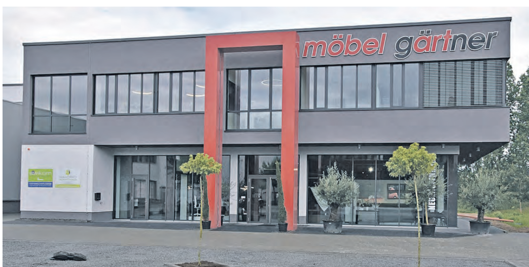
Im Möbelhaus Gärtner gibt es Service, Planung und Ausführung aus einer Hand. So wird das Besondere selbstverständlich.

liches Können und die Fachkenntnis im Einsatz und Umgang mit Materialien, ob Holz, Stein, Glas oder Metall sind sozusagen die Basis. Darüber hinaus zeichnet das Möbelhaus Gärtner aus, auf individuelle Wünsche einzugehen. Hinzu kommen die persönliche Beratung und die Fähigkeit, dann auch nach Maß einrichten zu können. Im Möbelhaus Gärtner gibt es Service, Planung und Ausführung aus einer Hand. So wird das Besondere selbstverständlich. „Ihre Wohnung und Einrichtung soll zu Ihnen passen wie Ihre Kleidung. Manchmal leger und bequem, manchmal repräsentativ. Auf jeden Fall: Nach Ihrem Geschmack“, sagt der erfahrene Planer. Individuelles