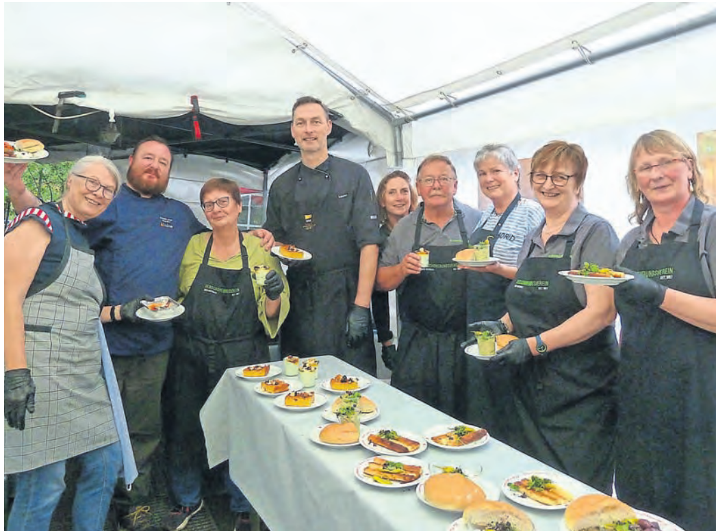
Ober-Beerbach (red). Ein „Griechischer Abend“ erwartete kürzlich die Gäste des diesjährigen Sommerfests des Verschönerungsvereins Ober-Beerbach (VV). Seit einigen Jahren stehen die Sommerfeste in dem Seeheim-Jugenheimer Ortsteil unter dem Motto einer kulinarischen Weltreise. Nachdem in den letzten Jahren Köstlichkeiten aus Spanien und Italien angeboten worden waren, war diesmal Griechenland an der Reihe. „Wir möchten unseren Gästen gerne etwas Besonderes bieten, weg von der klassischen Bratwurst und dem Steak“, berichtet der Verschönerungsverein Ober-Beerbach in einer Mitteilung an die Presse. So standen unter anderem ein Grillteller, gefüllte Pita-Taschen sowie gebackener Schafskäse auf der Speisekarte. Wie der Verein berichtet, nahmen rund 200 Gäste an der Veranstaltung teil. Im Bild sind die Vereinsmitglieder und Köche Lou Hahn (Zweiter von links) und Sirko Rösner (Vierter von links) sowie weitere aktive Helfende zu sehen.

Sommerfest des Verschönerungsvereins Ober-Beerbach