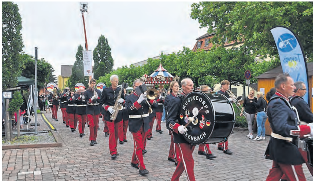
Bickenbach (cf). Das Musikcorps Bickenbach (MCB) plant für das kommende Jahr wieder ein neues Tattoo. Die Musiker und Musikerinnen seien bereits in der Phase der Proben und haben in Sommer und Herbst noch einige Auftritte sowohl in der Region wie auch überregional in ihrem Veranstaltungskalender stehen. Wie auch schon bei der vergangenen Veranstaltung haben die Aktiven des MCB geplant, dass Tattoo wieder in der Weststadthalle in Bensheim stattfinden zu lassen. Die Show- und Marchingband hat Bickenbach und die Region schon mehrfach im Ausland vertreten. Unter anderem auch bei der Steubenparade in New York. Ein Highlight sei die Teilnahme an der Eröffnungszereemonie des Shanghai-Tourism-Festival (CHN) in China gewesen. In 2006 organisierte das MCB sein erstes eigenes Tattoo.

Musikcorps Bickenbach bereitet Veranstaltung vor