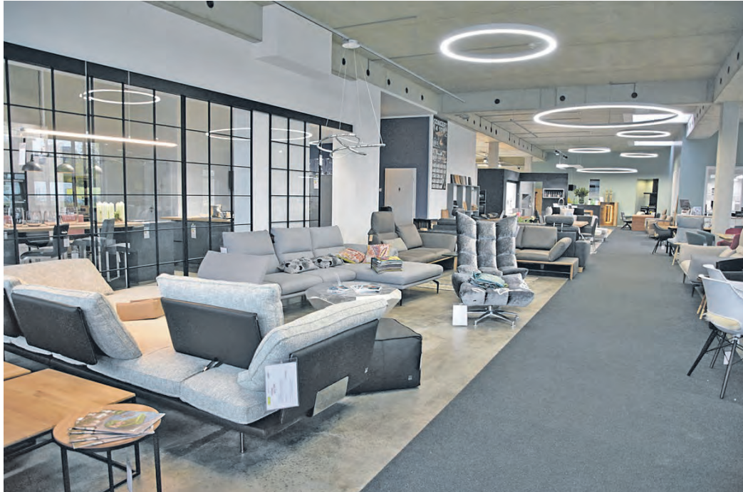
Das Möbelhaus Gärtner lenkt mit seinem auf Wesentliche reduzierten Industriestyle im Innern den Blick auf das Eigentliche: Den Traum vom schönen Wohnen.