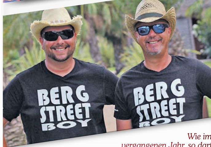
Wie im vergangenen Jahr, so darf sich das Seeheimer Party-Publikum auch 2024 zur Kerb wieder auf stimmungsvolle Party Nächte freuen. Für Musik sorgen auf der Seeheimer Kerb unter anderem die allseits bekannten und beliebten Bergstreetboys.