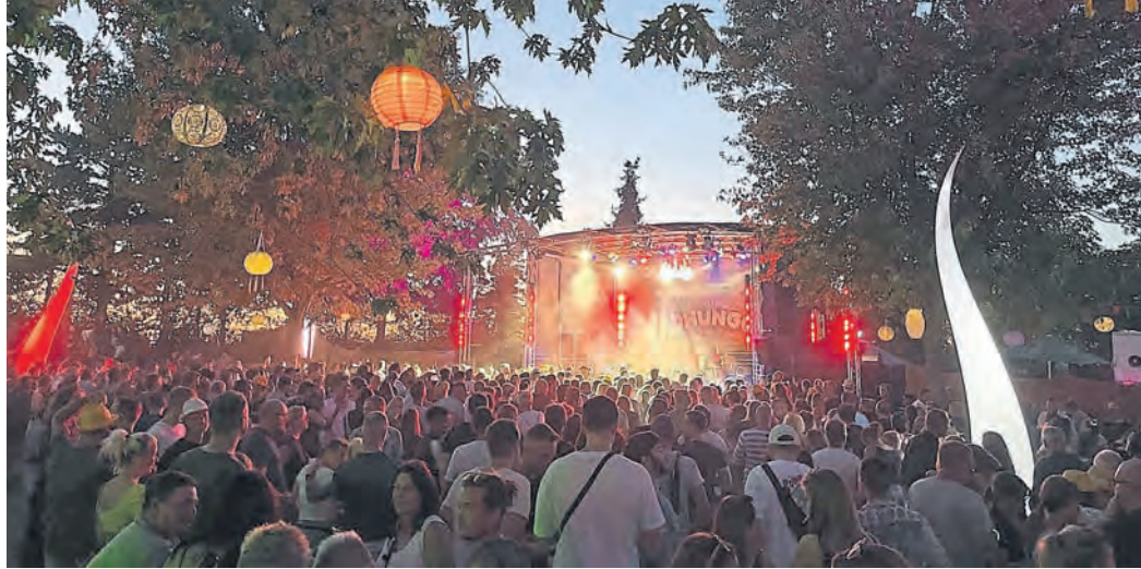
Zum achten Phungo-Festival in der Dr.-Horst-Schmidt-Straße 12 in Pfungstadt lädt die Agentur Showmaker vom 8. bis zum 18. August ein. Das Festival ist kostenlos und täglich warten viele Showacts und Mitmachaktionen auf die Gäste

Bereits zum achten Mal findet das kostenlose „Phungo“-Festival in Pfungstadt statt und ist beliebter Treffpunkt für Jung und Alt. Zur Finanzierung trägt der einmalige Kauf des „Kulturbechers“ bei, der für jeden weiteren Drink einfach ausgetauscht wird.