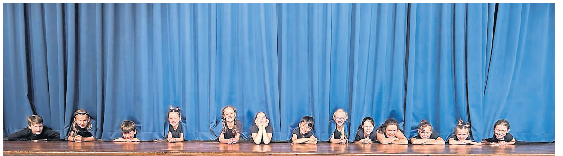
„Vorhang auf!“ heißt das neue Theaterprojekt der Kinder- und Jugendförderung Bickenbach, erstes Stück war das selbst verfasste „Einladung zum Träumen“

Hans-Quick-Schule, vor denen das Stück am letzten Schultag im voll besetzten Bürgerhaus noch einmal aufgeführt wurde, so die Organisierenden. Die jungen Schauspielerinnen und Schauspieler wollen nun an neuen Ideen und Stücken arbeiten, nach eigener Aussage weiterhin unterstützt von der Kinder- und Jugendförderung der Gemeinde Bickenbach.