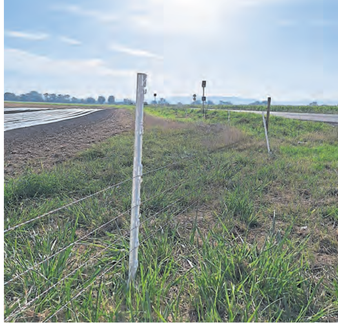
Sogenannte „taktische Elektrozaune“ entlang von Feld, Flur und Straße sollen eine Bewegung möglicherweise infizierter Wildschweine eindämmen.

Südhessen (mw). Die Afrikanische Schweinepest (ASP) hält den südlichen Landesteil Hessens weiterhin in Atem. Jüngster Fall bei Drucklegung ist das erste im Landkreis Darmstadt-Dieburg positiv auf die Afrikanische Schweinepest (ASP) getestete Wildschwein, das in Pfungstadt im Stadtteil Eschollbrücken gefunden wurde. „Um eine sichere und hygienische Entsorgung zu gewährleisten, wurde das gefundene Tier bereits zur Kadaversammelstelle gebracht. Ob die bisherigen Sperrzonen ausgeweitet werden, wird im Moment durch die Kreisverwaltung geprüft“, teilt der Kreis Darmstadt-Dieburg in einer Meldung mit. Des Weiteren gab es einen Ausbruch der Tierseuche in einem landwirtschaftlichen Betrieb in Trebur. Dort müssen nun 1800 Schweine getötet werden, wofür laut Groß-Gerauer Kreisverwaltung ein auf tierschutzgerechte Keulung spezialisiertes Unternehmen beauftragt wurde. Stand Donnerstag, 1. August, ist es der achte betroffene Betrieb im Kreis Groß-Gerau. Der logistische Aufwand rund um die Tötung der Tiere machte sogar eine Straßensperrung der L3094 zwischen Wallerstädter und Geinsheim von Mittwoch bis Freitag notwendig, wovon auch die Zufahrt zur Rheinfähre Kornsand betroffen war.