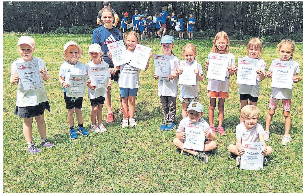
Der Waldsportplatz am Frankenstein bot beste Bedingungen für den TSV-Nachwuchs. Für viele war es der allererste Wettkampf überhaupt.

Pfungstadt (red). Der Tierschutzverein Pfungstadt lädt für Sonntag, 7. Juli, von 10 bis 16 Uhr zum „Sommerzauber“ auf dem Freilaufgelände des Tierheims, Außerhalb 80, ein. Es gibt laut Pressemitteilung einen bunten Markt mit kreativen und informativen Ständen, zudem ist die Tierboutique geöffnet. Für das leibliche Wohl ist ebenfalls gesorgt, verträgliche Vierbeiner sind ebenfalls willkommen.