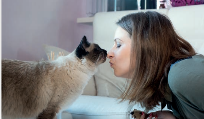
Die Katze will ihren Menschen mit Markieren nicht ärgern, sie drückt damit nur ihre innere Anspannung und Stress aus.

Was ist also passiert, damit ein so reinliches Tier wie die Katze unsauber wird? Bestehen keine medizinischen Ursachen, wie zum Beispiel ein Harnwegsinfekt, ist Unsauberkeit häufig ein Zeichen von Stress. Dieser wird zum Beispiel durch eine neue Katze oder ein anderes Haustier, einen Umzug, einen neuen Lebenspartner oder die Ankunft eines Babys verursacht.