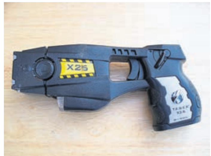
Die hessische Polizei wird derzeit verstärkt mit sogenannten Distanzelektroimpulsgeräten, auch Taser genannt, ausgerüstet.

Hessen (ps). Der hessische Innenminister Roman Poseck hat kürzlich angekündigt, dass die Zahl der Taser für die hessische Polizei bis in den Sommer mehr als verdreifacht werden soll. Laut einer Mitteilung des hessischen Innenministeriums an die Presse werden den Polizistinnen und Polizisten im Land damit 190 Geräte zur Verfügung stehen, während es ein Jahr zuvor noch 60 gewesen seien. Ziel sei es, die Geräte flächendeckend der Polizei zur Verfügung zu stellen. Distanzelektroimpulsgeräte (DEIG), auch Taser genannt, könnten als Alternative zur Schusswaffe eingesetzt werden und dabei zugleich auf das Gegenüber abbremsend wirken. Poseck begründet diesen Schritt mit einer wachsenden Zahl von Angriffen auf Polizeikräfte. Im vergangenen Jahr seien 5056 Polizistinnen und Polizisten als Opfer registriert worden – im Vergleich zum Vorjahr ein Plus von 7,3 Prozent und ein „trauriger Höchstwert“, so Poseck. „Wir dürfen nicht zulassen, dass diejenigen angegriffen werden, die unseren Rechts-