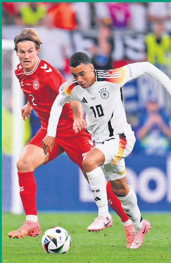
Jamal Musiala (hier verfolgt von Gegenspieler Joachim Andersen) stellte mit seinem Tor zum 2:0 gegen Dänemark die Weichen für die Deutsche Nationalmannschaft auf Sieg.