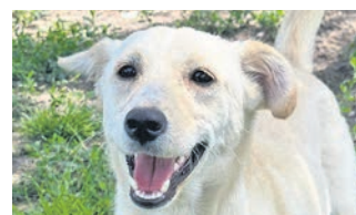
Lucy, 8 M., 40 cm, 10 kg, ist lieb und offen, kommt auch gut mit Kindern und anderen Hunden klar. Lucy möchte natürlich noch viel lernen. Sie ist geimpft, gechippt und kastriert. Hoffungsvolle Tierblicke e.V., ☎ 06068 / 4785493 o. 0162 / 2939838, www.htb-ev.de