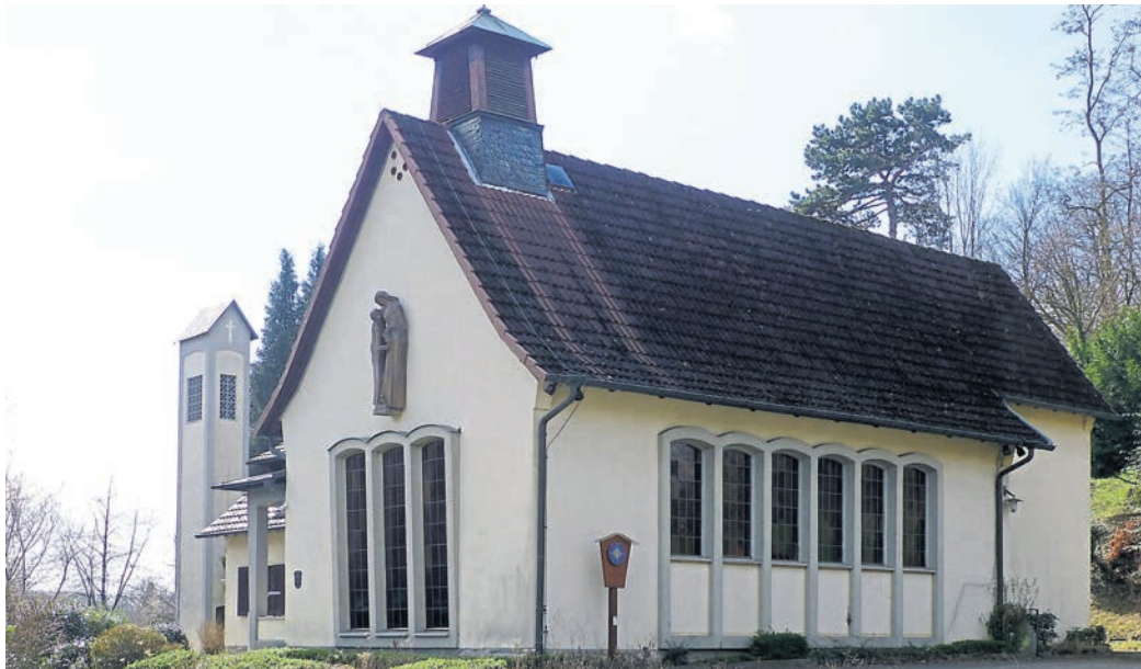
Die katholische Kirche St. Elisabeth in Schönberg wurde 2019 entsakralisiert. Ein Verein katholischer Gläubiger aber führt dort inzwischen wieder Gottesdienste durch und setzt sich in einer Petition für die Rückkehr der entfernten Glocken nach Schönberg ein.