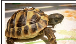
Griech. Landschildkröten Nachzuchten mit Papieren. ☎ 06155-604300