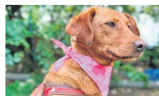
Summer, 2 J., 47 cm, 17 kg, ist eine liebe, freundliche Hündin, sie mag Menschen, Hunde und auch eine Katze kann in ihrer neuen Familie sein. Sie ist geimpft, gechippt und kastriert. Hoffungsvolle Tierblicke e.V., ☎ 06068 / 4785493 o. 0162 / 2939838, www.htb-ev.de