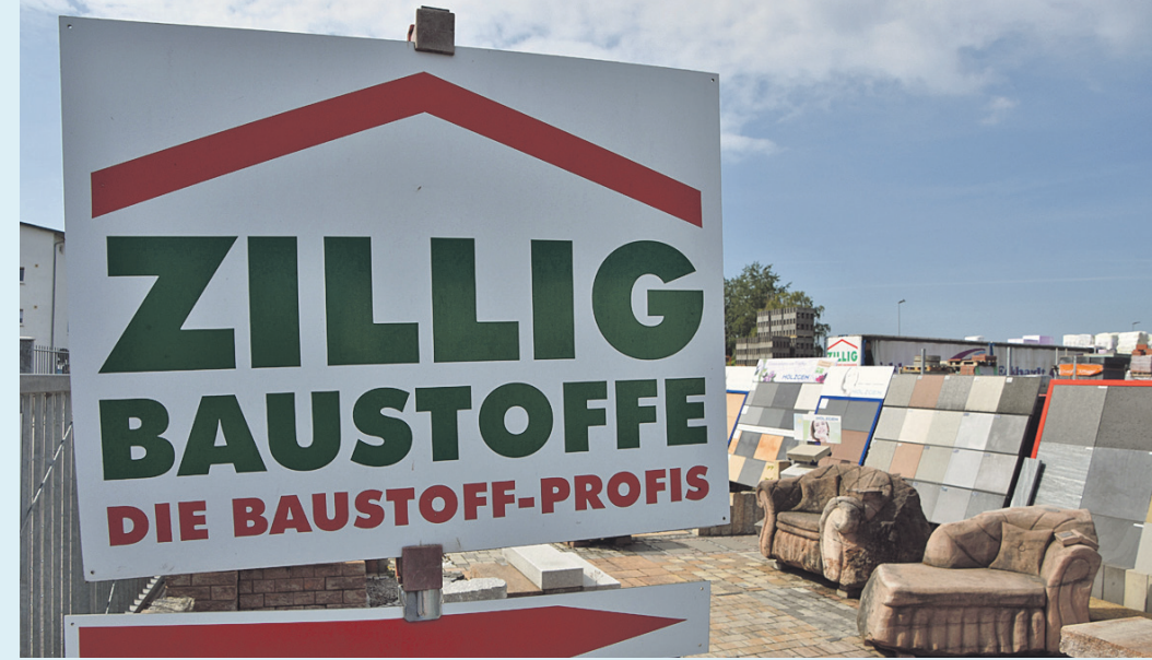
Auf dem Firmengelände der Firma Zillig in der Schillerstraße in Bensheim finden die Kunden eine große Auswahl an Baustoffen für Innen- und Außenbereiche.