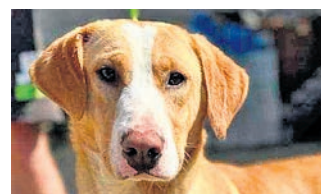
Benji, 2 J., 45 cm, 17 kg, ist ein freundlicher Hund, verträglich mit Hunden sowie Katzen und wäre in einer Familie mit größeren Kindern gut aufgehoben. Er ist geimpft, gechippt und kastriert. Hoffungsvolle Tierblicke e.V., ☎ 06068 / 4785493 o. 0162 / 2939838, www.htb-ev.de