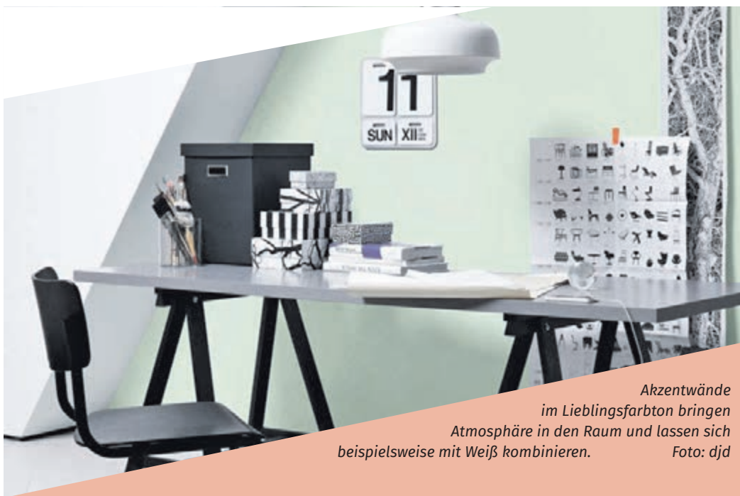
Akzentwände im Lieblingsfarbton bringen Atmosphäre in den Raum und lassen sich beispielsweise mit Weiß kombinieren. Foto: djd

ren Wände werden hingegen weiß oder in einem dezenten Cremeton gehalten. Bei der Suche nach dem persönlichen Favoriten aus Hunderten unterschiedlicher Farbtöne werden Selbstermacher beispielsweise in örtlichen Bau- oder Fachmärkten mit einem Schönen Wohnen-Farbstudio fündig. Mit kostenlosen Farbkarten findet man hier Inspirationen, kann vergleichen und vor Ort exakt den eigenen Lieblingston mischen lassen – für innen, für außen, als Dispersionsfarbe oder als Lack.