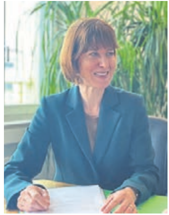
Sozialministerin Heike Hofmann (SPD).

„Die hohe Zustimmung durch alle Reihen des Hohen