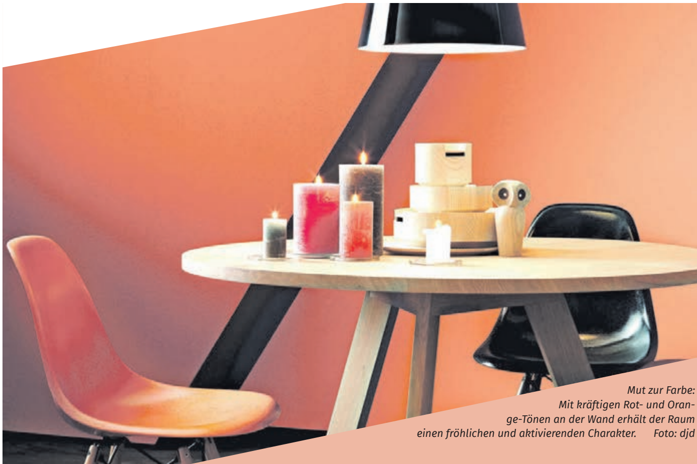
Mut zur Farbe: Mit kräftigen Rot- und Orange-Tönen an der Wand erhält der Raum einen fröhlichen und aktivierenden Charakter.

So sorgen in Küche und Wohnbereich etwa helle Farben wie Orange oder Sonnen-gelb für positive Stimmung. Im Schlafzimmer sorgen ein beruhigendes Blau oder ein dunkles Anthrazit für eine entspannte Atmosphäre und ein Gefühl der Behaglichkeit. Wichtig für die Farbwahl ist auch der Grundriss und die Größe des Zimmers. So können beispielsweise Hellblau oder ein klassisches Weiß kleinere Zimmer optisch weiten und für eine ruhige, klare Atmosphäre sorgen. Generell empfiehlt es sich, bei den Wandfarben zu kombinieren, um es mit der Wirkung nicht zu übertreiben: Statt das ganze Zimmer in einem knalligen Rot zu streichen, erhält lediglich eine Akzentwand den anregenden und feurigen Ton – die weite-