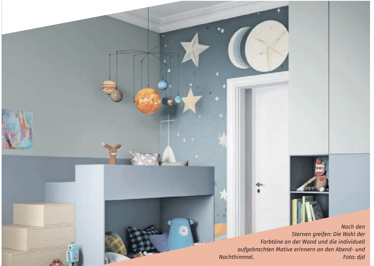
Nach den Sternengreifen: Die Wahl der Farbtöne an der Wand und die individuell aufgetragenen Motive erinnern an den Abend- und Nachthimmel.

Am Anfang steht dabei stets die Auswahl der Farbtöne. Bunte und lebendig wirkende Wände regen die kindliche Fantasie an und schaffen eine fröhliche Atmosphäre. Dabei können ausgefallene Wandgestaltungen wie farbenfrohe Muster, inspirierende Motive oder dreidimensionale Effekte umgesetzt werden. Ansprechpartner für originelle Ideen sind professionelle Malerbetriebe vor Ort: Mit handwerklichem Können und kreativem Geschick sind sie in der Lage, eine unverwechselbare Stimmung umzusetzen. Schließlich erfordert die Gestaltung eines Kinderzimmers viel Liebe zum Detail und ein Gespür für die Bedürfnisse der kleinen Bewohnerinnen und Bewohner. Bei dem persönlichen Gestaltungsstil stehen allein