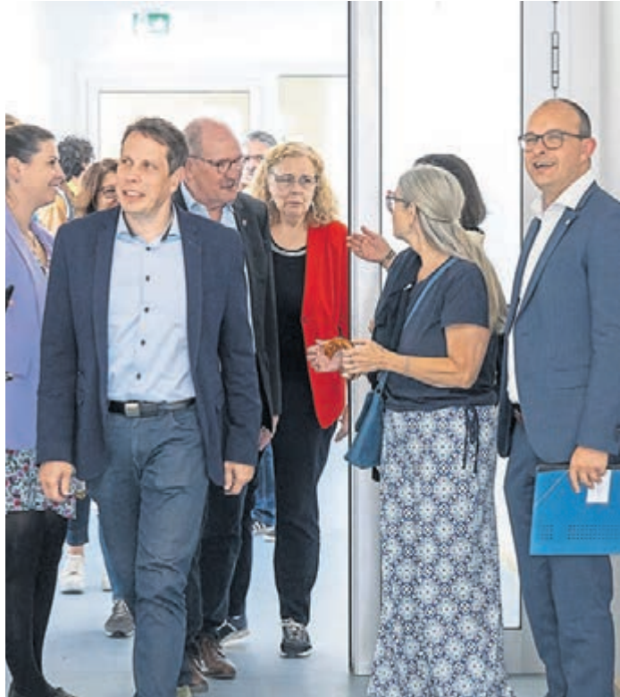
Das neue Gebäude 45 des Schuldorfs Bergstraße wurde kürzlich im Beisein prominenter Gäste eröffnet, darunter des Ersten Kreisbeigeordneten Lutz Köhler und des Landtagsabgeordneten Torsten Leveringhaus.

Übergabe des Gebäudes 45 am Schuldorf Bergstraße in Seeheim