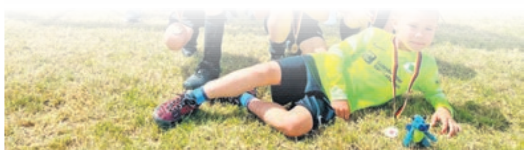
Die F-Junioren erreichten den vierten Platz beim F-Junioren-Cup des VfR Würzburg. Insgesamt traten zwölf Teams an.

www.plegge-medien.de/service/abonnentenservice