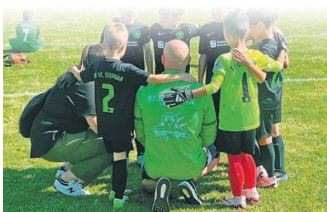
Die jungen Kleebblätter waren zwar enttäuscht, dass sie nur den vierten Platz erreichten, doch sie können auf ihre Leistung und das Erreichte stolz sein.

www.plegge-medien.de/service/abonnentenservice