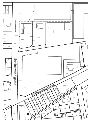
Anlage 1 zur Satzung über ein besonderes Vorkaufsrecht – Erweiterungsfläche Feuerwehr (genordet – ohne Maßstab)

Aufgrund der §§ 5 und 51 der Hessischen Gemeindeordnung (HGO) in der Fassung der Bekanntmachung vom 07.03.2005 (GVBl., Seite 142), zuletzt geändert durch Art. 2 des Gesetzes vom 16.02.2023 (GVBl., Seite 90, 93) sowie § 25 Abs. 1 S. 1 Nr. 2 des Baugesetzbuchs (BauGB) in der Fassung der Bekanntmachung vom 03.11.2017 (BGBl. I Seite 3634), zuletzt geändert durch Art. 3 des Gesetzes vom 20.12.2023 (BGBl. 2023 I Nr. 394) hat die Stadtverordnetenversammlung der Stadt Griesheim in ihrer Sitzung am 11.07.2024 die folgende Satzung beschlossen: