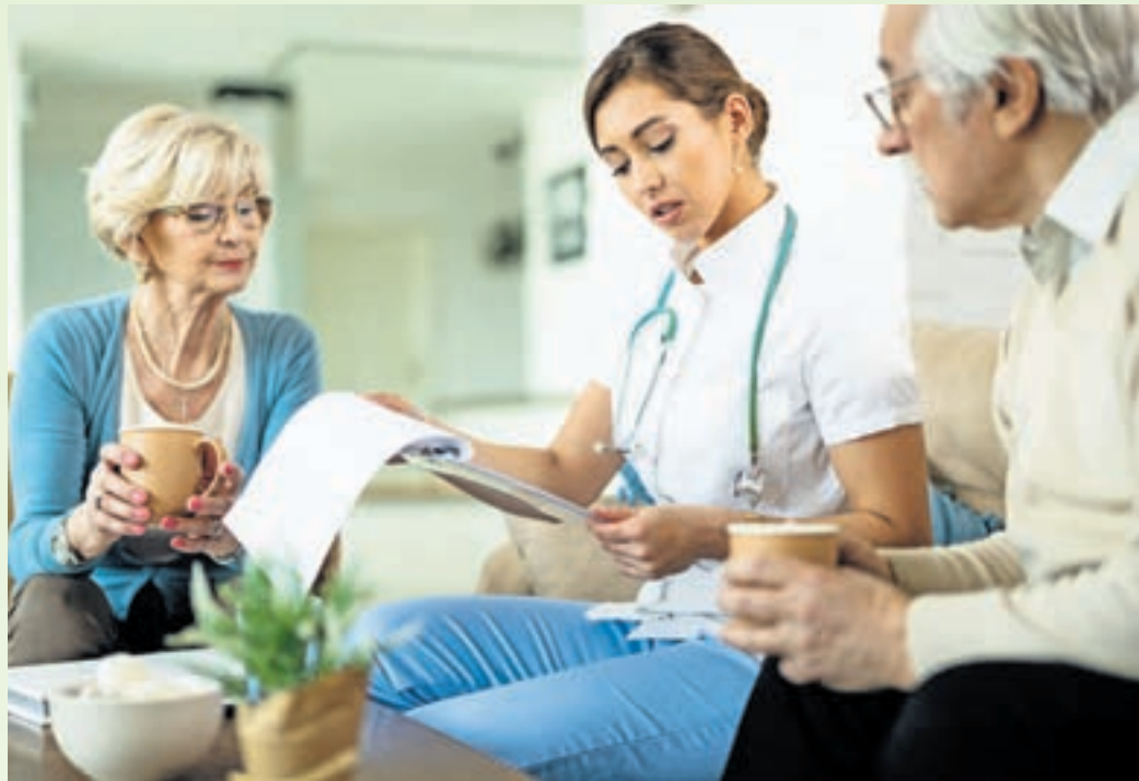
Mehr Pflegegeld, höhere Zuschüsse fürs Heim: Anfang des Jahres wurden viele Pflegeleistungen erhöht.

Ebenfalls um fünf Prozent gestiegen ist die Pflegesachleistung – also die Summe, die man monatlich für einen Pflegedienst ausgeben kann. Hier gibt es jetzt 761 Euro bei Pflegegrad 2, 1.432 Euro bei