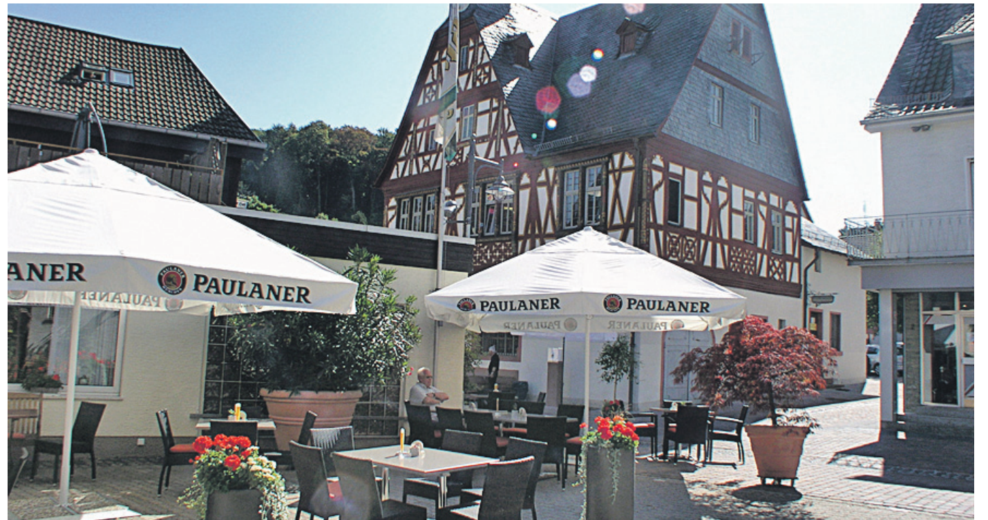
Noch bis Sonntag, 14. Juli, können die Gäste den Biergarten im Darmstädter Hof genießen, dann schließt der Seeheimer Traditionsbetrieb seine Pforten.

Nach 160 Jahren: Darmstädter Hof in Seeheim schließt zum 15. Juli