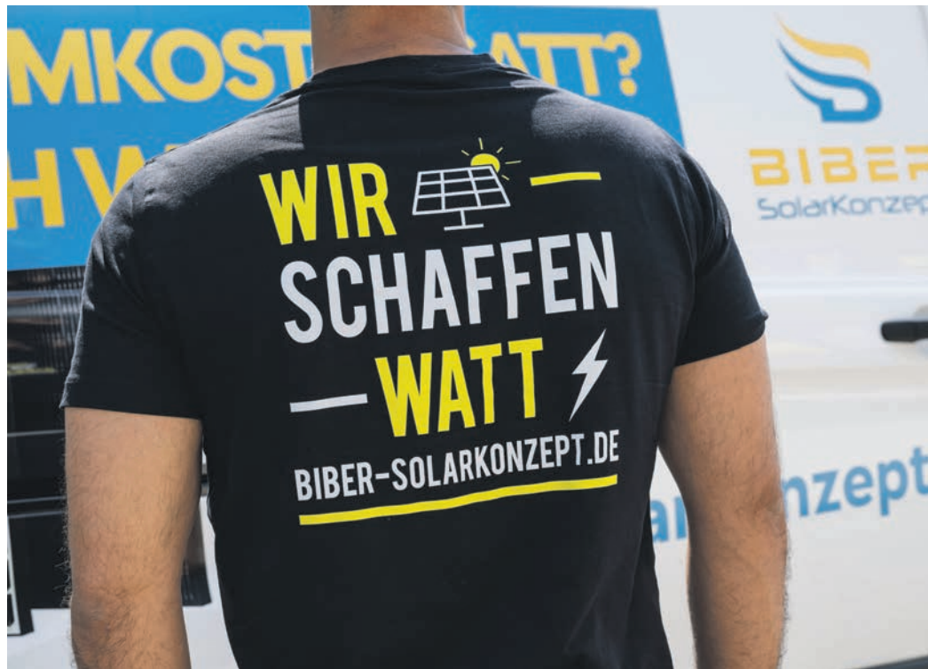
Getreu dem Motto „Wir schaffen Watt“ hilft das Team von Biber-Solarkonzept allen Interessierten dabei, die für sie passende Photovoltaik-Anlage zu finden.

Gernsheim (nic). Sich die Sonne vom Dach ins Haus holen und selbst Strom produzieren, statt teure Rechnungen zu bezahlen? Mit den richtigen Fachleuten an der Seite ist das heute problemlos möglich. Ein ausgezeichnete und kompetente Ansprechpartner in allen Fragen rund um das Thema Photovoltaik hier in der Region ist die Biber Solarkonzept GmbH aus Gernsheim. Der in der Emanuel-Merck-Straße beheimatete Fachbetrieb kümmert sich unter anderem um die Planung, Projektierung und Installation von schlüsselfertigen Photovoltaikanlagen, Stromspeichern und Ladestationen für Elektroautos. Das Unternehmen ist Ingenieurbüro und Komplettanbieter zugleich und zählt zu den führenden Firmen im Rhein-Main- und Rhein-Neckar-Gebiet.