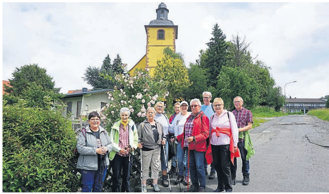
Die Eschollbrücker Wandergruppe beim Startpunkt des Babbelwegs in Neunkirchen.