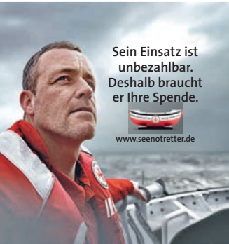
Sein Einsatz ist unbezahlbar. Deshalb braucht er Ihre Spende. www.seenotretter.de

SUCHE FAHRZEUGE PKW's, Busse, Geländewagen, Wohnmobile etc. für Export, Zustand egal, zahle Höchstpreise - sofort Bargeld, bitte alles anbieten, jederzeit erreichbar. 0151/71872306 Tel.: 06258/5089921