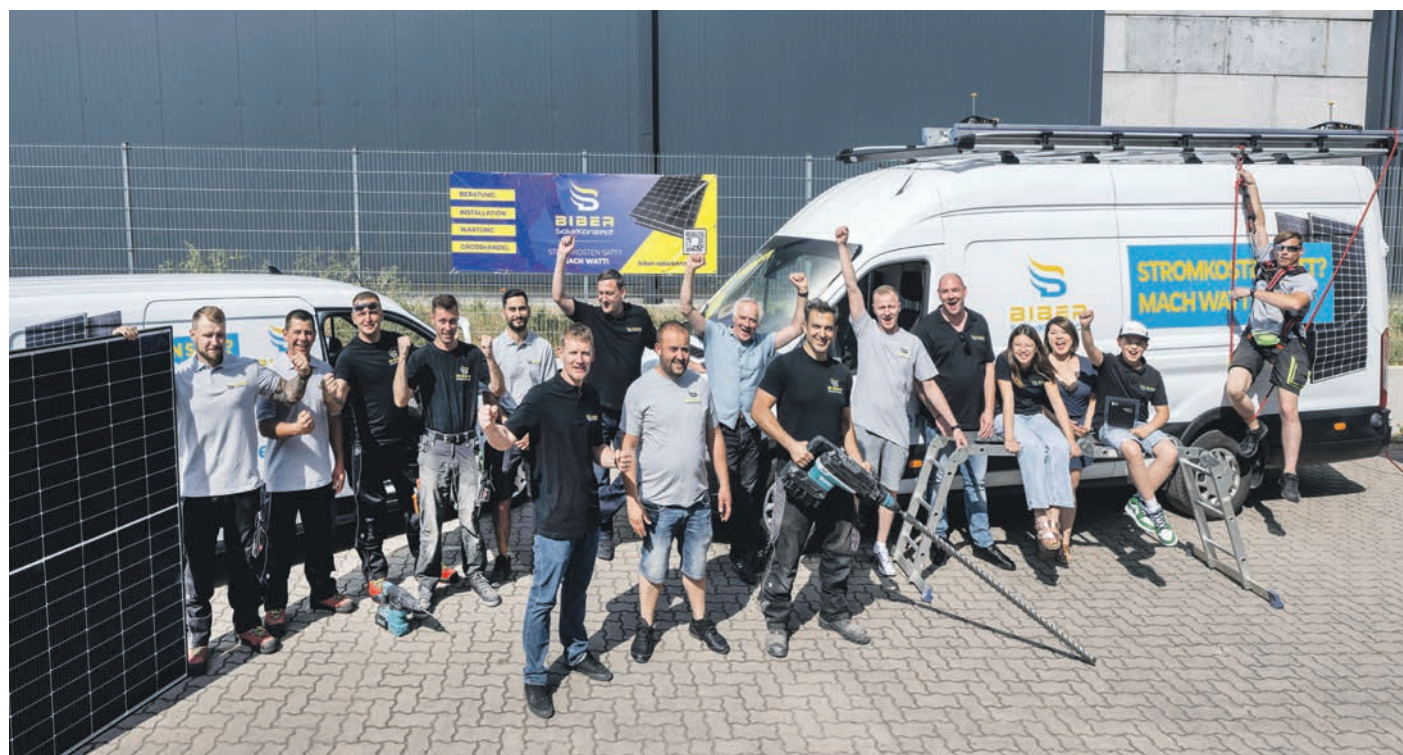
Das Team von Biber Solarkonzept kennt sich dank langjähriger Erfahrung in allen Fragen rund um das Thema Sonnenstrom bestens aus.