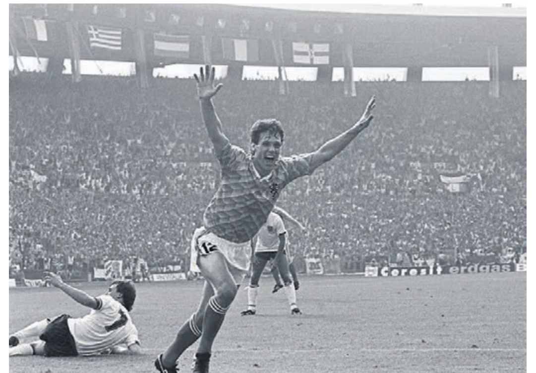
Der niederländische Stürmer Marco van Basten wurde bei der EM von 1988 mit fünf Treffern Torschützenkönig. Das Foto stammt vom 1:3-Sieg der Niederländer gegen England im Düsseldorf Rhein Stadion.

Angetreten waren neben Gastgeber Deutschland in der Gruppe Eins Italien, Dänemark und Spanien. In der zweiten Gruppe waren England, die Niederlande, Irland und die UdSSR, die damit zum letzten Mal bei einer Europameisterschaft teilnahm, versammelt. Einen klaren Favoriten gab es im Vorfeld nicht. Frankreich, dass 1984 bei der EM im eigenen Land mit Weltklassemannschaft gewann, hatte, war bereits in der Qualifikation gescheitert – unter anderem durch eine 0:1-Niederlage gegen die DDR, die es aber ebenfalls nicht in die Endrunde zum westlichen Nachbarn geschafft hatte.