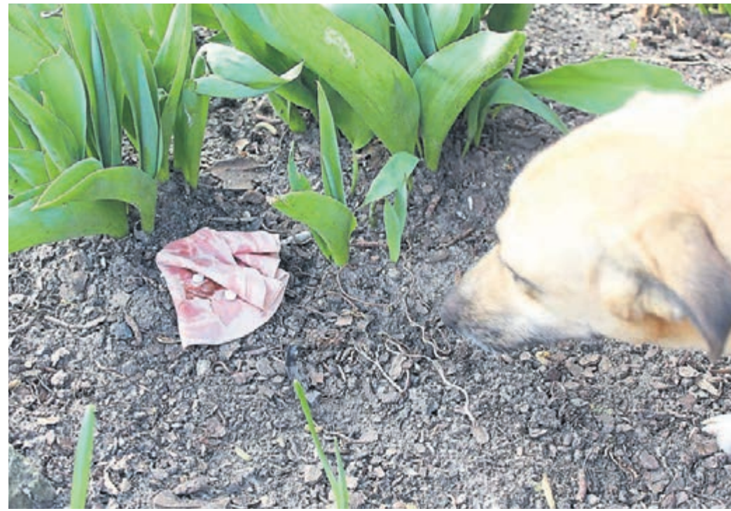
Mit giftigen Substanzen oder scharfen Gegenständen präparierte Hundeködter können tödliche Folgen für das Tier haben, ein qualvolles Verenden droht.

Jüngst berichtete eine Griesheimerin (Name ist der Redaktion bekannt) von einem Fall im Gebiet südliche Jahnstraße, bei dem eine Hundedame qualvoll verendete, wohl ausgelöst durch den Verzehr eines Giftködters. Seither haben die Hundehalter und die angesprochene Anwohnerin immer wieder aufklärende und informierende Flugblätter im Bereich des wahrscheinlichen Tatorts aufgehängt, die jedoch nach Aussage der Griesheimerin von einer