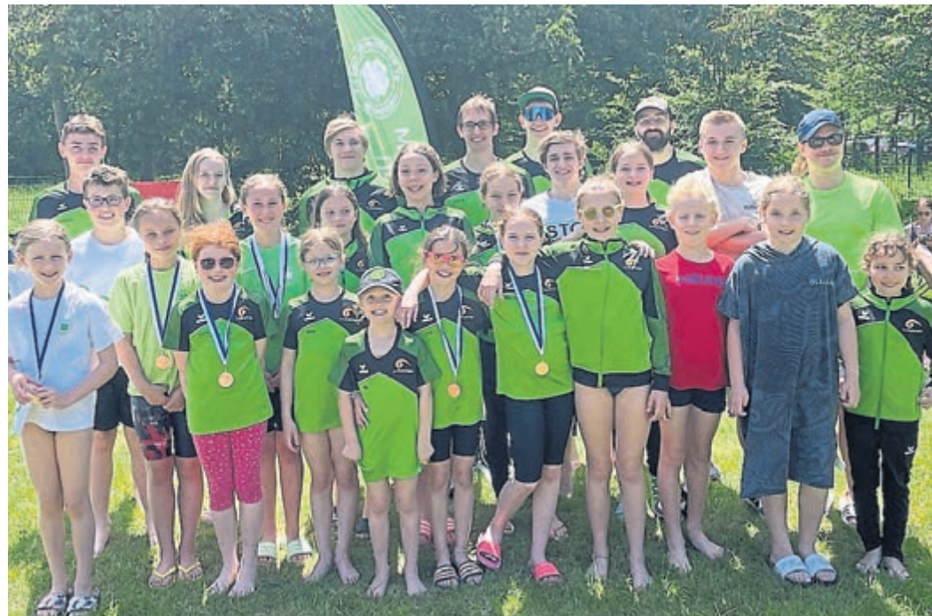
Das SVS-Team beim Wettkampf im Mörfelder Waldschwimmbad.

SVS-Schwimmer bei Freibadwettkampf am Start