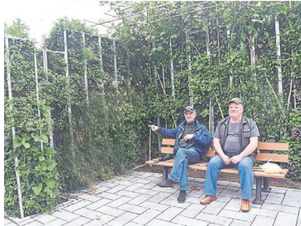
Mit dem „Grünen Zimmer“ hat die Stadt Griesheim eine neue schattenspendende Begegnungsstätte geschaffen, die zum Verweilen einlädt.

Das „Grüne Zimmer“ besteht aus speziell an der Universität Stuttgart entwickelten „Baumwänden“ und mit unterschiedlichen Stauden bepflanzten Modulbaukästen. Mit 30 Pflanzenarten und rund 6900 Pflanzen auf einer Vegetationsfläche von 140 Quadratmetern entstand ein vielfältiges Muster aus blühenden und immergrünen Pflanzen. Ein „Dach“ aus „baubotanisch“ miteinander verbundenen jungen Platanen spendet Schatten und sorgt für Abkühlung. Eine Bewässerungsanlage, die sich aus Regenwasser speist, sorgt dafür, dass das „Grüne Zimmer“ nachhaltig betrieben werden kann. Komplettiert wurde die innerstädtische Maßnahme zur nachhaltigen Begrünung und Belebung der Innenstadt durch zwei Mooswände. Mit Hilfe von speziellen Moosen absorbiert die freistehende Vertikalbegrünung verschmutzte Luft und wandelt schädliche Inhaltsstoffe in Biomasse und frische Luft um. Darüber hinaus dient