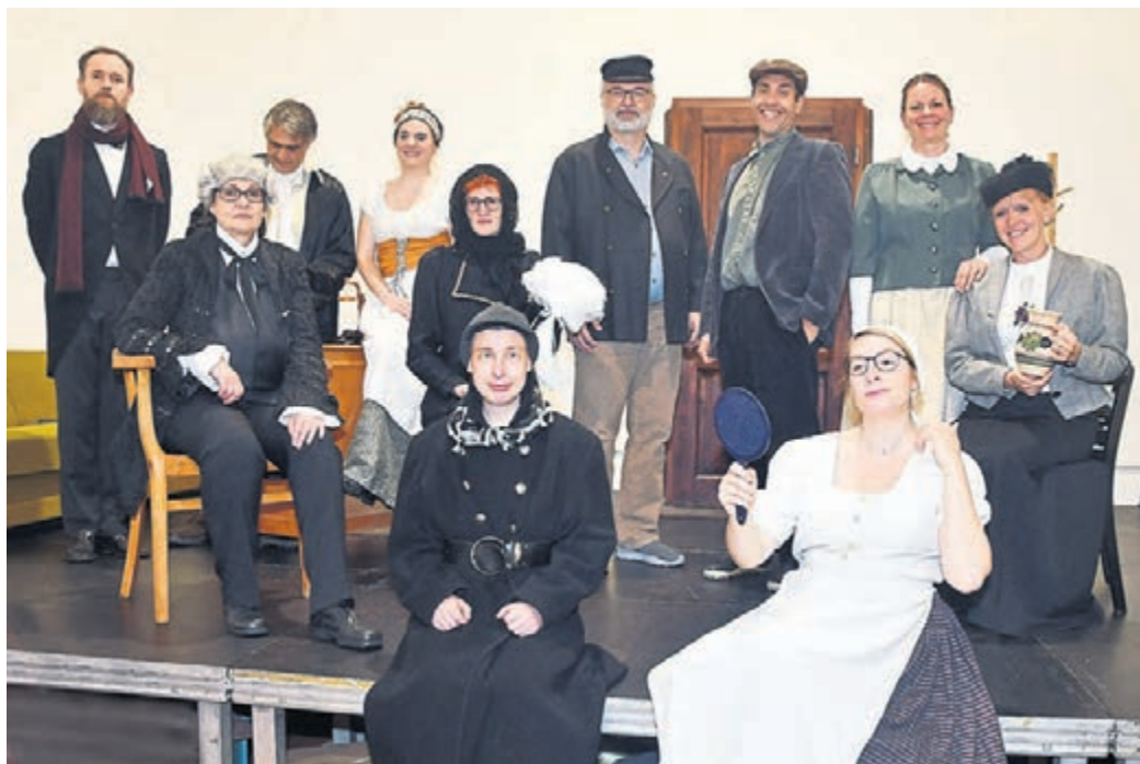
Die Amateurschauspieler der TuS-Zwiebelbühne proben derzeit für das Lustspiel „Der zerbrochene Krug“ nach Heinrich von Kleist.