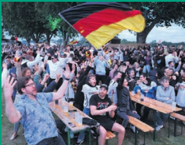
Pure Freude: Der Auftaktsieg der Deutschen gegen Schottland am vergangenen Freitag wurde im ganzen Land aufmerksam von zahlreichen Fans verfolgt, wie am Rheingold in Gernsheim (Bild).

(Die Achtelfinale, die ab Samstag, 29. Juni, ausgespielt werden, standen bei Redaktionsschluss noch nicht fest.)