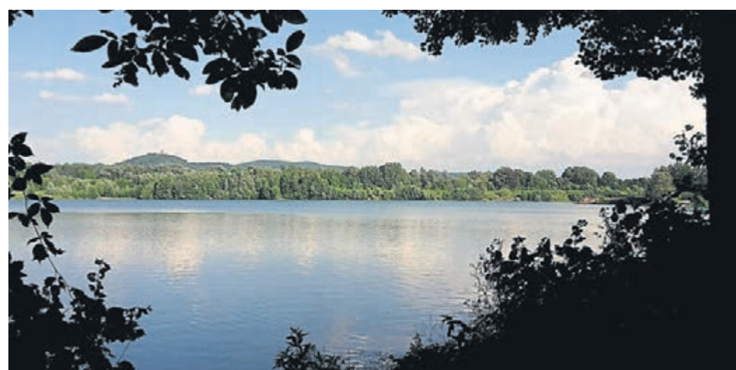
Bei der Erlache in der Nähe von Bensheim wurde unlängst die Leiche einer 40-jährigen Frau gefunden.

Mordkommission ermittelt / 49-Jährige weiter vermisst