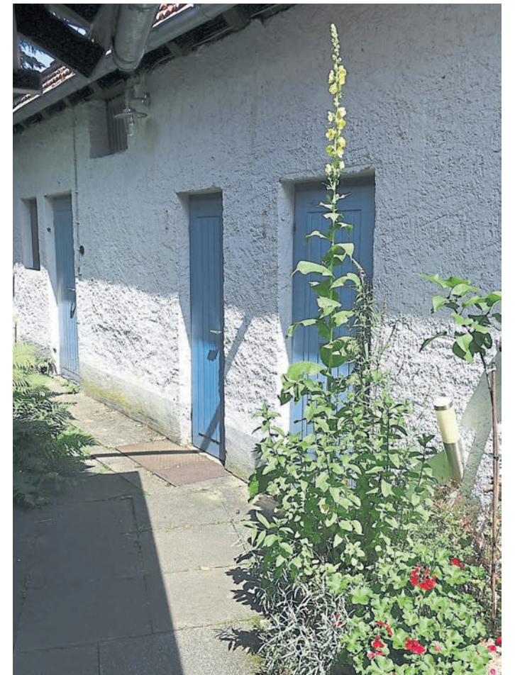
Hähnlein (red). Eine stolze Höhe von 2,40 Meter erreicht diese wild aufgewachsene Königskerze im Hof von BW-Leser Günter Ahlheim, die damit fast bis an die Dachrinne des Nebengebäudes reicht.