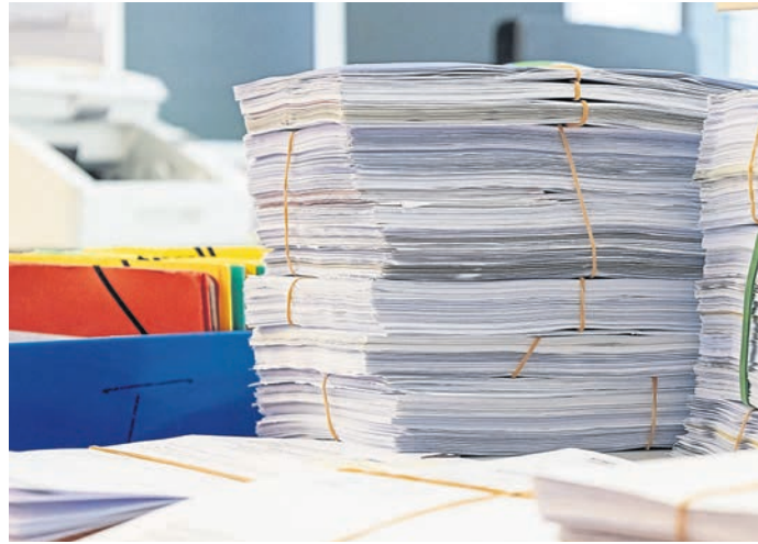
Dank der E-Akte nimmt der Papierverbrauch im Kreis Darmstadt-Dieburg zunehmend ab.

Kreis Darmstadt-Dieburg (red). Nachdem die Verwaltung des Kreises Darmstadt-Dieburg am 7. Juni der Öffentlichkeit beim Digitaltag im Kreishaus in Kranichstein einige ihrer Errungenschaften in Sachen Digitalisierung präsentiert hatte, folgte am Donnerstag, 20. Juni, mit dem Digitalisierungsmarktplatz eine Veranstaltung für die Mitarbeitenden. „Ein wichtiger Baustein in einer zunehmend digitalen Arbeitswelt ist die E-Akte, die es seit einigen Jahren in der Kreisverwaltung gibt - und für die seit zwei Jahren ein einheitliches System im Haus eingeführt wird“, erklärt der Kreis in einer Mitteilung an die Presse. Diese werde mittlerweile von zehn Fachbereichen genutzt. Die elektronische Akte mache Ordner und Hefestreifen überflüssig und helfe, Papier zu sparen. „In Hessen war