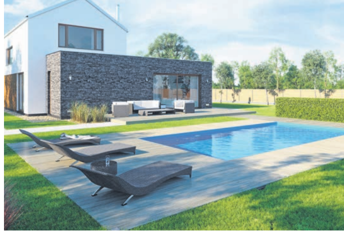
Der feste Pool macht deutlich mehr Spaß und ist zudem langfristig gesehen auch viel umweltfreundlicher als ein Aufstellbecken aus Plastik.