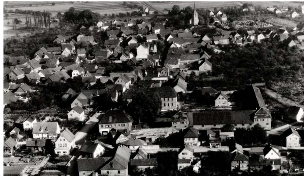
Bickenbach (ps). Aus dem Bestand des Geschichts- und Museumsvereins Bickenbach stammt diese Postkarte aus dem Jahr 1960, die Bickenbach aus der Vogelperspektive zeigt. Das Jagdschloss und die evangelische Kirche sind deutlich zu erkennen.