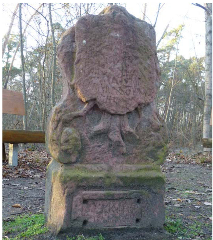
Zu Ehren seines Freundes, Großherzog Franz-Stephan, der später als Franz I. Kaiser des Heiligen Römischen Reiches wurde, ließ Landgraf Ludwig VIII. von Hessen-Darmstadt ein Ehrenmal im Bickenbacher Wald errichten.