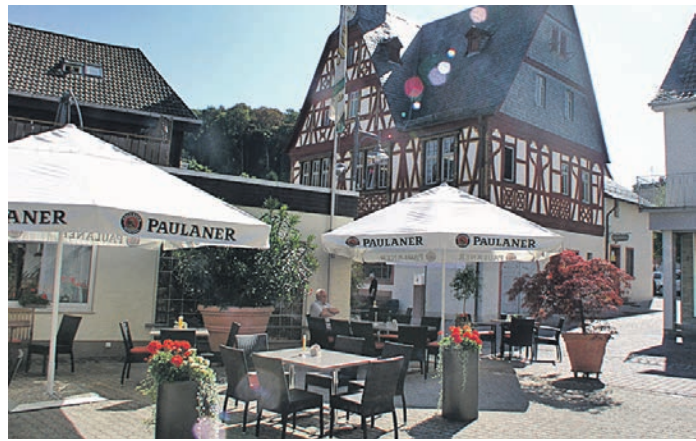
Noch bis Sonntag, 14. Juli, können die Gäste den Biergarten im Darmstädter Hof genießen, dann schließt der Seeheimer Traditionsbetrieb seine Pforten.

Seeheim (ps). Mit dem „Darmstädter Hof“ schließt eine echte Seeheimer Institution am 14. Juli ihre Pforten für immer. Damit geht eine 160-jährige Erfolgsgeschichte ihrem Ende entgegen. Seit 1864 hat der Familienbetrieb im historischen Zentrum Seeheims nahe dem Alten Rathaus seine Gäste aus Nah und Fern mit leckeren Gerichten sowie freundlichem und stets familiären Ambiente gelockt. Für Generationen von Gästen war der Besuch im Darmstädter Hof fester Bestandteil des Freizeitens.