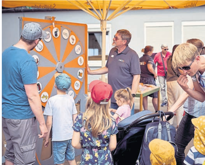
Die ZAKB hatte kürzlich zu einem Tag der offenen Tür mit vielen Aktionen und Attraktionen eingeladen.

„Vor allem die Touren als Beifahrer in den riesigen Radladern, die Möglichkeit, eine Mülltonne einmal selbst an einem echten Sammelfahrzeug zu leeren oder mit einem Bagger ein großes Loch zu graben, sorgten für viel Spaß – nicht nur bei den kleinen Gästen“, erklärt der ZAKB. „Aber auch die Führungen durch die Biogas- und Abfallsortieranlagen sowie die Vorführung der Grünschnittaufbereitung,