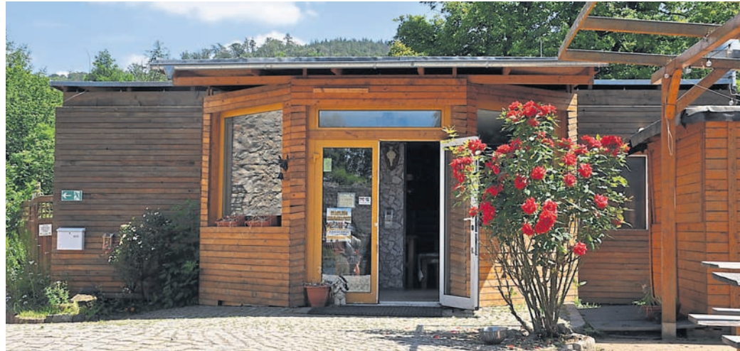
Die Tür steht offen, doch aufgrund eines Hangrutschs sind das Alsbacher Schloss und die dazugehörige Burgschänke nur eingeschränkt zugänglich.