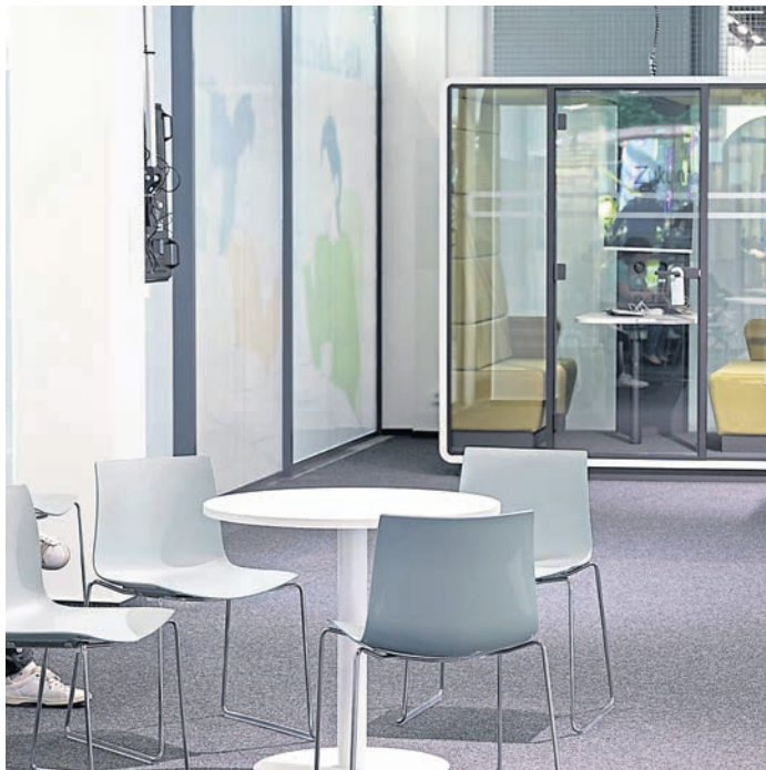
Die Kfz-Zulassungsstelle des Kreises Darmstadt-Dieburg ist seit Ende April im Loop5 in Weiterstadt ansässig. Künftig sollen auf den rund 400 Quadratmetern auch weitere Fachstellen untergebracht werden, etwa das Sozialamt.

Zu den ersten Dienstleistungen die Kfz-Zulassungsstelle teilt der Kreis weiter mit, dass Termine wie gewohnt online gebucht werden können. Das gelte auch vorübergehend für die Zulassungsstelle Pfungstadt, deren Mitarbeiterinnen und Mitarbeiter seit Montag, 27. Mai, ebenfalls dort arbeiten – so lange, bis neue Räumlichkeiten für die Zweigstelle zur Verfügung stünden. „In Kürze wird bekannt gegeben, wo die neue Zulassungsstelle in Pfung-